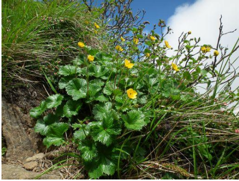
ミヤマダイコンソウ