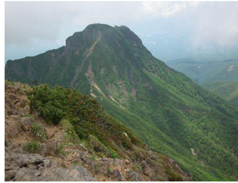
山頂より阿弥陀岳 左：赤岳山頂