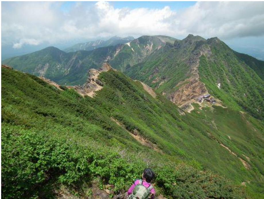
赤岳山頂下よりみる横岳から硫黄岳への稜線、鞍部に建つのが展望荘