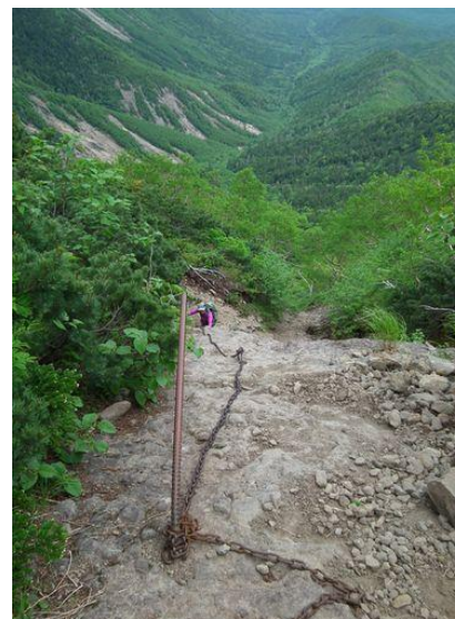
左：最初のクサリ場 右：次々と現れるクサリ場