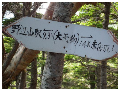
大天狗樹林の中のピーク