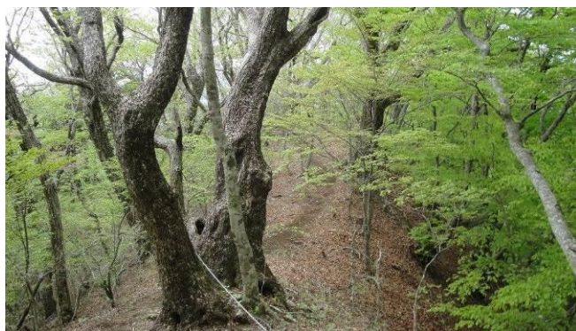
今日一日、森林浴ハイキングで充実した山行がつづく