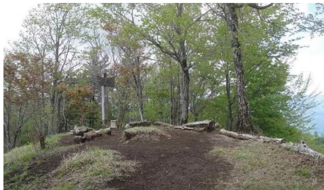
展望がイマイチであったが伐採されて素晴らしいロケーションが待っていた二十六夜山