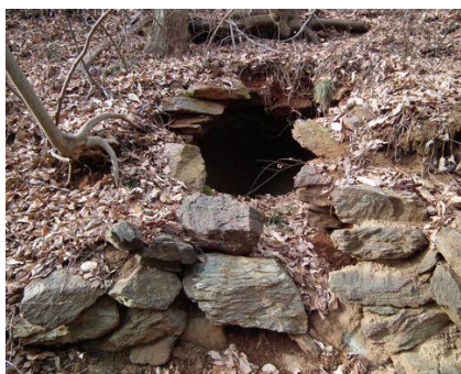
左：炭焼き跡 炭で煮炊き、消壺など懐かし く思い出す。