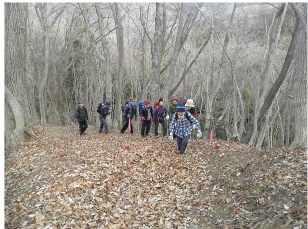
皆のもの続け！ ちょっと落ち葉が深いね！