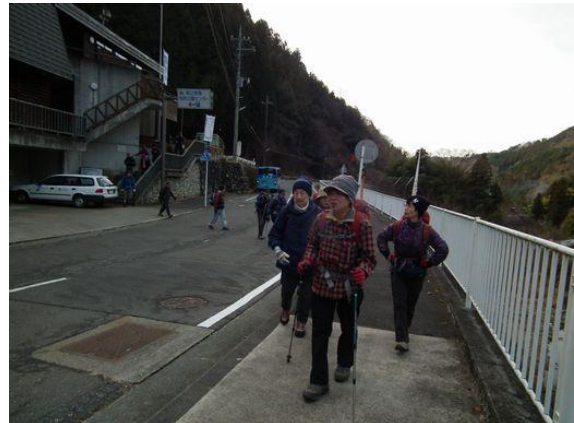
和田バス停から登山口へ、ここは相模原市緑区です。横浜とは違って寒い！ 温度差約5~6度