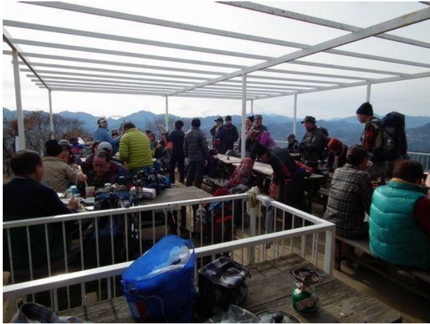
居酒屋「陣馬」他人事ながら歩いて帰れるのか？ 和田峠へはタクシー来ないのにな！