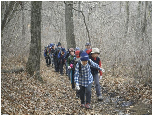
そう言うものの“心配”しかし上りは強いね!