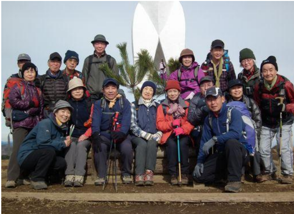
陣馬山白馬を背に記念写真 撮影をお願いした方の手の震えが妙に気になった中の 一枚、手振れもなく素敵な写真でした。 ひよっとするとプロかな？ 左下：山頂を後に…