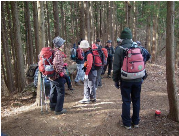
ようやく一ノ尾根分岐、これからしばらく ほぼ平坦な道が続く