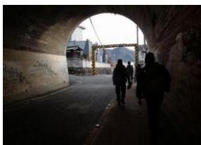
ゴール近くの隧 道を行く、大変お 疲れ様でした。