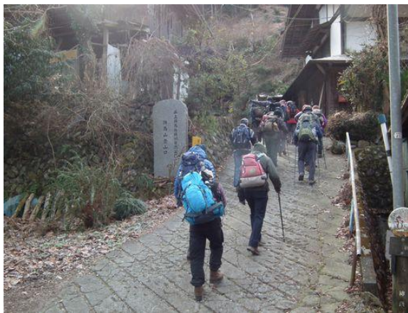
和田登山口から山へ、民家の間は一番の急登、ここは若い者に任せてはおけないと、長老の出番とトップは私と…先輩は立てないとね！