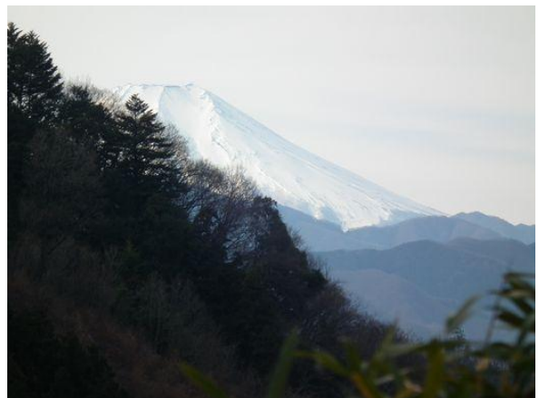
本日初の顔見世、尾根の片隅に“ちょっと”だけよと! これを見ないと山へ来た気にならない。