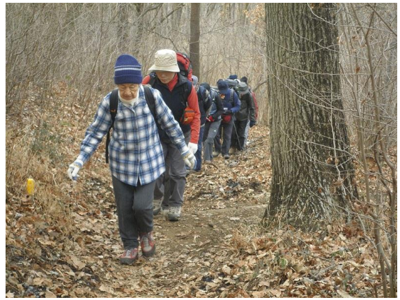
相変わらずトップ!