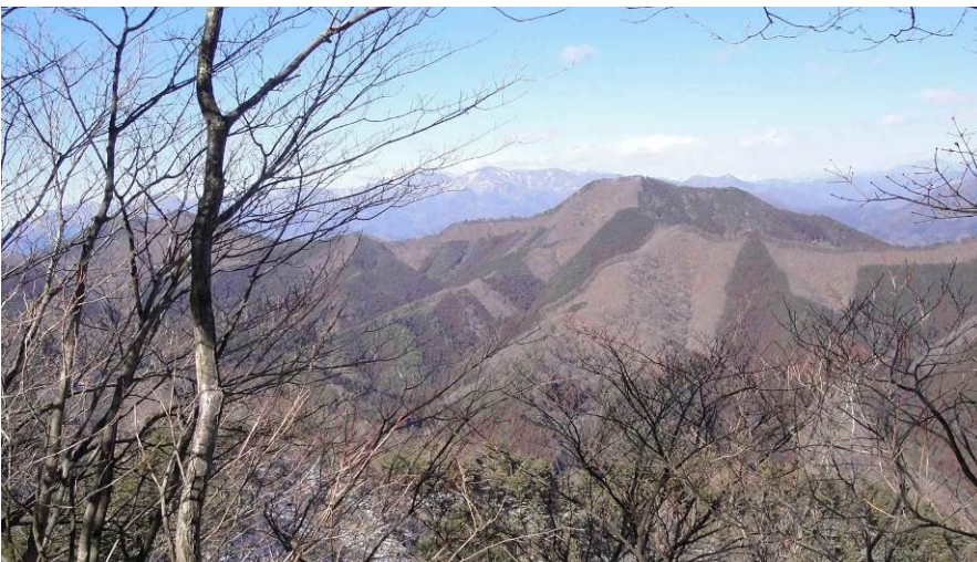
倉岳山—高畑山の稜線と 小金沢蓮嶺