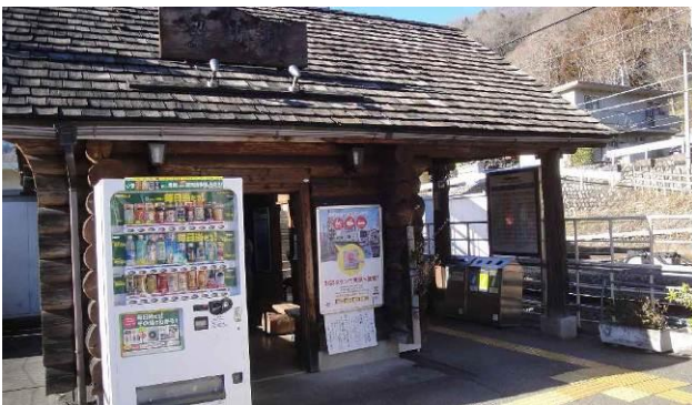
積雪のために予定時刻より 45分ほど遅れて無人の梁川駅に到着