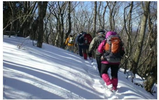
二十六夜山から先はトレースがない楽しい歩きが・・・・・・ 大きな岩は左に巻いて