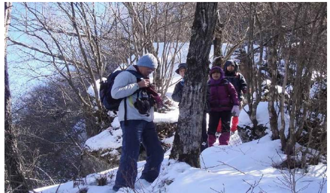
しかしこの先は急斜面、いよいよアイゼンを装着します