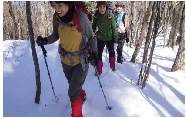
乾燥した積雪でさらさらと