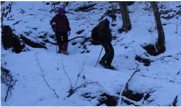
立野峠から北側斜面を下る アイゼンを装着して.....