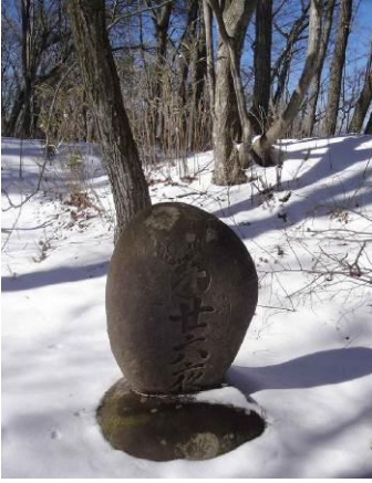
平坦なお月見に適した場所に二十六夜塔がありました (四年前に訪れた時には倒壊していたが修復されていた)