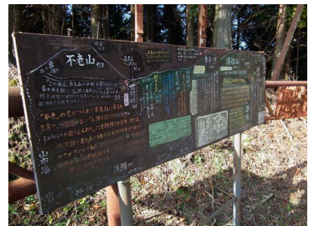
この山域にはこのような説明板のようなものが多く設置され散る。読みながらも山歩きも楽しいかもしれないが、時間がない！