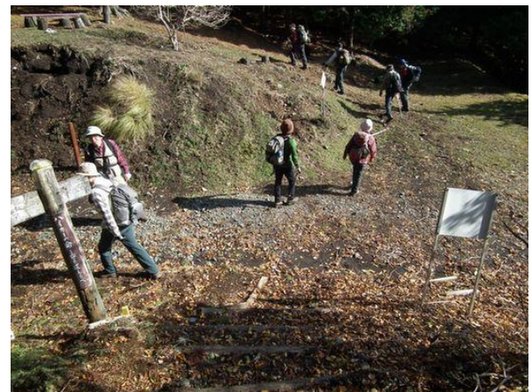
世附峠、左へは西丹沢世附へ下る道だが、崩壊のため通行できない。