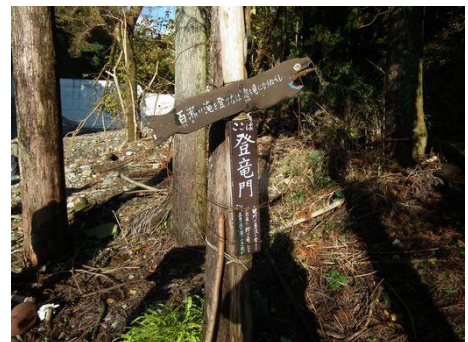
登竜門へ無事下山、 さあ、駅へ急ごう！ 缶ビールが待っている。 しかしながら、今日は日曜日、少ない店は閉まっていたり、準備中だったり、皆さん真面目に家路に… よけいに重くなった足で駅の階段を上る。お疲れ様でした！