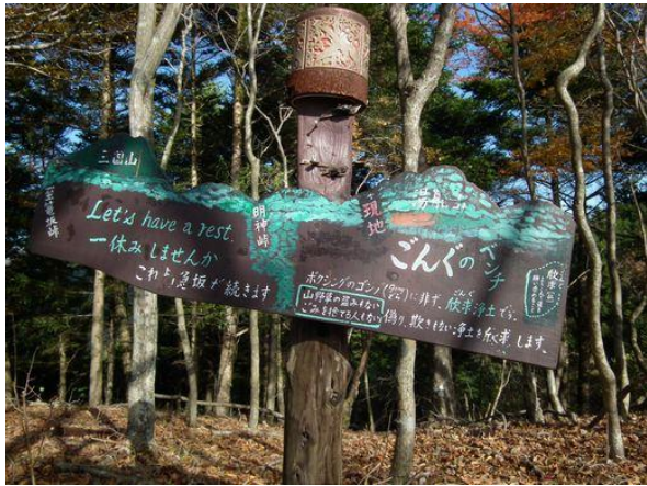
ごんぐのベンチとは？