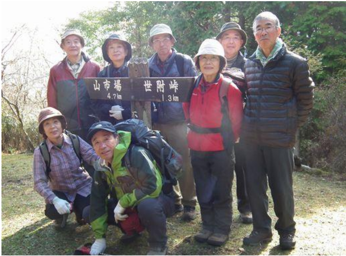
上：三回目にして不老山登頂、近くて遠い山だった。 CLさんこれからも宜しく！