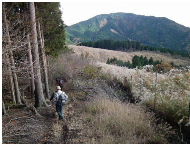
峰坂峠先より不老山を見る。まだまだ遠く感じる。柵で保護された茅の原が印象的