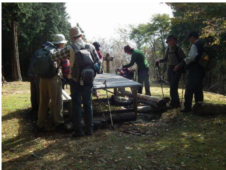
不老山到着、休憩のための席割中です。 陽のあたる場所は俺だ！ いや！ 私よと...