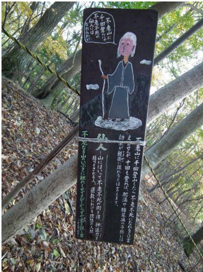
千回登山で不老不死にはなれないと！ それだけ登れば足腰痛めて、寝たっきりと！