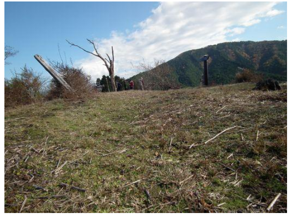
樹下の二人の老人 9 人、まだまだ頑張ります