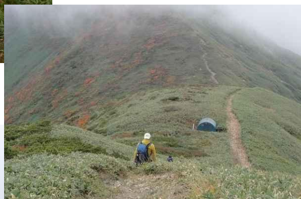
いくつかのピークを越え 最後の岩場をトラバースして 朝日岳に・・・