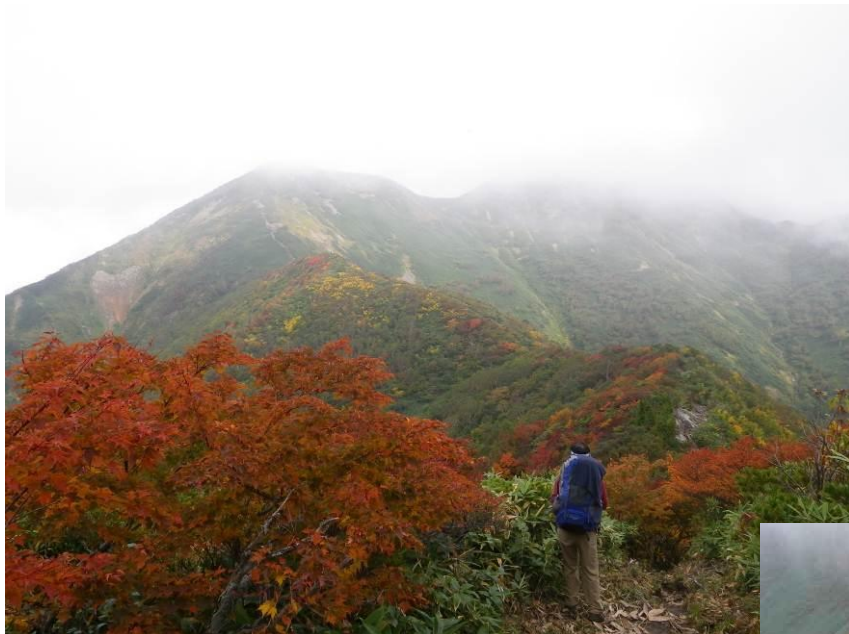
うすいガスに覆われている笠ヶ岳へ 笠ヶ岳山頂直下にある避難小屋