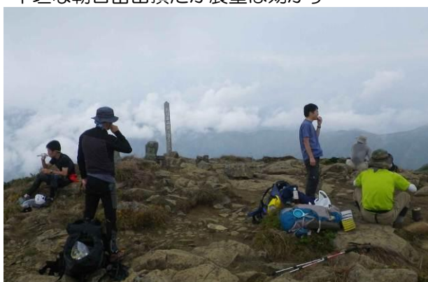
朝日岳山頂から 宝川温泉へのルートがある そして池塘群の水場で明日の 分も含め、4Lを確保する