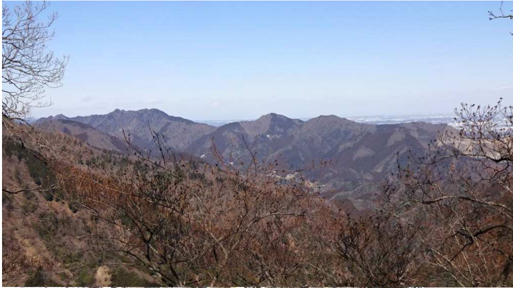
そして相州アルプスの 全景