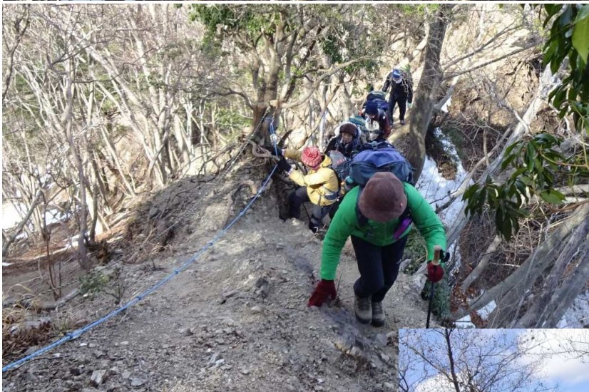
本日の核心部である 最後のザレ場

登り切ったところは バリエーションルート大好きな人 にとっては、「聖地」にあたる 大沢分岐。ここからまっすぐに進めば 大山山頂および大山三峰へ行ける 三叉路