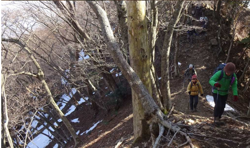
すり鉢広場の先、東屋で休憩