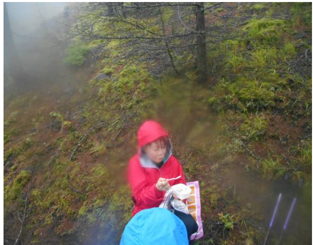
もう一人はしっかり座っての昼食