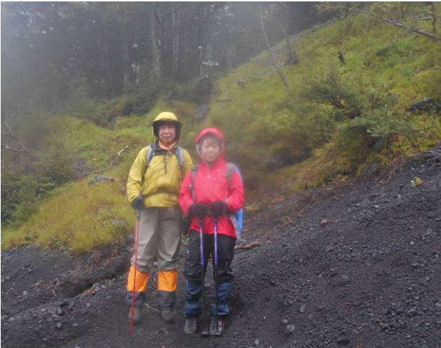
御殿庭入り口を過ぎ大きな沢での記念写真 富士山らしいざれた砂の場所 カメラのレンズも水滴がついていた