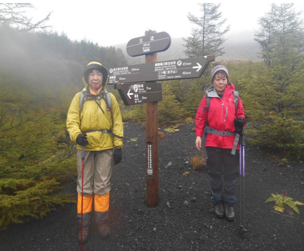
三辻に到着 少し天候が回復してきた 行く方向に二子山がはっきり見える