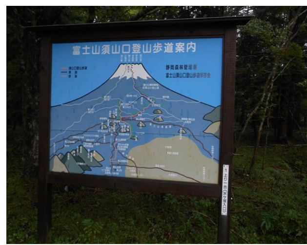
須山口登山歩道の案内図