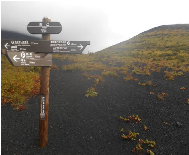
4辻に到着 右上が二子山の一つ