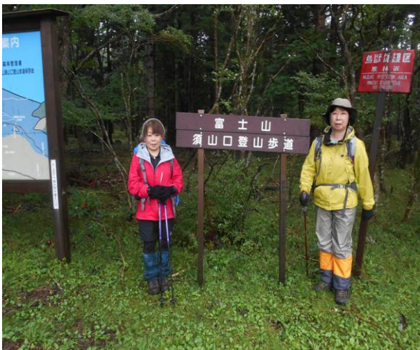
須山口登山道入口 水ヶ塚公園は道路の 反対側 無事に下山しました