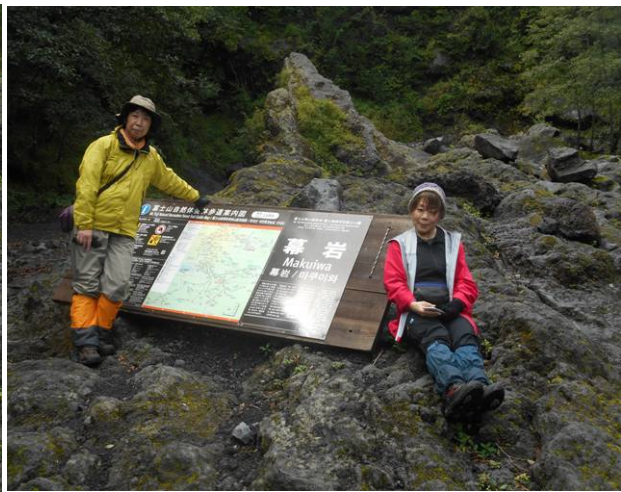
幕岩での記念写真