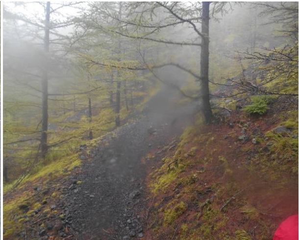
昼食場所の登山道 ひとが来ないので 道の真ん中で