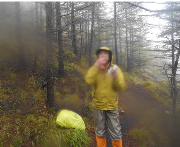
雨の中立つての昼食