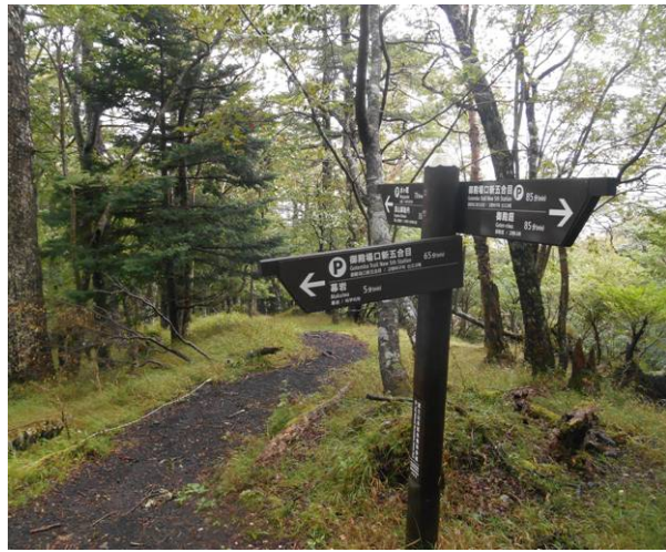
幕岩分岐 約5分でザックをここに デポで幕岩まで下る