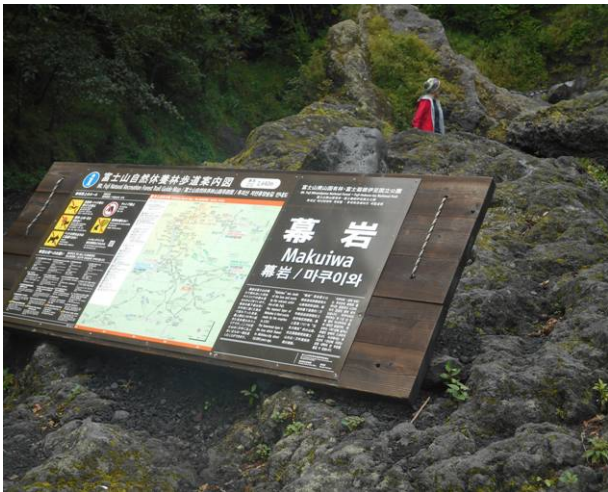
幕岩は正面奥の岩