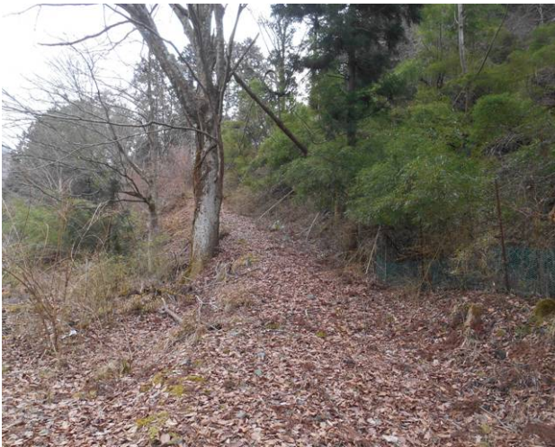
登山口（昔の作業道と思われる）

昨年行った玄倉－日影山－秦野峠－高松山のコースを一部変更して秦野峠－シダゴ山－寄バス停で行った、雪の心配もあったが、昨年同じ時期で雪は無かったので今回の無い事を期待して出かけたこの時期の西丹沢ビジターセンター行きのバスは空いていて、全員が座る事が出来た、休日なので出発時間が15分遅くなる、玄倉バス停近くの日陰には雪が残っている所もあったが、日影山までのパルルートでは、全く雪は無かった、