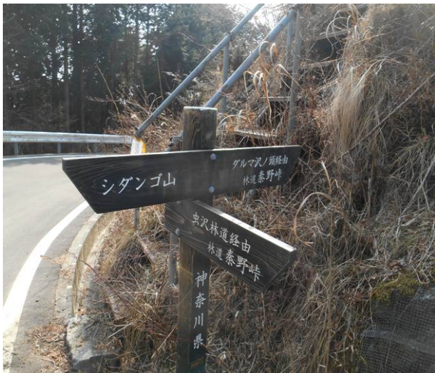
秦野峠からの迂回ルート of 虫沢林道