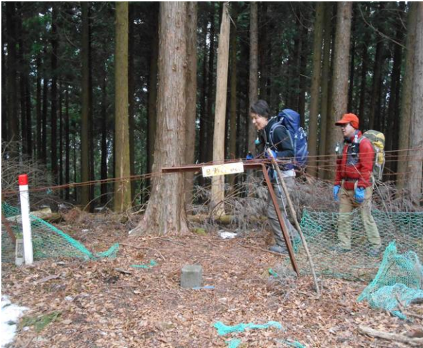
日影山に到着鹿柵に山名標識