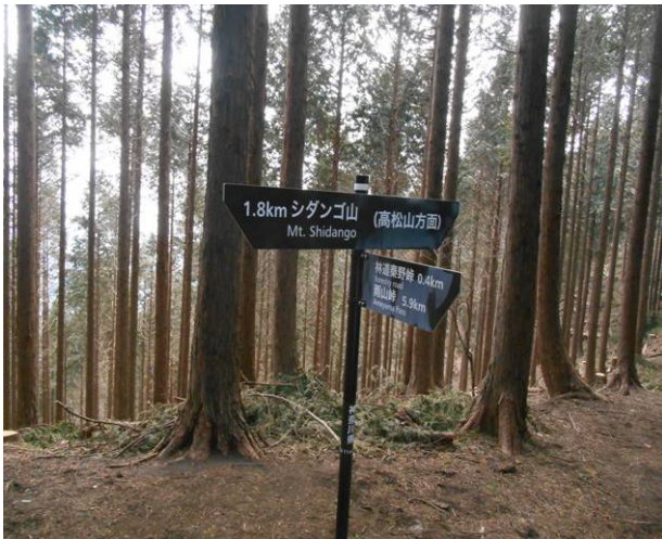
高松山への分岐ここまではかなりの急登