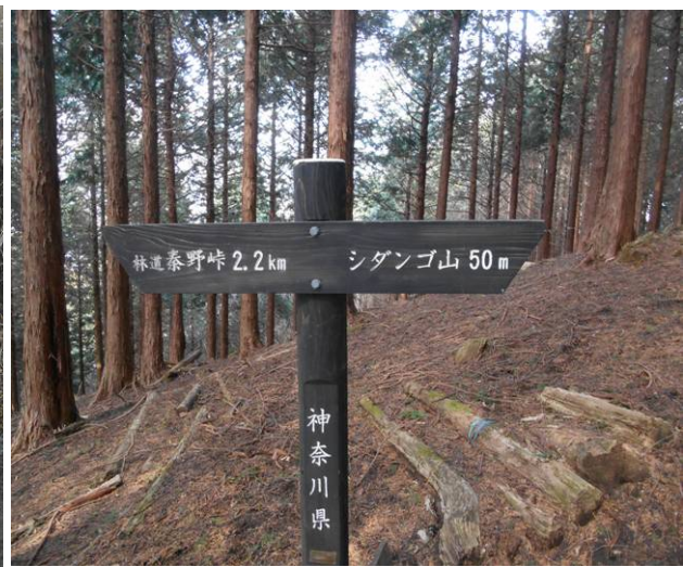
シダゴ山へ後50mの標識