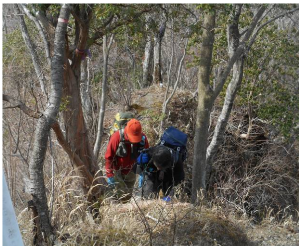
秦野峠への最後の登り