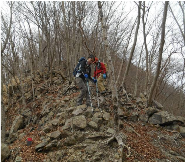
日影山からの下り 岩の多い急な下り 注意しながら降りた