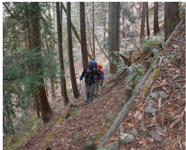
いきなりの急な登り 道が狭く注意が必要