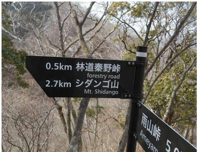
伊勢沢の頭-秦野峠コースの分岐