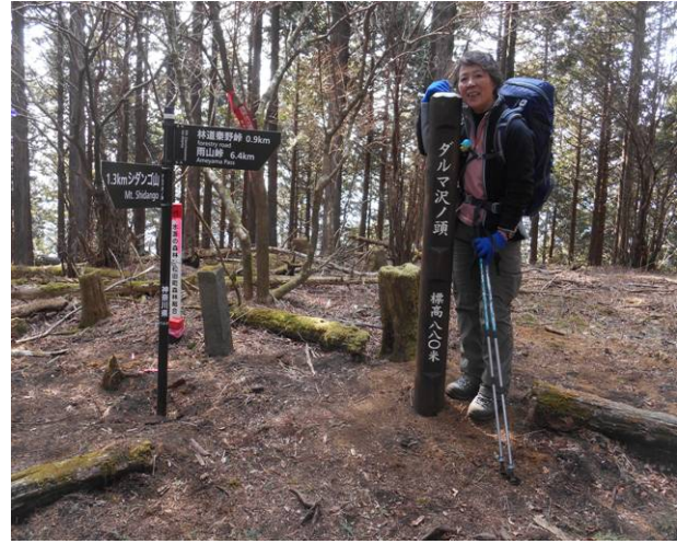
ダルマ沢ノ頭に到着