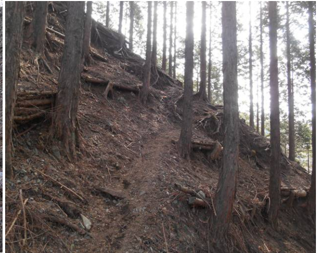
道は狭く荒れている