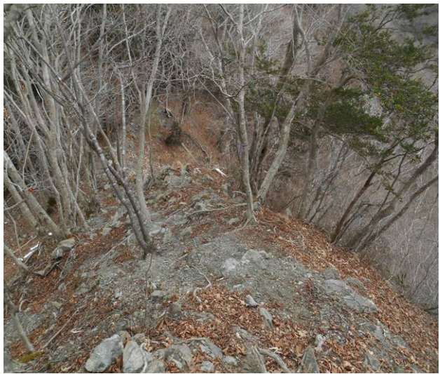
急な下りの先は細尾根へと続く