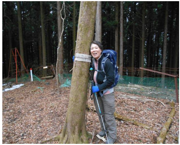
すぐ側の立ち木に手製の標識があり (ブッシュ平の名前の書いてあった)