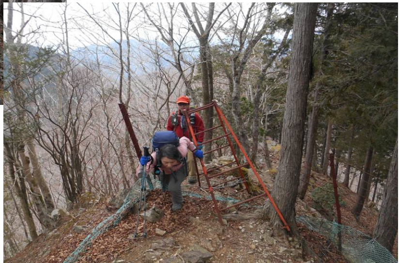
鹿柵をくぐり抜けて