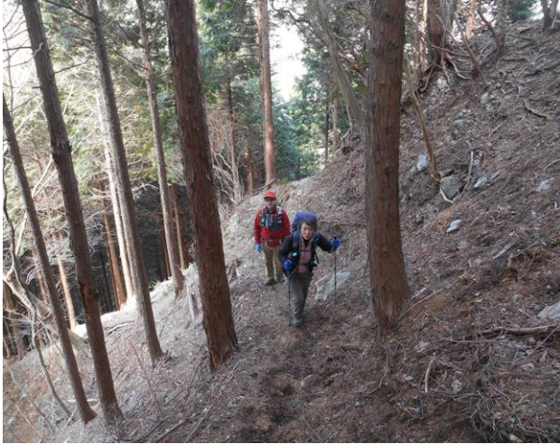
秦野峠よりダルマ沢ノ頭に向かう急な登り