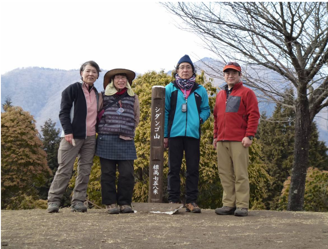
団体さんの下山後で シダング山での記念写真