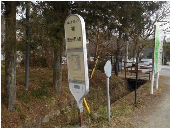
本日のゴール寄バス停に到着 バス待ち時間 約15分途中の時間調整が うまくいきました。