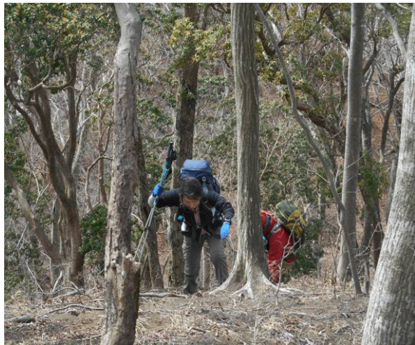
秦野峠までの急な登りが続く