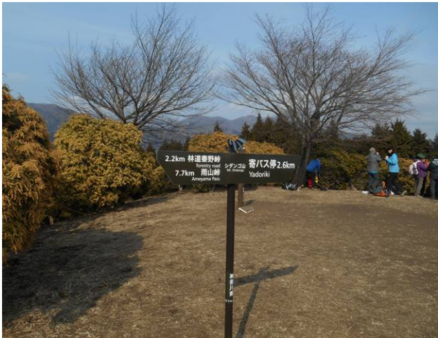
シダング山へ到着 団体さんが下山の準備中