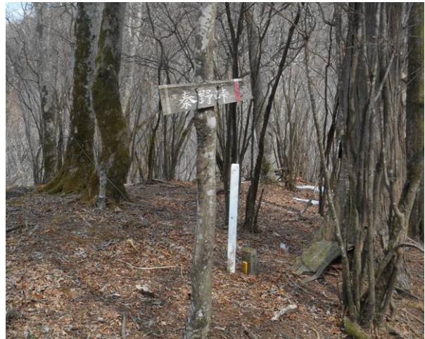
本日最初のルート標識