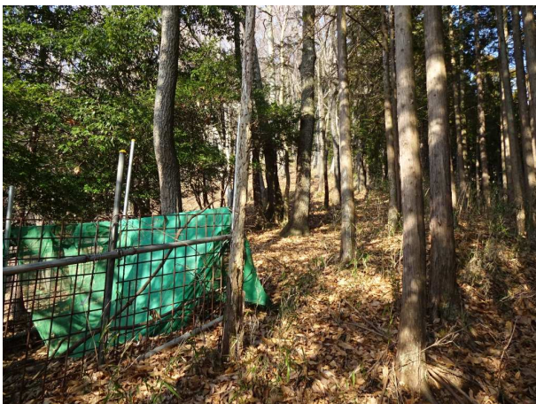
少し下り上り返すと、手入れのされた登山道に出た 以前は伊勢原市公認のハイキングルートだった。

植林帯の急斜面を登ると広い尾根に、強風で埃が舞い立つ 右は藪が濃く、左が開けているので、踏み跡をしばらくウロウロ降りたり登り返したり、ようやく右藪の中に以前ここを歩いた時貼った赤テープを見つけた