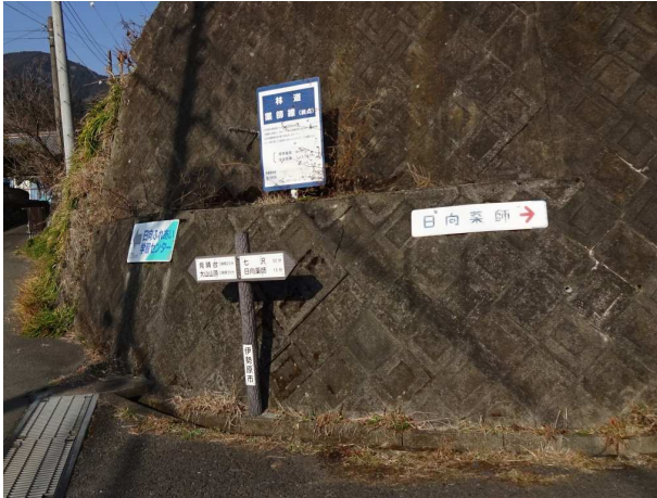
すぐにイノシシ柵がある

今日は先月 18 日、梅ノ木尾根から天神尾根に降りるルートを見落としてしまったので、その確認に再訪した 薬師林道に入り 3 分で左に階段があるところから取付く