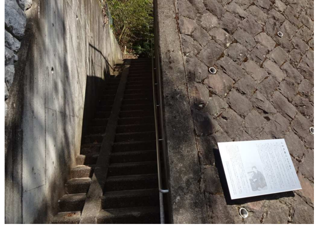
七沢城址跡に七沢リハビリテーション病院は建っている