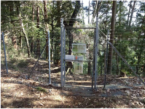
鹿柵扉を越えるとすぐに七沢温泉福元館前に降り立つ