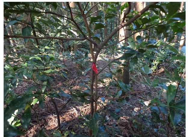
335mピーク着、左方向に日向山荘ルート