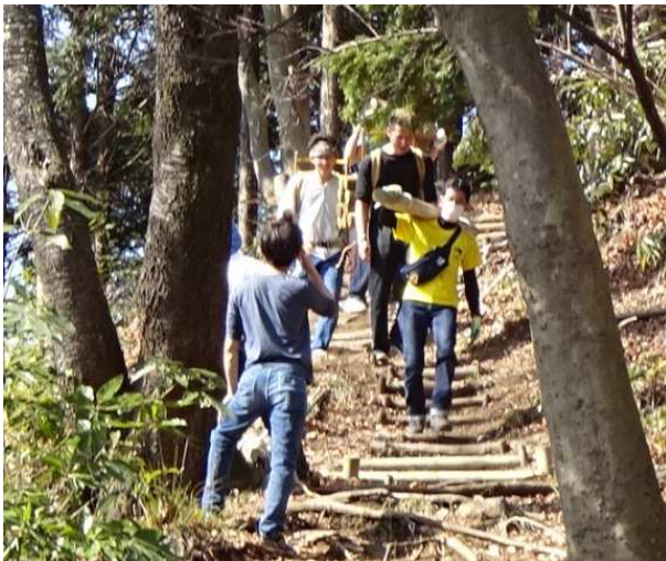
それは広沢寺温泉への登山道を整備していたのだった