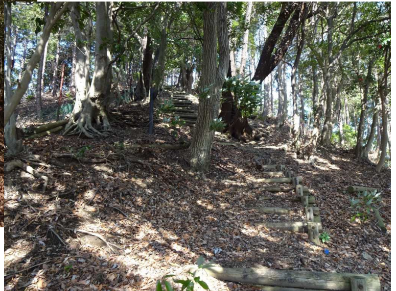
登り始めて 70 分で梅ノ木尾根に出た