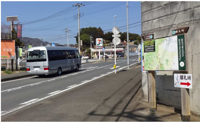
巡礼峠へ向かう途中からの展望