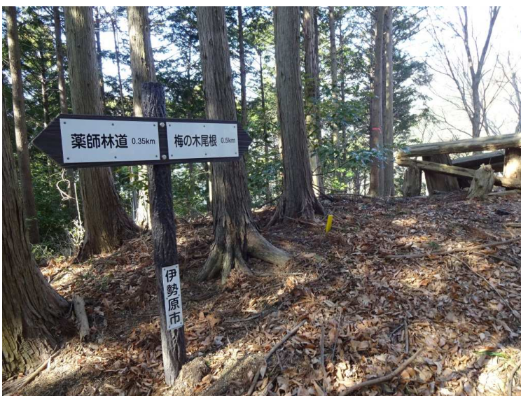
現在は完全に廃道となっているが道標は撤去されず