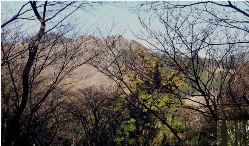
弁天御髪尾根が沢越しに見える