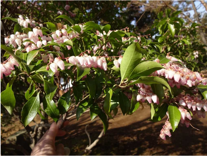
馬酔木の花が満開