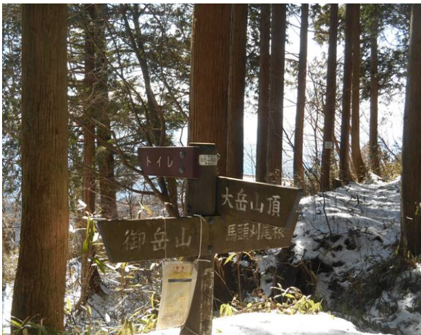
大岳山荘跡付近の広場 すぐ側の建物は 廃屋のようですが、その下側に新しい 大きな建物があつた