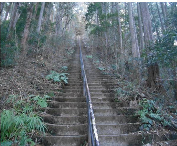
愛宕神社の石段今回は下りに使用 階段は182段ありました。