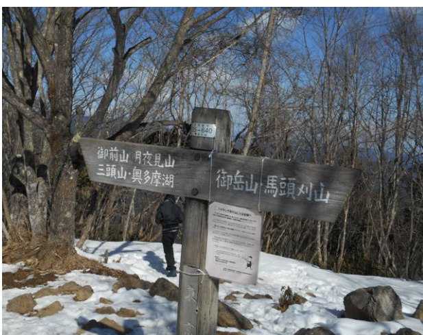
標識にこれから向かう鋸山の表示が無い 左側の方向で間違いはないのですが