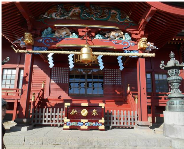
御岳山（神社）初めて来ました ここまで参道には雪はありませんここから 先は道に雪がありました。