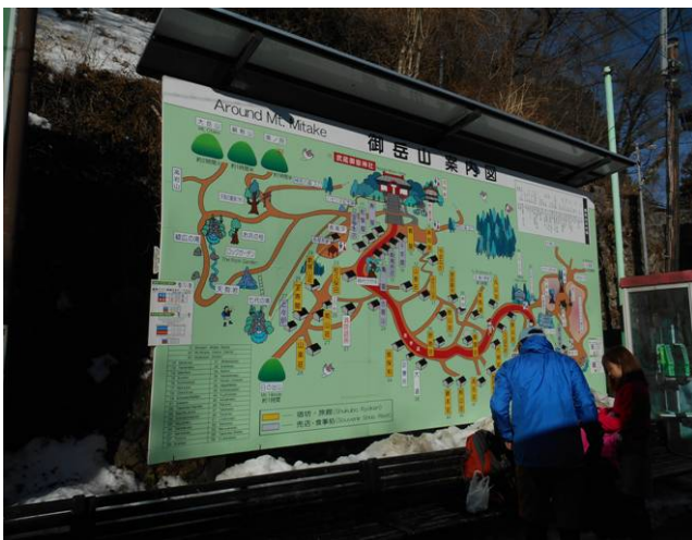
御岳登山駅に到着、道には雪はありません 出発準備を行う

最初は奥多摩駅からのスタートで計画しましたが、登りの距離を短くする為、御嶽駅からのスタートに当日の朝変更を行った、又立川よりの電車が御嶽止まり及び御岳登山鉄道の時間も朝早くから運転を行っている情報を得た為、御嶽駅を降りて、関本行きのバスが平日であれば、約10分後に会ったが、休日の為時刻表では約30分待ちであったが、臨時便があり約15分位の待ち時間で済んだ、バスは後から来た電車を待って出発した、満席で数人の人は立ち席でした、約10分位で関本バス停の到着、そこから急坂を登り、御岳登山鉄道駅に向かった、