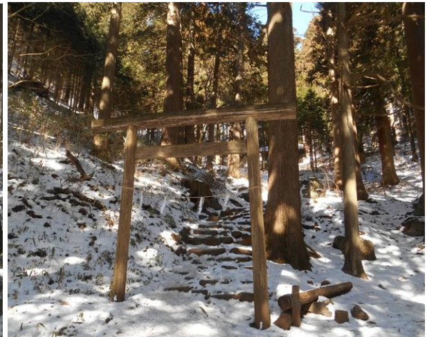
大岳山に向う手前に神社がある。