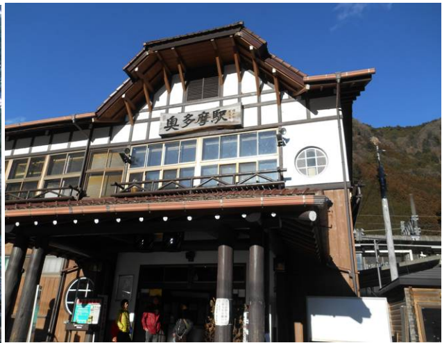
奥多摩駅到着天気は快晴です、2階の 喫茶店で生ビール 16:18 ホリデー快速で 帰った。