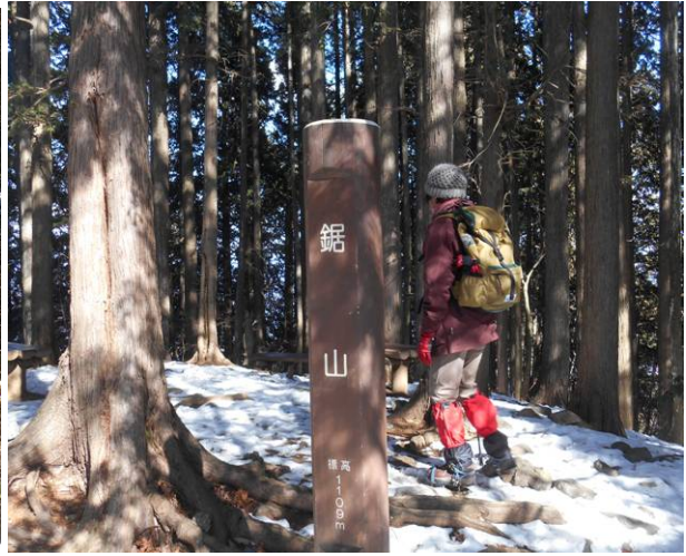
鋸山に到着 (大岳山より3名の登山者に会った)