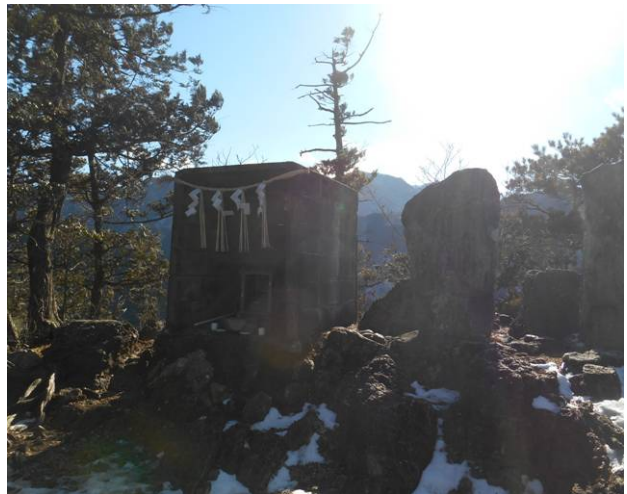
天聖神社石仏かな??