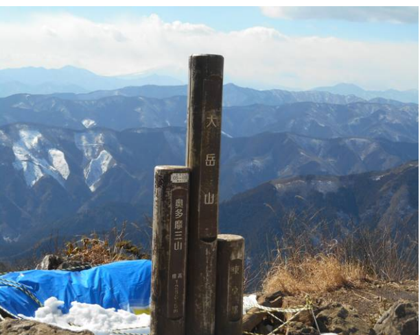
大岳山 山頂天氣が良く展望は良いですが 風はかなり強いので山頂での昼食はあきらめ すこし戻って脇道で昼食を取った