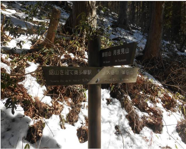
鋸山手前、御前山への分岐