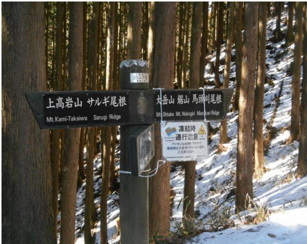
茶場峠 綾広の滝付近より雪が多くなった為 アイゼンを付けて来た