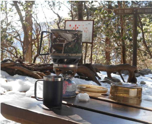
鋸山で今回初めて使用する JETBOIL で コーヒタイム