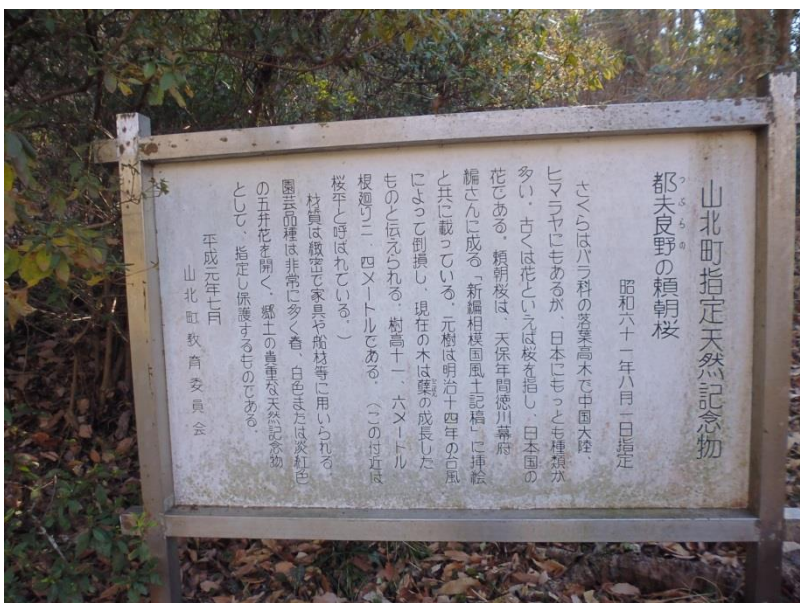
頼朝桜由来についての説明文

一般道を歩く事約20分、大野山登山入口到着。準備体操等で5分程休憩し登山道から登り始める。