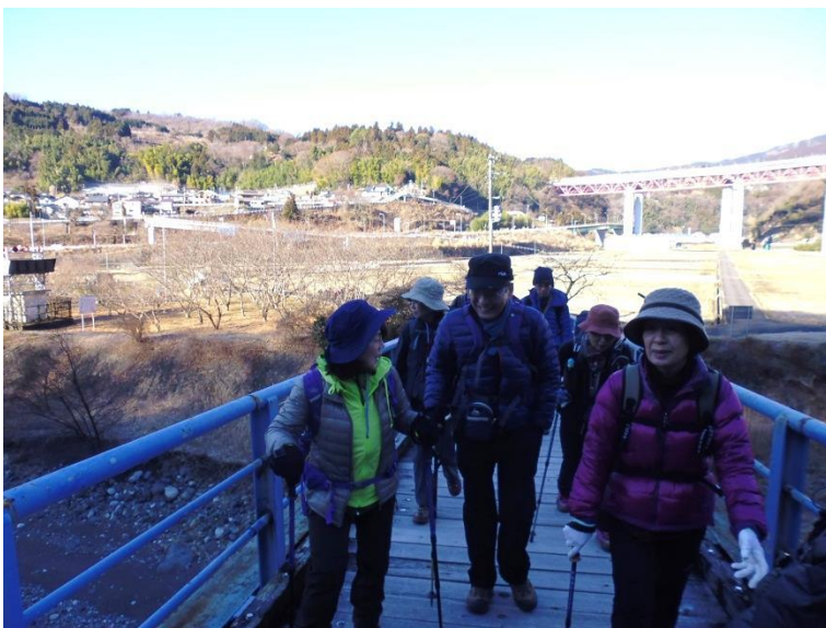
谷峨駅から登山口に向かう

報告 : 真冬の朝の気温は冷たく、家を出たのは7時前でしたが 顔がこわばる感じで 小田急經由谷峨駅へ向かう。御殿場線車内は登山客で混んでいたが山北駅で多くの人 が下車したがどの山へ登るのかな。