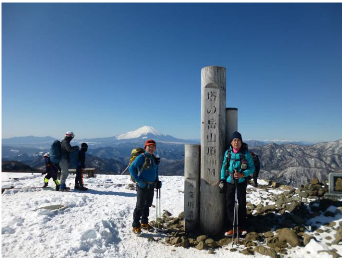
富士山をバックに記念撮 影