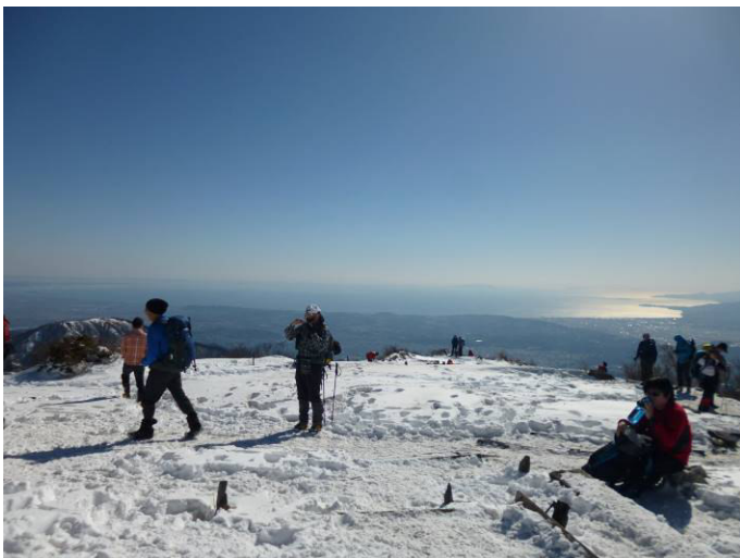
真鶴半島から伊豆大島ま で良く見える。