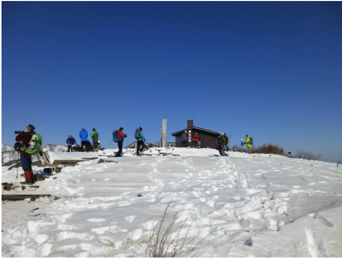
塔ノ岳山頂。 一面の雪景色。