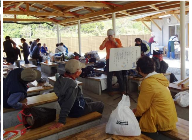
後片付けを終えると青空が・・・クヤシイ