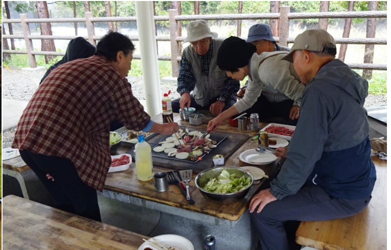
売店でアルコールを調達しました