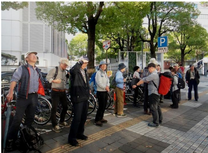
1 名は JR 足柄駅から橋を渡って現地集合（駅から 10 分）