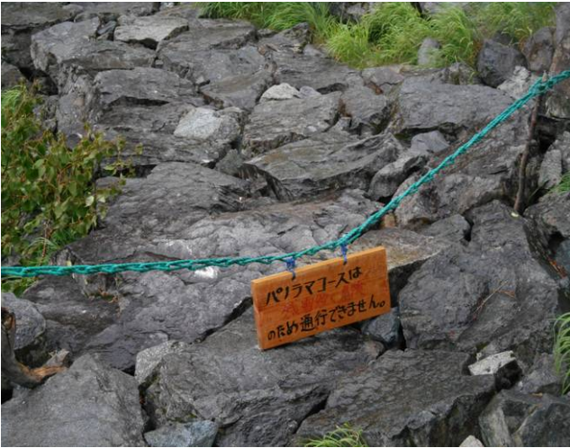
ここからのパノラマコースコースは通行禁止