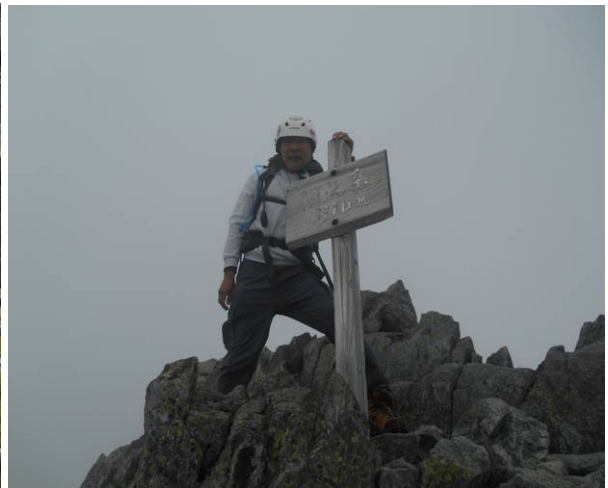
涸沢岳山頂 霧で展望は良くないです 天気が良くないので、雷鳥に会えた