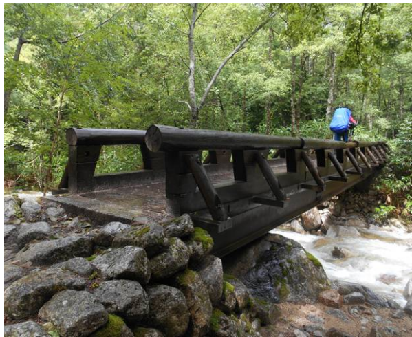
一ノ俣手前の橋 川の流が綺麗