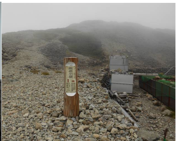
南岳小屋に到着 霧と強風で急いで 小屋に入る