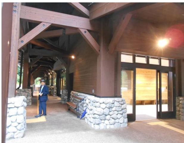
6時 沢度バスターミナル 登山者はいせん

穂高山荘 (5:30) - 取り付け点 (6:10) - 涸沢ヒュッテ (6:50) - 横尾山荘 (9:00) - 徳沢園 (9:50) - 明神館 (10:30) - 上高地 (11:15) - 沢度バスターミナル (12:50)