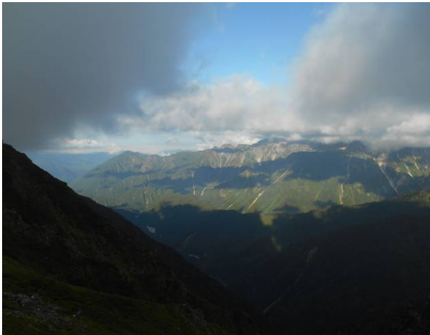
下界は晴れていますが尾根では曇りです