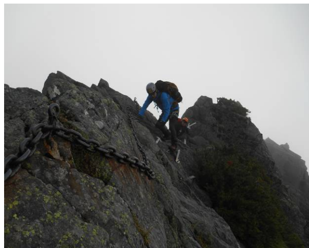
飛騨泣きの最上部付近の鎖場