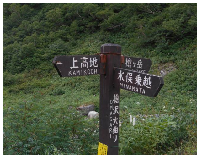
大曲分岐ここまでは緩やかな川沿いの登山道