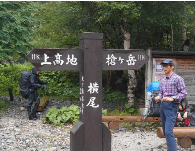
横尾の標識 上高地、槍ヶ岳の中間 ?? (11km)