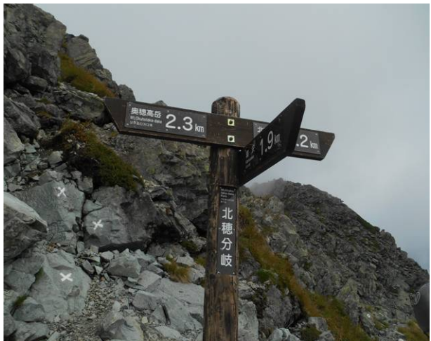
北穂分岐 ここから涸沢と奥穂に分かれる 今回は奥穂方面に