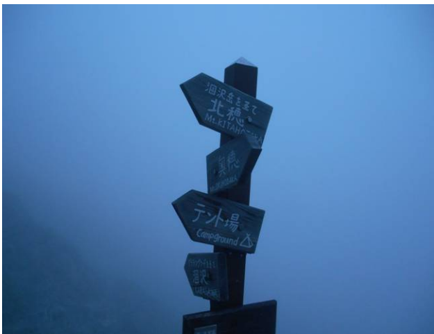
天候が心配なので早めに出発