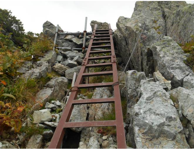
天狗原（尾根分岐）までは急な登りが続く