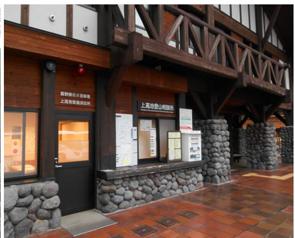
無事に上高地に到着