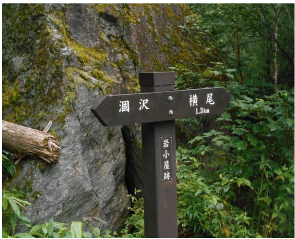
岩小屋跡 昔は小屋があったのかな？