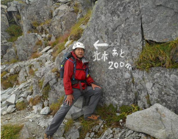
北穂までの標識が、ここからも急登で近くには感じない