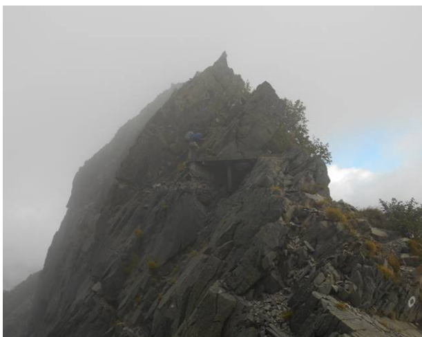
ここが飛騨泣き正面の尾根を登る