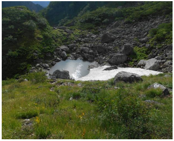
天狗原池 残雪が融け切れな池