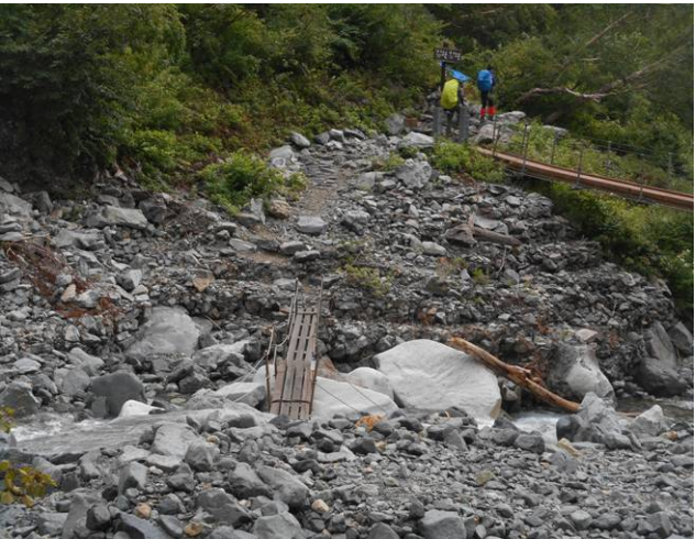
本谷橋に到着 水量が多い時には右上の橋を使用する (橋が新設されていた)