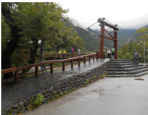
まだ時間が早いのので 河童橋ですが人は少ないです。