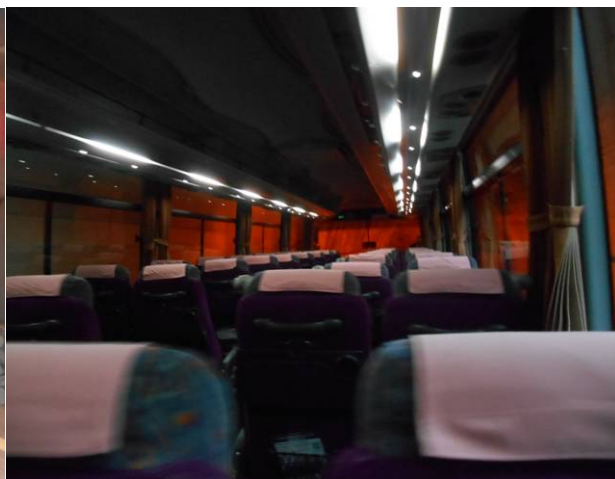
上高地行きバスの中 私以外誰もいません