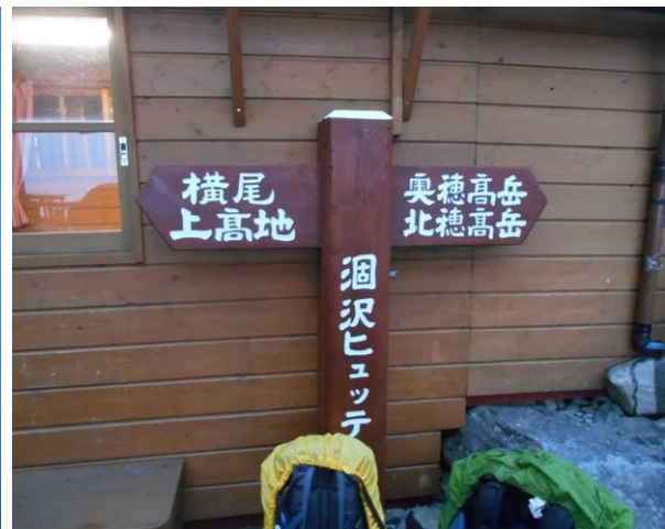
パノラマコースからヒュッテに到着