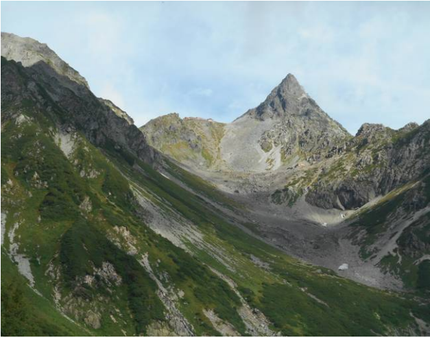
後ろに槍ヶ岳が見える