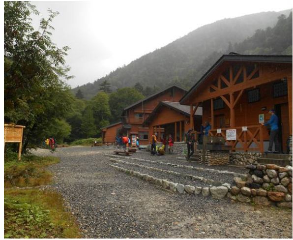
横尾山荘到着 雨が酷いので休憩しました