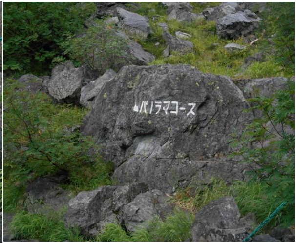
残念です 次回挑戦します。