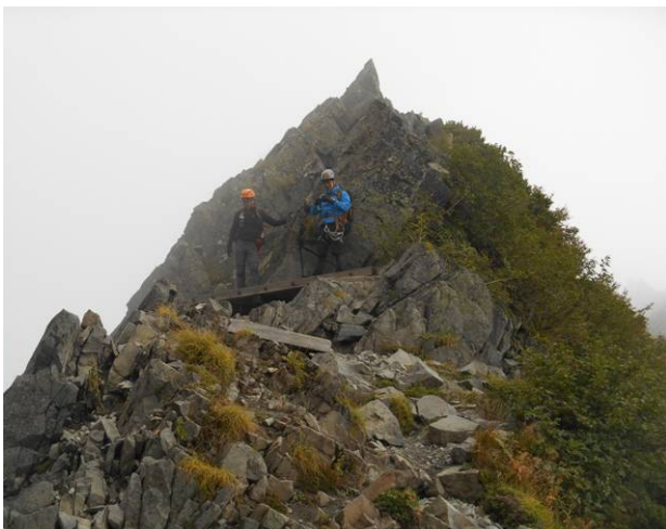
A沢のコルに展望デッキがある 混雑時はあまり使用できない