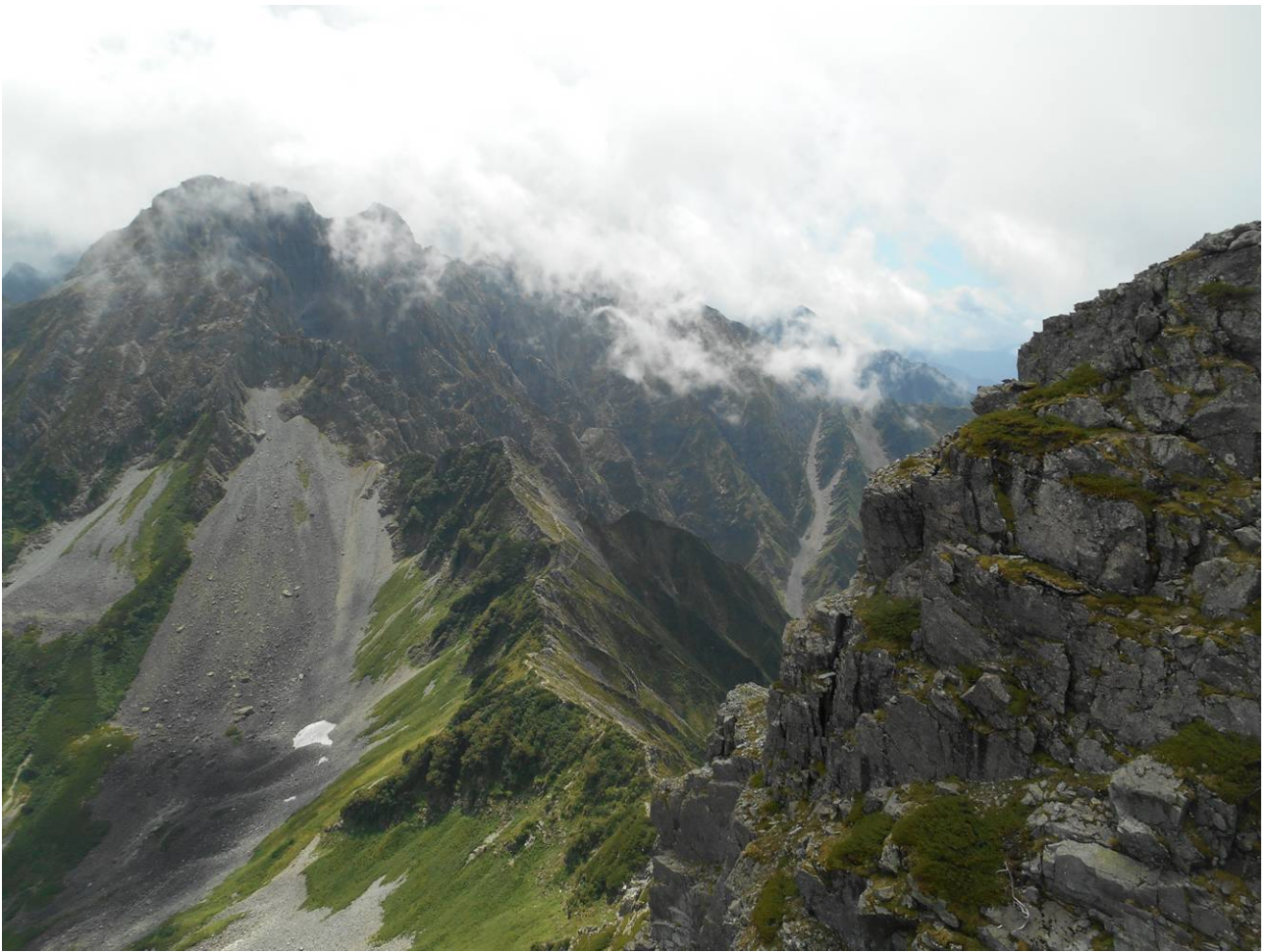
今日歩く 南岳小屋ー(大キレット)ー北穂のコース 南岳小屋近くの見晴らし台より