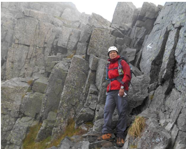
キレットの入り口 大きな岩の為足場に注意