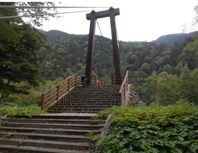
横尾山荘手前の吊り橋に到着