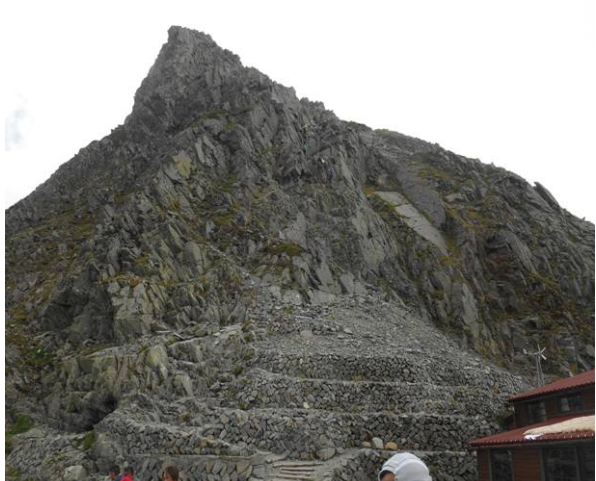
正面は奥穂への登山道 山荘より最初がかなりの急登です