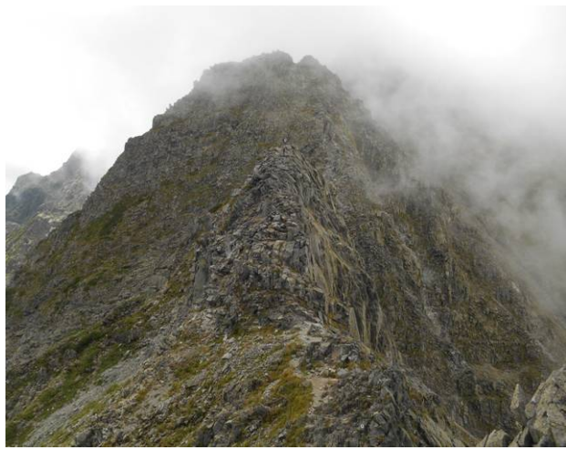
正面の尾根が登山道ですがこの上はまだ山頂では無い