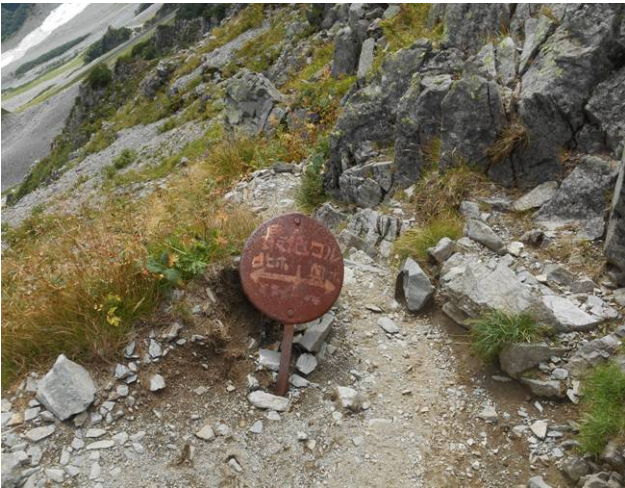
ようやく 涸沢のコルに到着 前回同様急な尾根の直登です 山頂がやっと確認できた