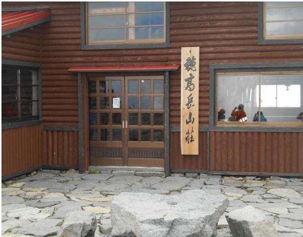
穂高山荘到着 今回の主な山行は無事にできた