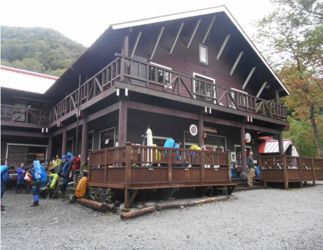
徳沢園 雨宿り中の登山者で一杯です