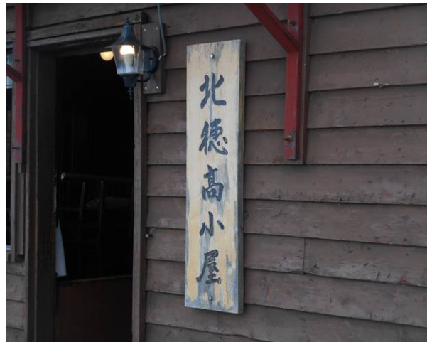
無事北穂高小屋に到着 大キレットの縦走は終了