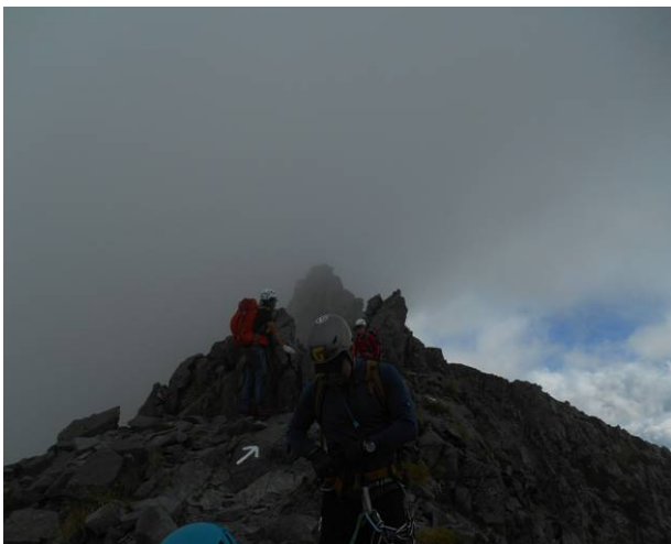
途中下山者とのすれ違い 皆ヘルメット及びハーネス装備