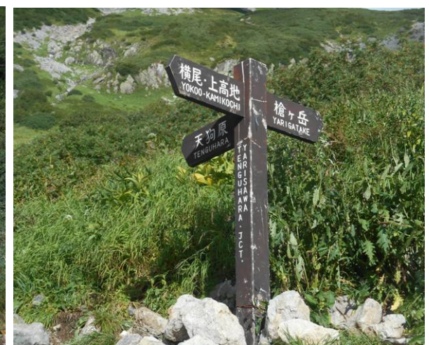
大曲分岐から 天狗原分岐までは標高差 300m かなりの急登です 天狗原方面に行く人は 私一人でした