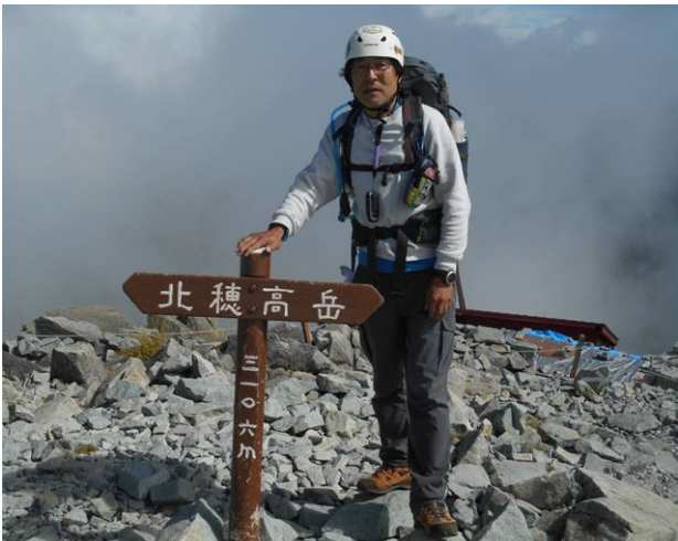
北穂高山頂は山荘より数分の場所になる