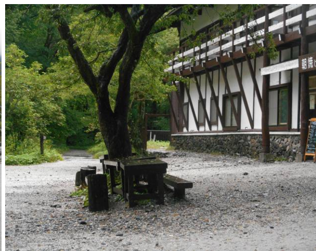
明神館に到着 まだ雨は降っていません