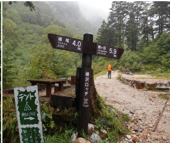
槍沢ロッジに到着 雨が本降りなので 今日はここまで 標識で横尾から 槍ヶ岳の距離が合いません 先は11km ここでは 約10km