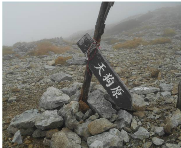
天狗原に到着 霧と風でかなり寒い 休憩なしで南岳へ向かう