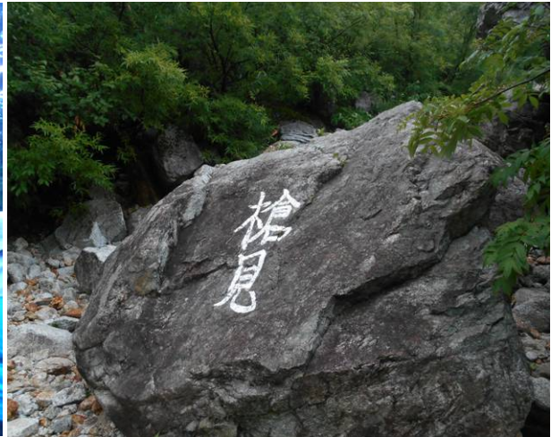
槍沢ロッジを出発 曇りですが雨は降っていません 槍見岩この上の山が槍に見える