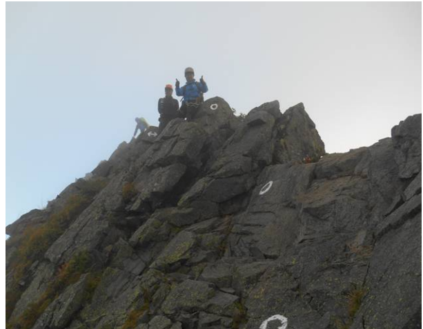
長谷川ピークこれから下りに