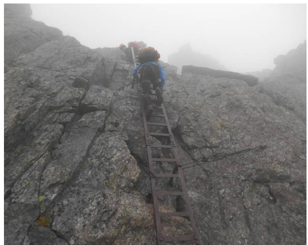
長い梯子 下山には得注意 滑落が多い場所