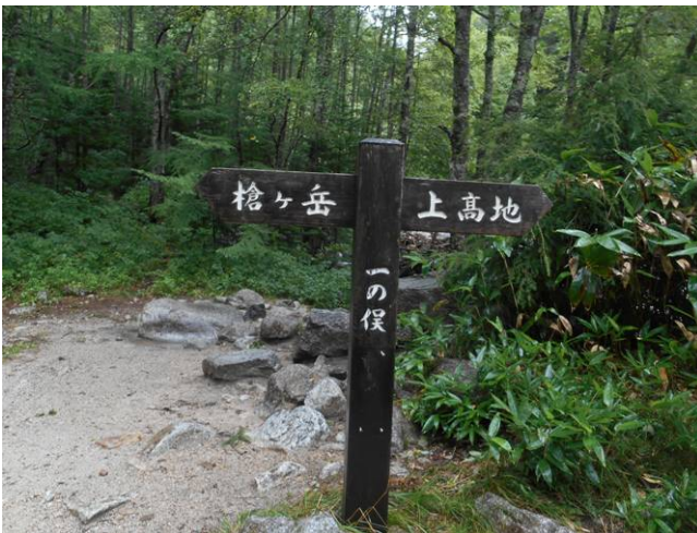
橋を過ぎると 一ノ俣の標識がある