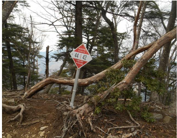
鷹ノ巣山への登山道分岐 ヒルメメシクイのタワ この標識が八丁山への入口です (標識に漢字で 午昼食のタワ 1256m)