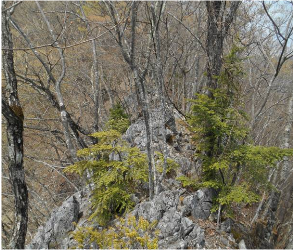
岩場の後の細尾根で岩場が続く