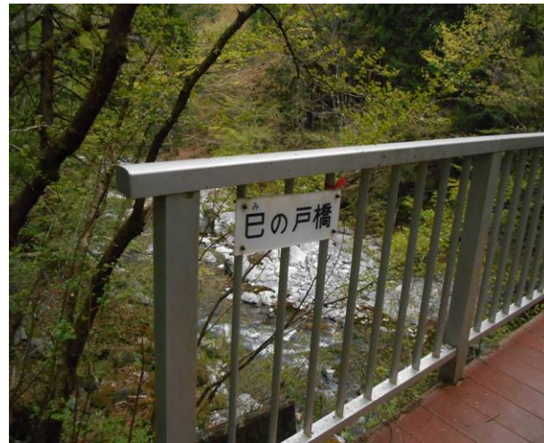
最後の巳の戸橋ここから中日原まではもう少し