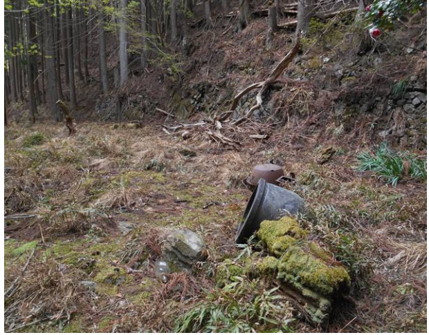
途中に人家の址がこの上にお墓もあった