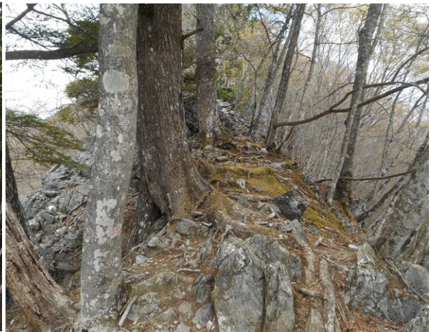
山頂長手前の岩場に到着