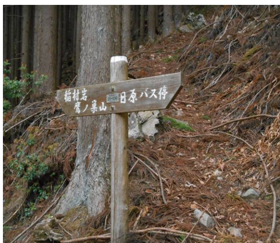
ここが八丁山への分岐で右側の道に行く