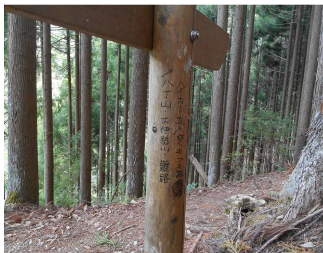
標識の柱の裏側に下記表示が (ハイカー立ち入り禁止フミ後薄い) (八丁山 お伊勢山 難路)