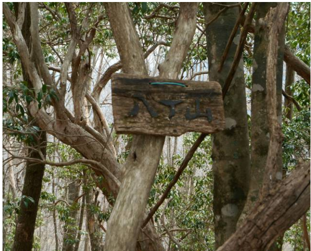
八丁山に到着 古い山名標識