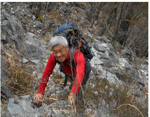
山頂手前の最後の登りです、手掛かりが多くあるので、ザイルは必要ではない