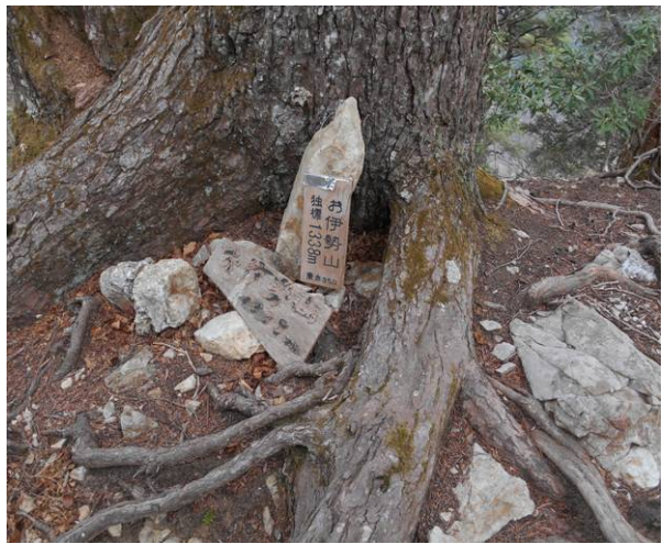
お伊勢山 独標 1338m 東京 350