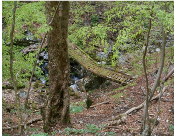
昔の橋現在は通行止めでコースが変更された