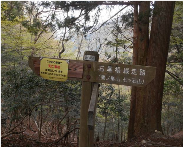
標識で稲村岩側には死亡事故の表示で木の部分には何も表示は無い