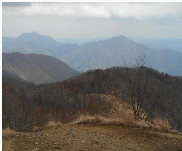
鷹ノ巣山 山頂 石尾根縦走路 次回は縦走路を歩きたい