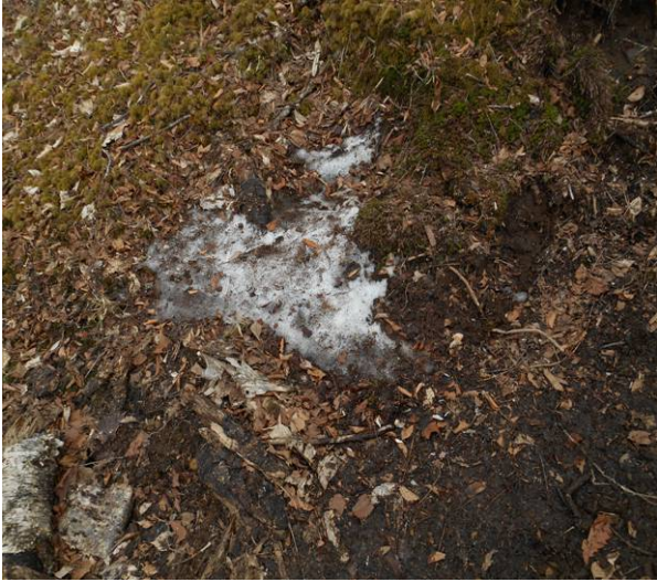
鷹ノ巣山の下山時の残雪があった