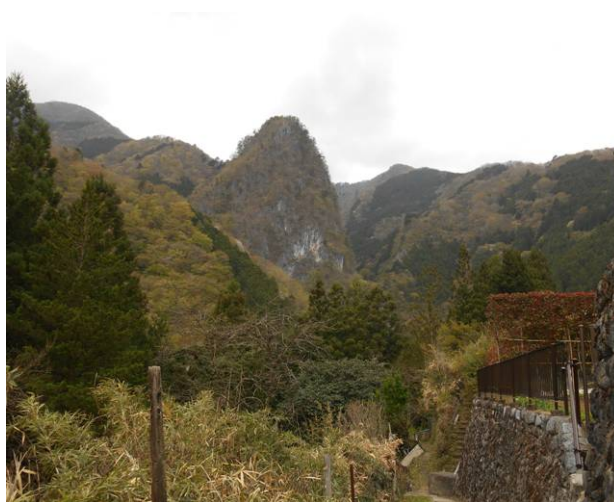
正面に稲村岩が見えます