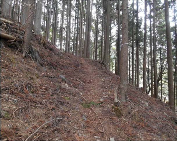
尾根まで急な九十九折の登山道に行く