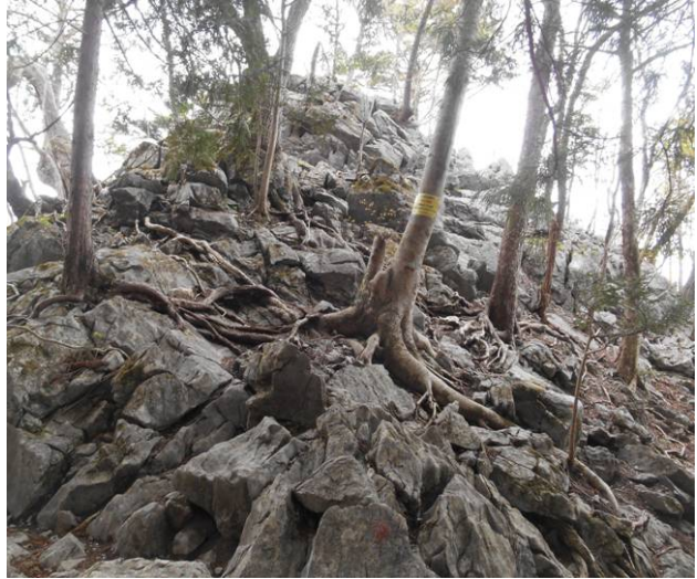
稲村岩この先は岩場となる上部に行き見る事は出来ませんが、戻りになる