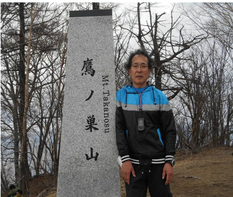
鷹ノ巣山山頂 荷物はヒルメメシクイ タワにデポして身軽に