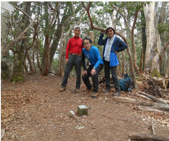
こちらに新しい山名標識があった (八丁山 独標 1280m )