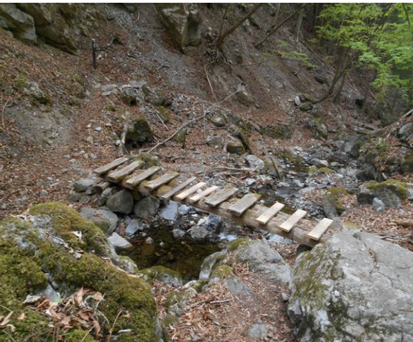
新しい橋ですがこちらも古いです