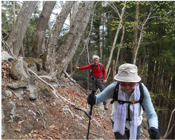
尾根に出ても狭い登山道が続く