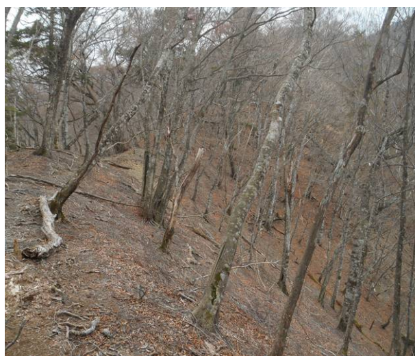
鷹ノ巣山への登山道への分岐の手前