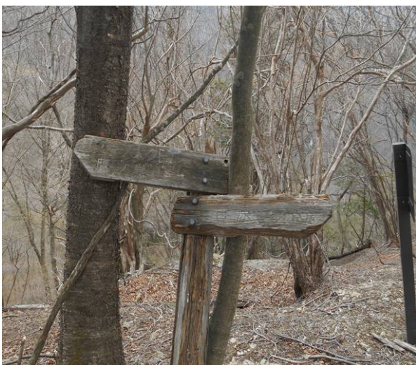
昔登山道であった標識があった