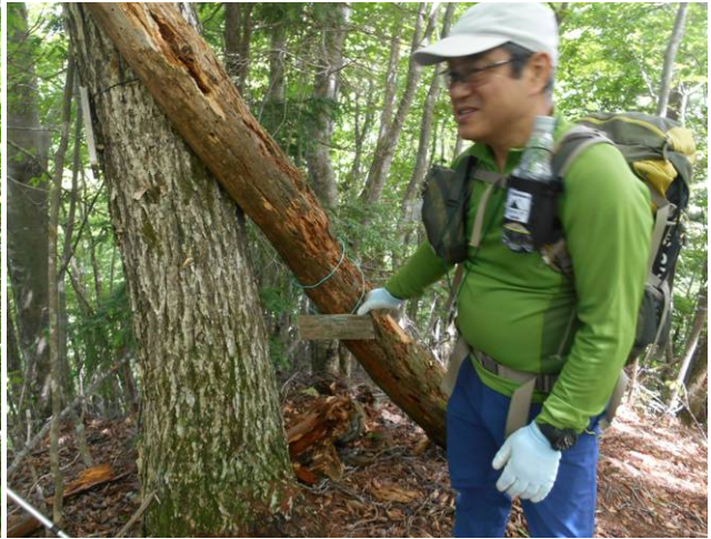
ハガケ山に到着山名標識も文字が消えて見にくい