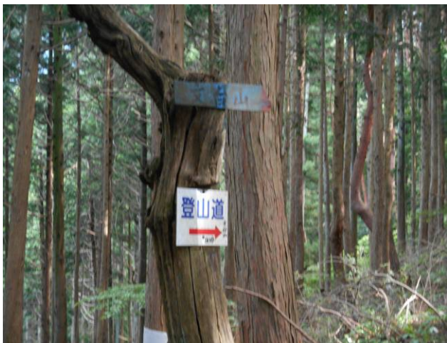
矢花山 分岐 バスが無いので沢田橋方面に