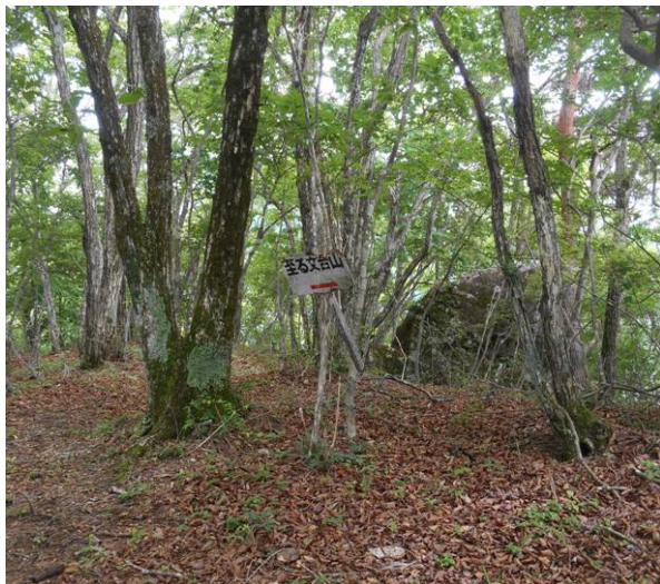
ここが文台山 山頂かと思ったら一つ手前の山頂でした、こちらの方が標高は高い