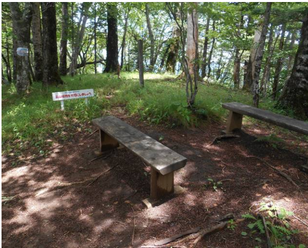
ベンチもあり天気も回復し、木漏れ日が