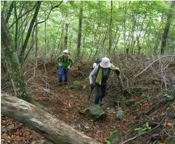
このコースはあまり使用されていない 御正体へのルートですが