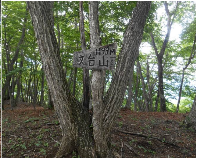
文台山 山頂に到着