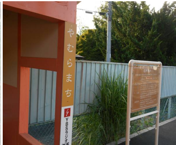
谷村町駅（やむらまち駅）到着