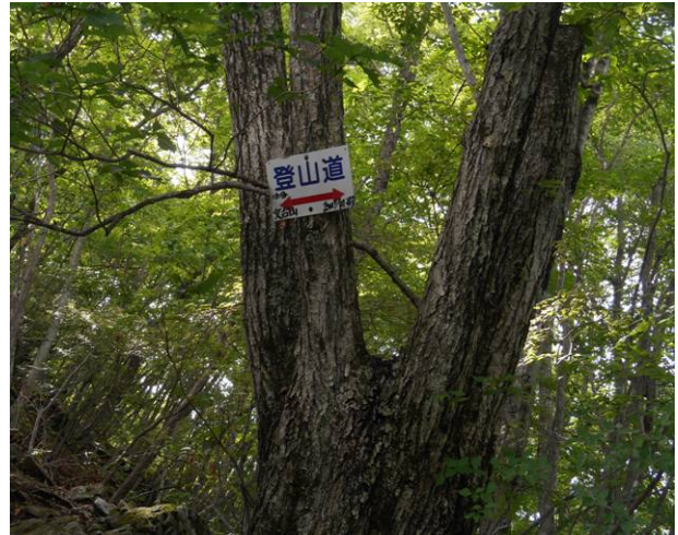
文台山 分岐に到着破線のルートもここで終了約3時間のルートでした