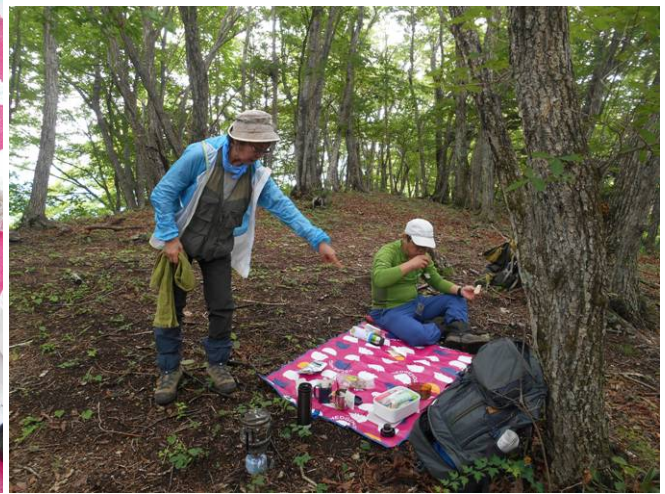
ここで恒例のコースタイム