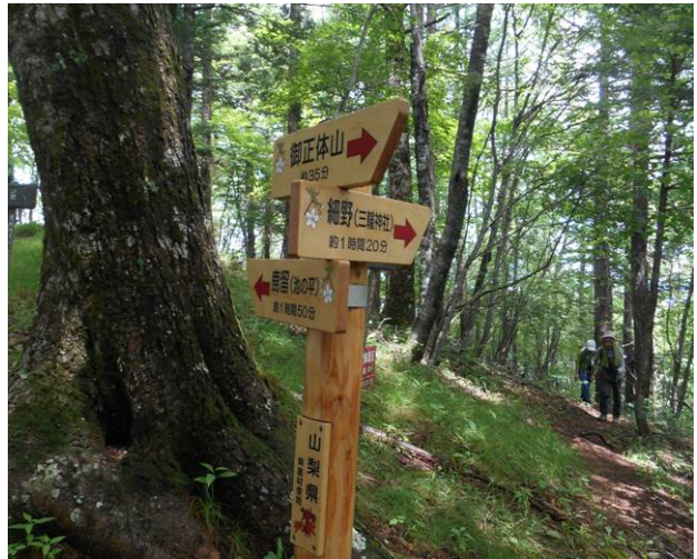
峰宮展望台に到着