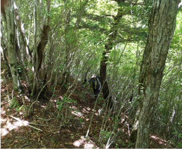
破線のルート 登山道 踏み後はあるが歩きにくい