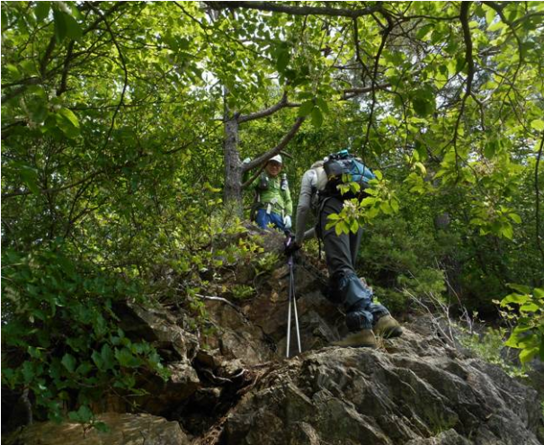
さすが破線のルート、岩領が数箇所あり慎重に通過する