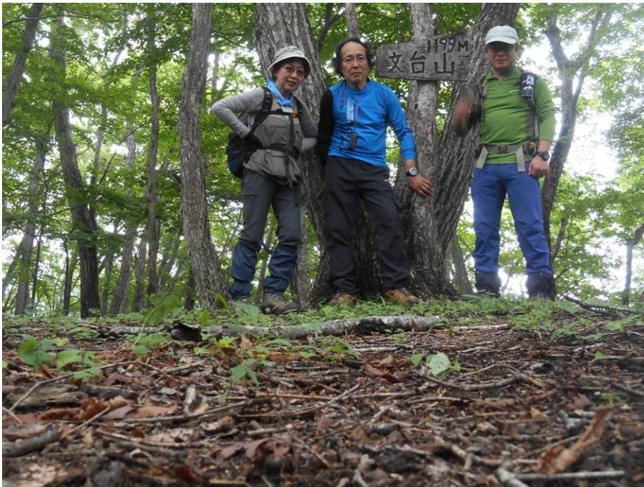
山頂での記念写真