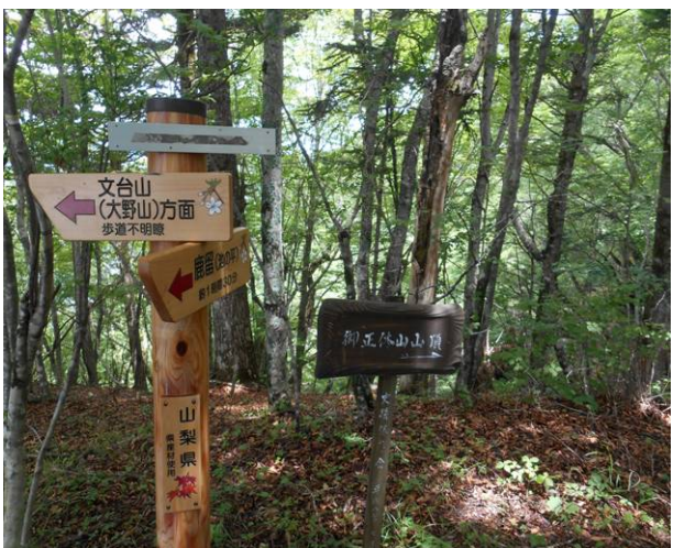
池の平分岐文台山方面 歩道不明瞭の 表示 破線のルートなのに立派な標識