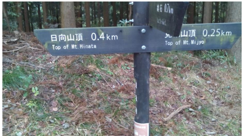
歩く人は少ないが道標はしっかりしている 今回は日向山に登った後はこの道標を戻って、見城山を目指す