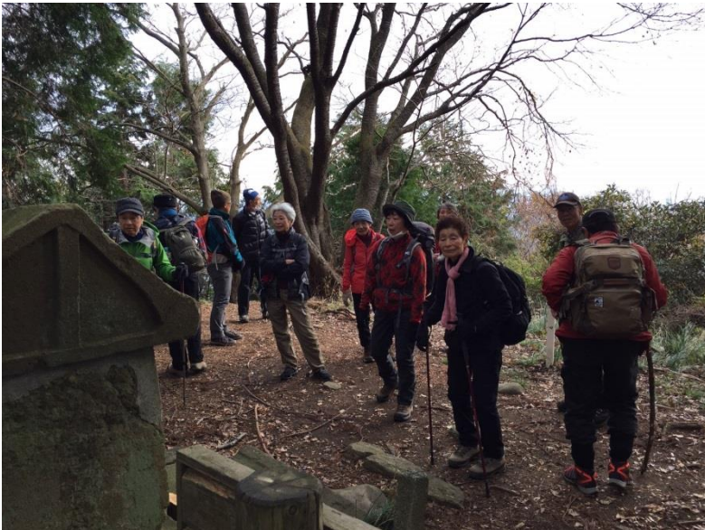
誰も居ない日向山山頂で暫し眺望を楽しむ