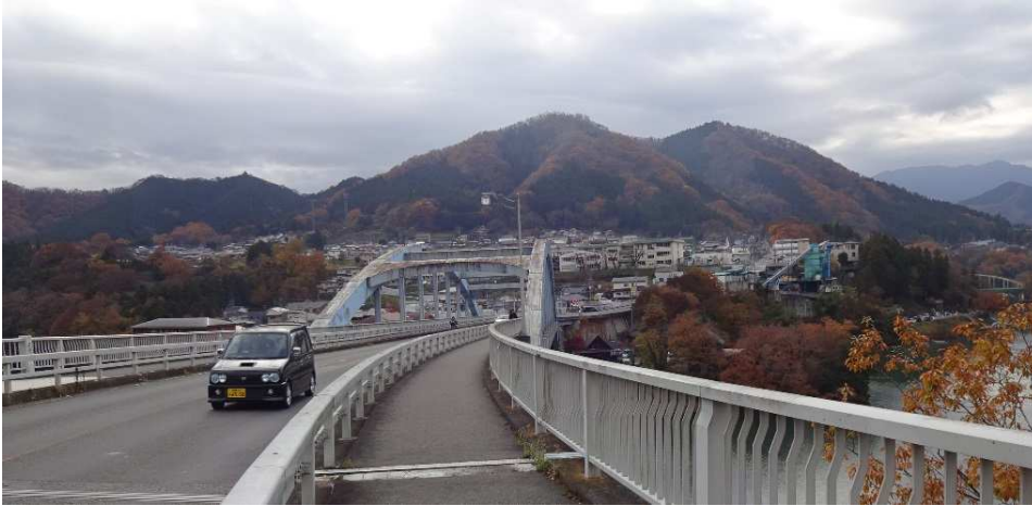
日連アルプスの全景が見えている

山行日：2018.11.2 参加メンバー：7名 天候：晴れ 記：t h コース：藤野駅/9:10-日連神社/9:50-取付き/10:20-宝山/10:42-日連山/11:00-杉峠 /11:20-鉢岡山/11:50-峰山/13:00-八坂山/13:02-金剛山 /13:16-参道入り口/13:50-藤野駅/14:15