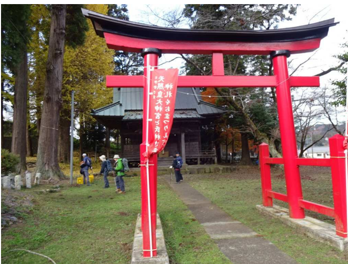
日連神社に立ち寄り