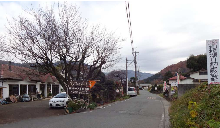
新鮮な朝採れ野菜