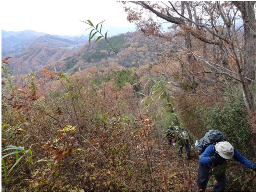
鉢岡山へはショートカットルートで 高度を上げる毎にロケーションも変わる