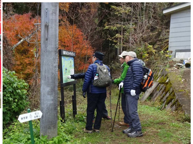
今は立派な案内板も出来ていた