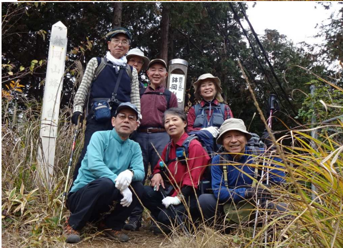
3座目の鉢岡山山頂は下草刈りがされていない アルプスの縦走路も台無し