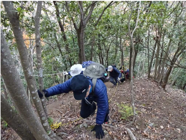
取付いて僅か 20 分で紅葉の尾根歩き開始