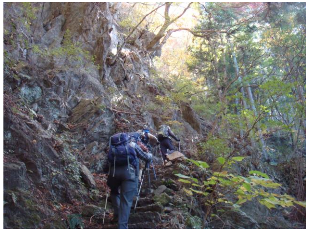
丸木と石の階段が続く・・・