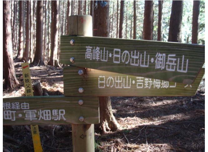
築瀬尾根への分岐