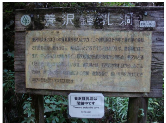
2000年に閉鎖されたようです