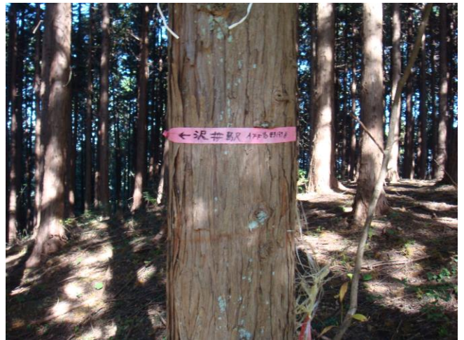
唯一の標識？後はピンクテープに従って下山