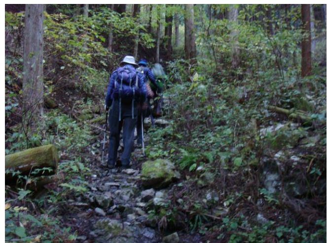
しばらく岩ゴロの道と階段が続く