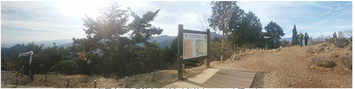
何回来ても見晴らしが良く気持ちのいい山頂です