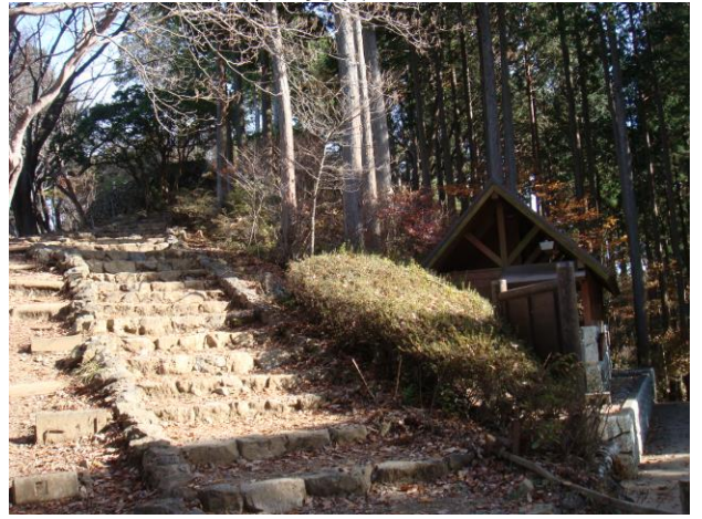
階段を登ると日の出山山頂