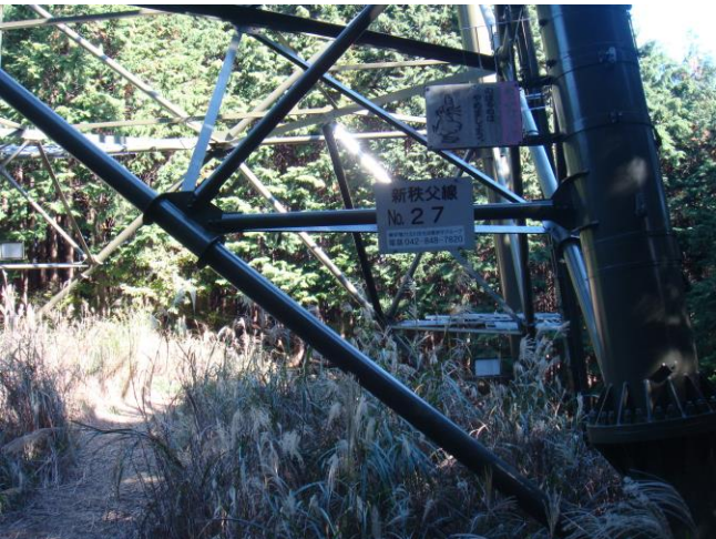
27号鉄塔・・・ここからバリルート