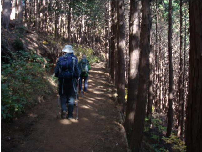
山頂を後に築瀬尾根に向う