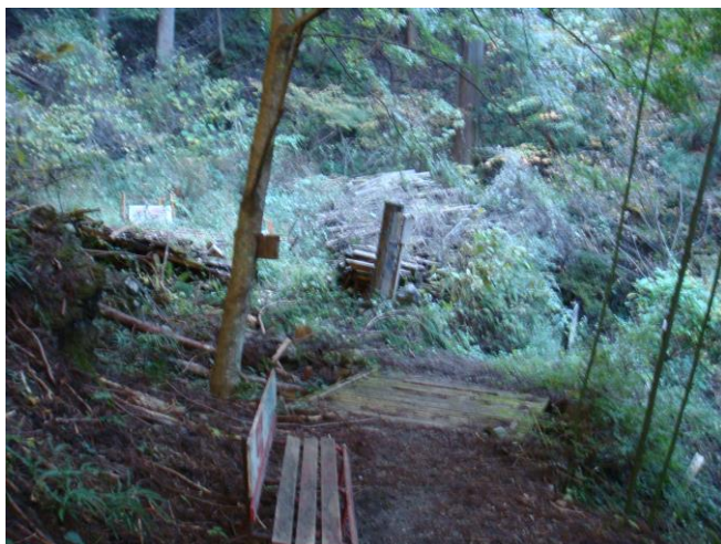
養沢鍾乳洞跡に到着