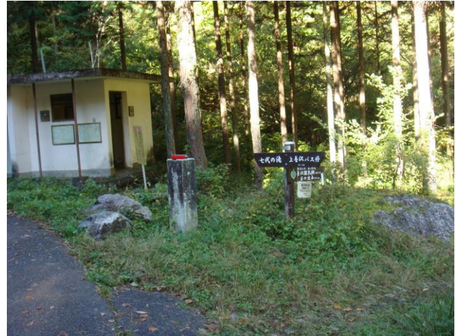
バス停から車道を20分ほど歩く