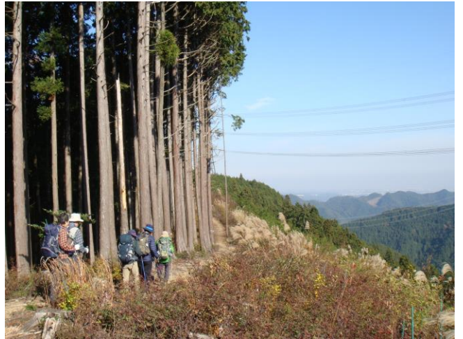
見晴らしの良い築瀬尾根