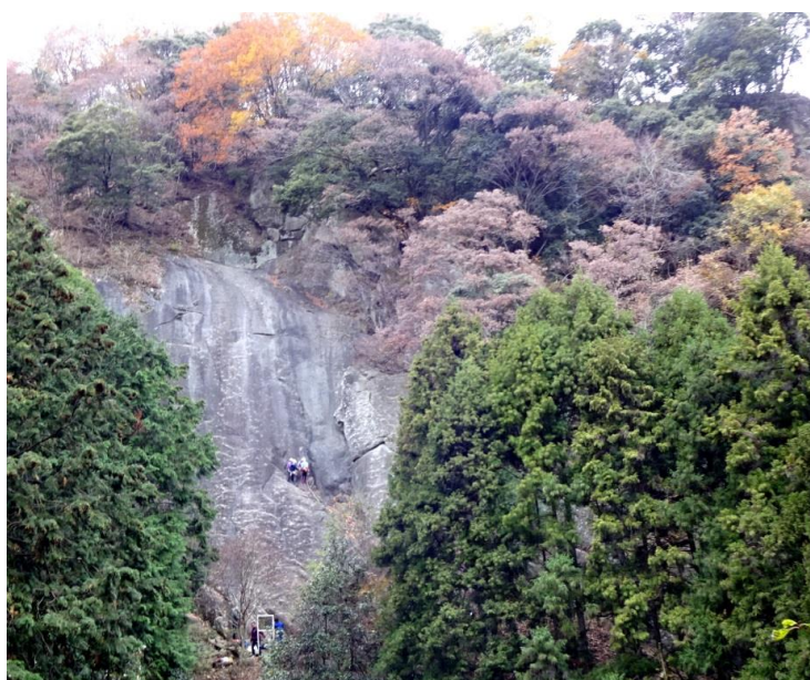
ここでトレーニングをしてやがて谷川岳、穂高へ・・・