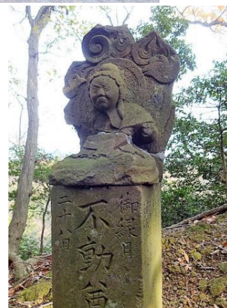
七沢森林公園が向かいに見える