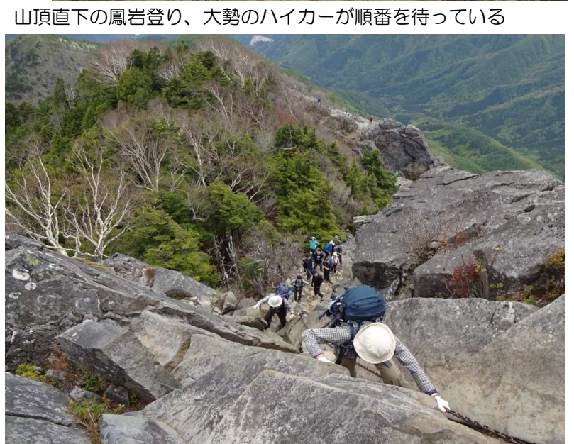
山頂直下の鳳岩登り、大勢のハイカーが順番を待っている