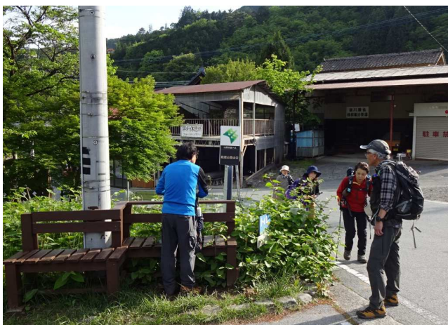
閑散とした山梨市駅