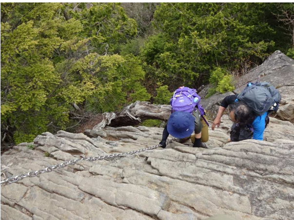
既にアップアップの人には迂回路があり