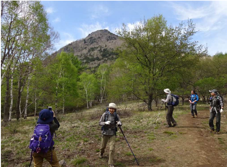
国師原(高原ヒュッテ)下で、振り返ると乾徳山