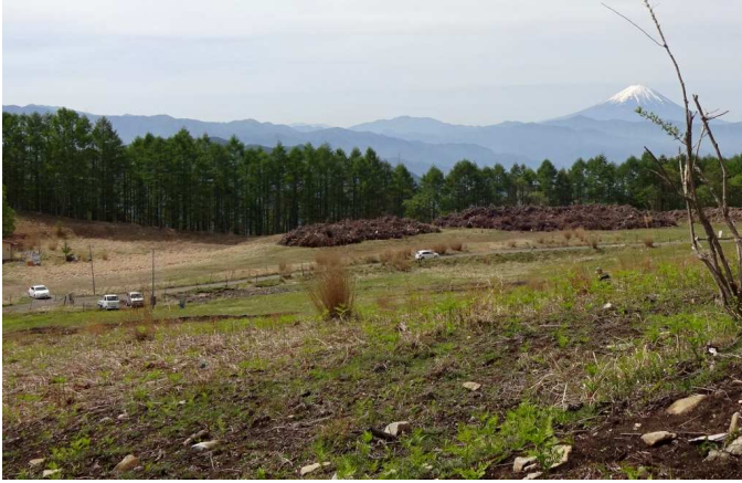
扇平へは緩いが永い登りの我慢比べがつづく そして最初は小手慣らしのクサリ場を

山行日：2018.5.12 会山行 7名参加 天候：晴れ 記：t h コース：高尾駅/7:06ー塩山駅/8:25ー大平高原/9:00ー扇平/10:30ー乾徳山/11:55～ 12:25ー水ノタル/13:00ー国師原/14:30ー林道登山口/15:45ー乾徳山登山口バス停 /16:20/16:52ー山梨市駅/17:30/17:44ー八王子駅/19:16