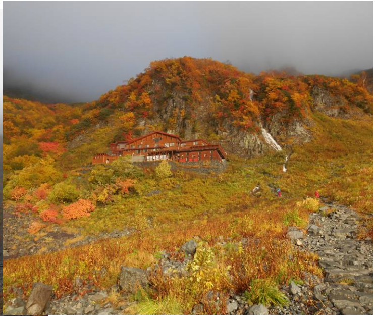
昨日宿泊した酒沢小屋