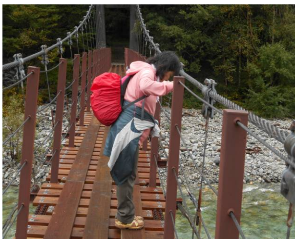
新村橋 雨は上がって川の流りが綺麗