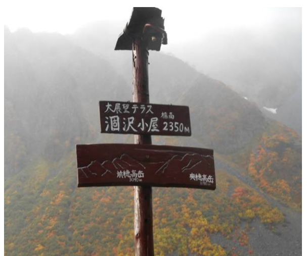
2日目 小屋の前で 小雨