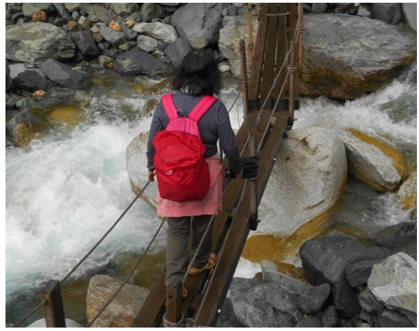
本谷橋雨の影響で水量は多い