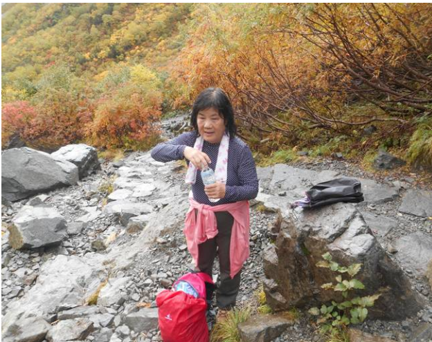
途中雨が上がったので川の水で汗を拭いた