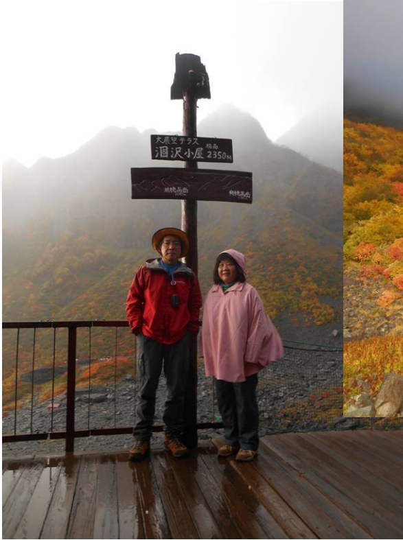
出発前に記念写真