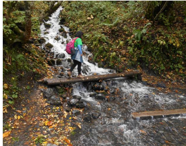
山からの水が多く橋を通過