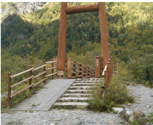
今回初めて明神橋に綺麗な橋です