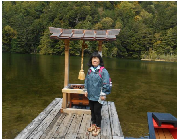
明神池 神社の管理の為池を見る為に 拝観料 300 円を支払い