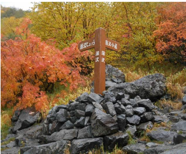
涸沢小屋への分岐点 小屋までは約300m