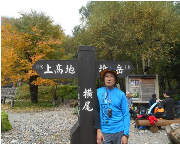
横尾に到着、天候が回復の為多数の登山者で賑わっていた