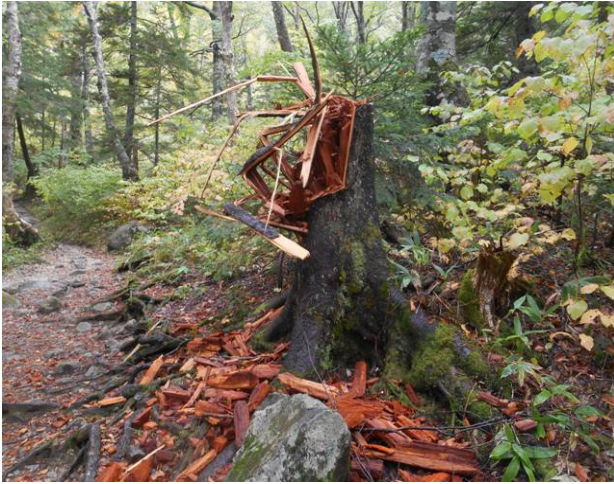
途中木の倒木跡 変わった折れ方