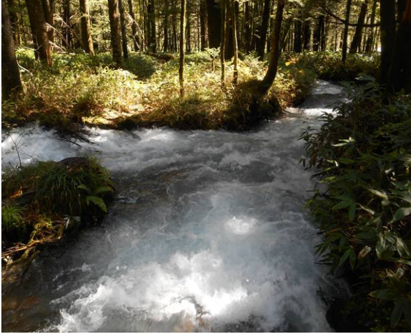
明神池より河童橋までのハイキングコース 途中の川の数量が増している