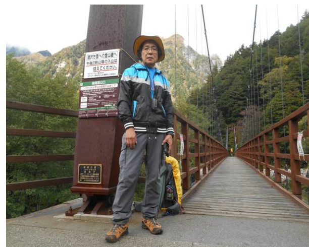
横尾から涸沢への分岐 この橋の手前で 長野県警山岳救助隊の人が数人いた