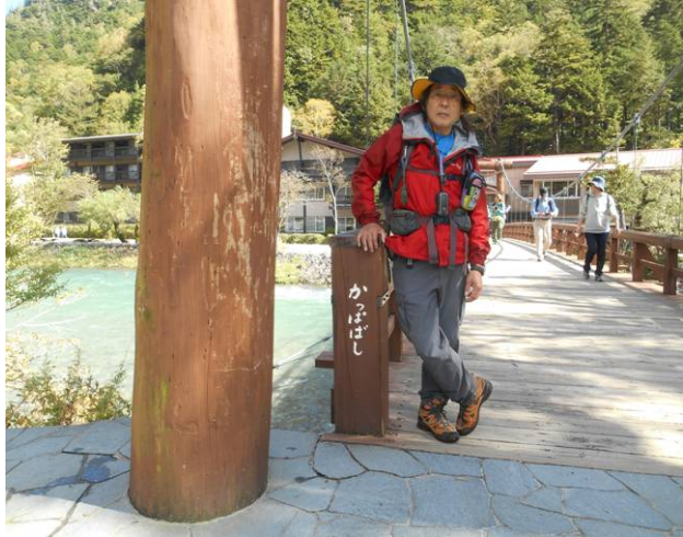
河童橋に到着 無事に今回の山行が終了