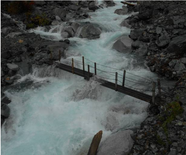
数量が多く下の橋の上に川が流れている