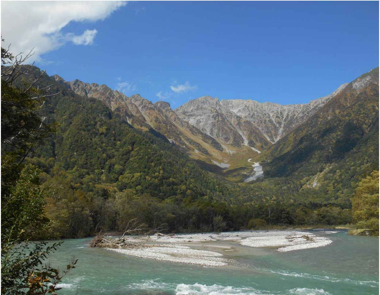
河童橋手前のアルプスの景色 西穂から奥穂までのルートが見える 来年度のコースに チャレンジする予定