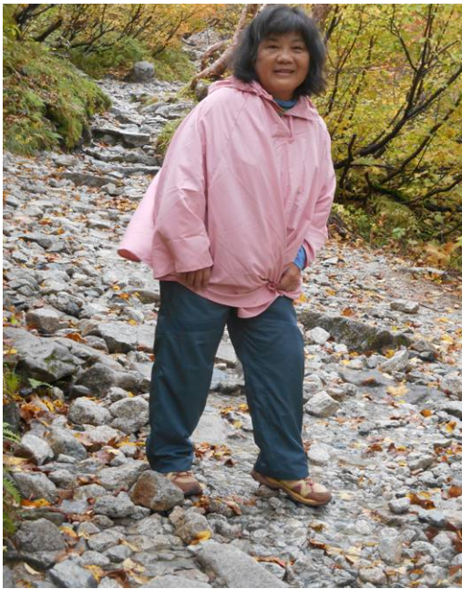
登山道が昨夜の台風で川に