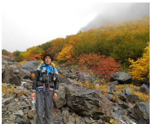
紅葉をバックに記念写真