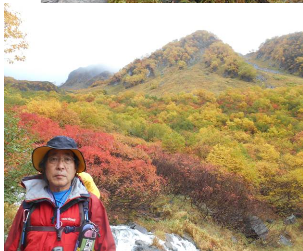
天候が回復したので、ゆっくりと紅葉を堪能