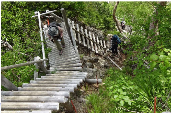
八本歯 の コ ル に 出 た