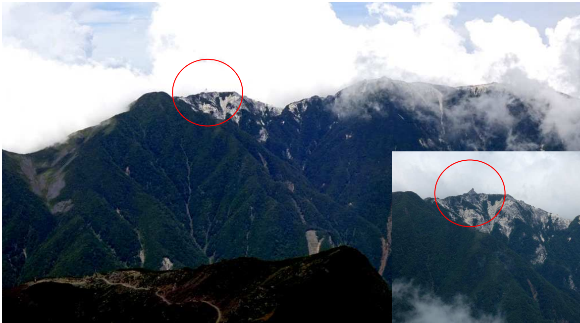
地藏岳の オベリスクが やっと見えた