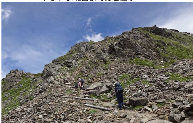
いよいよ北岳まであと僅か