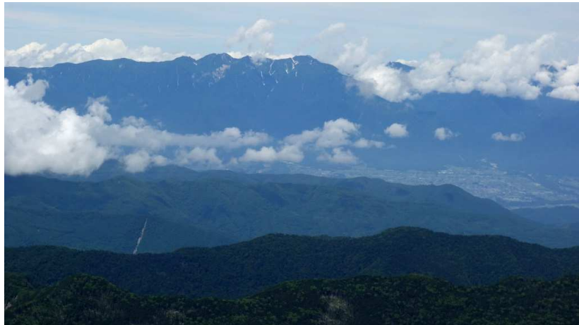
中央アルプス空木岳、宝剣岳、木曽駒ヶ岳を望む