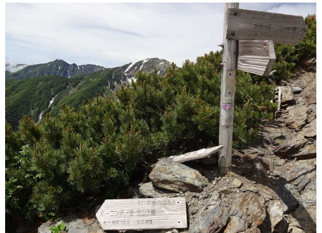
この時、甲斐駒ヶ岳山頂が見えていたがこののちガスで隠れて全く見えず