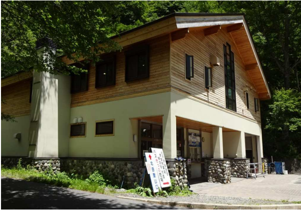
きれいな 野呂川広河原 インフォ メーション センター

コース：2日 甲府/9:05—広河原/11:00—白根御池小屋/14:30 3日 5:40—八本歯コル /9:40—北岳/11:45—北岳肩ノ小屋/13:00—白根御池小屋/15:35 4日 5:50— 広河原バス停/8:15/10:00—甲府/12:00