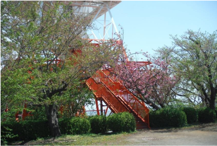
テレビ神奈川の電波塔が建つ湘南平 江の島・丹沢方面・富士山が春霞の中に浮か んで見えた