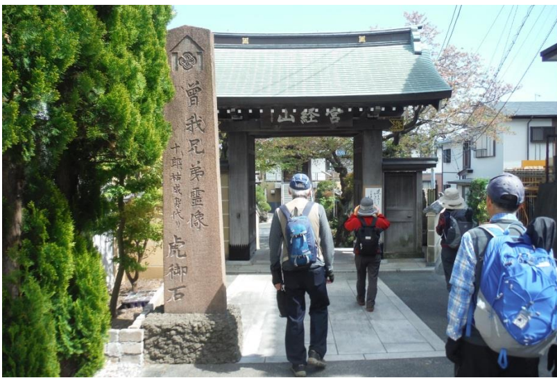
曾我兄弟・虎御前が供養されている延台寺。門前の張り紙で灌仏会の日で有る事に気が付く。用意されていた甘茶を頂いた。