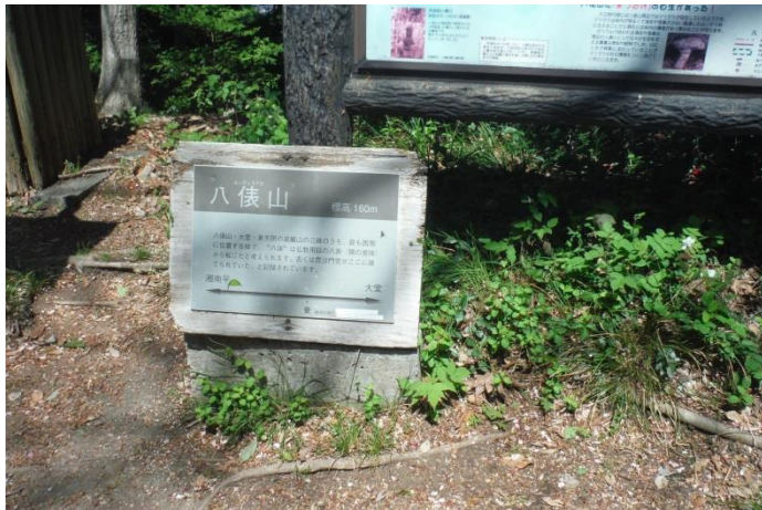
高来神社へ向かって最後の山道