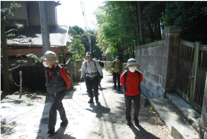
通行止め立て看板のすぐ先で、右手に湘南の海が広がり江の島も見えた

大磯駅の高架橋を山側へ渡り住宅地の中の坂道を進む。坂路を進むと通行止めの立て看板が有るが、通行止めの方へ進む。下見で車両通行止めと確認している