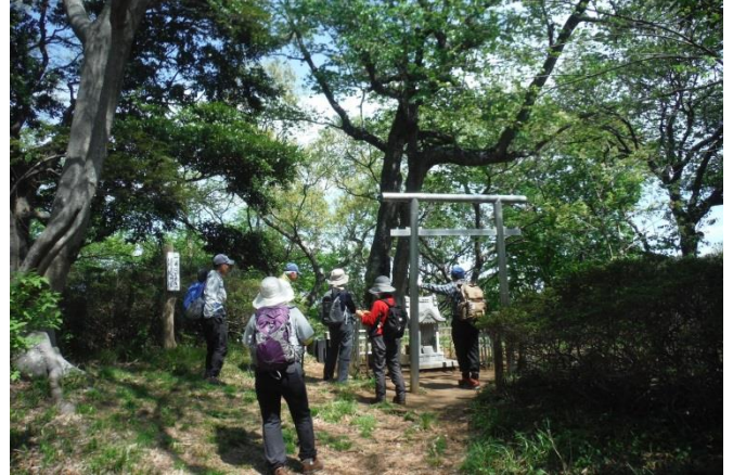
高麗山山頂は広いが樹木に囲まれて眺望は無い