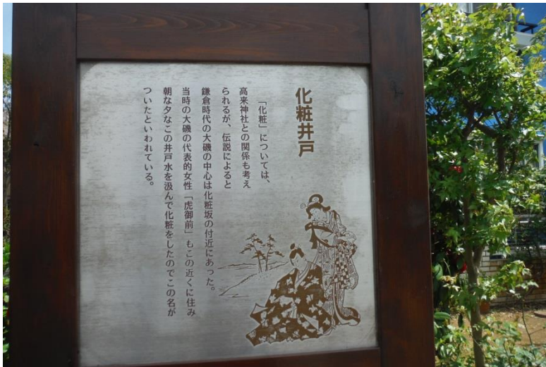
化粧坂の信号で右手の細道に入り化粧井戸 旧東海道の松並木や大磯宿の説明を見ながら1号線に戻る。