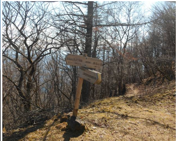
旧御坂峠 御坂茶屋の建物があつたがかなり傷んでいる ここで昼食タイム 正面に道が三つ峠入り口へのルートですが 標識は無い