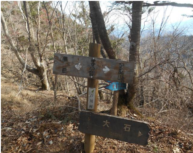
すずらん峠到着 黒岳からの下りで 雪解けもあり滑りやすい道の為注意が必要