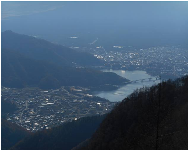
河口湖の景色真ん中が河口湖大橋