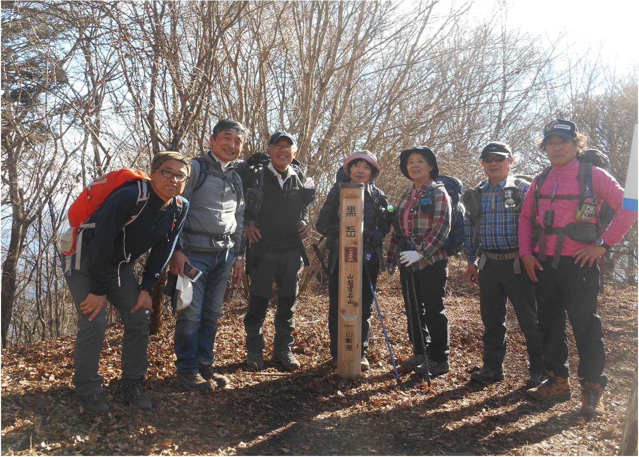
黒岳山頂記念写真 ここから後は下りのコース