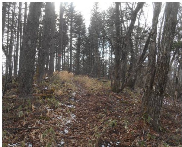
この先が GPS では破風山になるのですが 標識はなかった