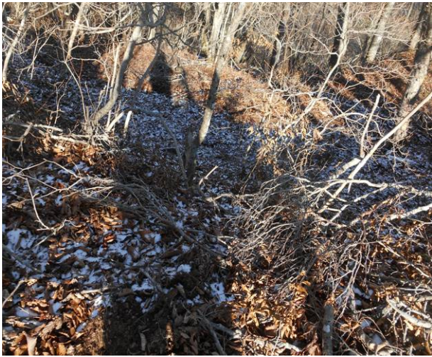
北斜面に雪があった、