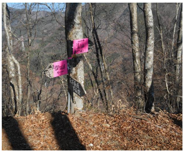
御坂峠 標識が古い為赤のテープで補修 左が御坂山、右が清八山經由三つ峠山へ