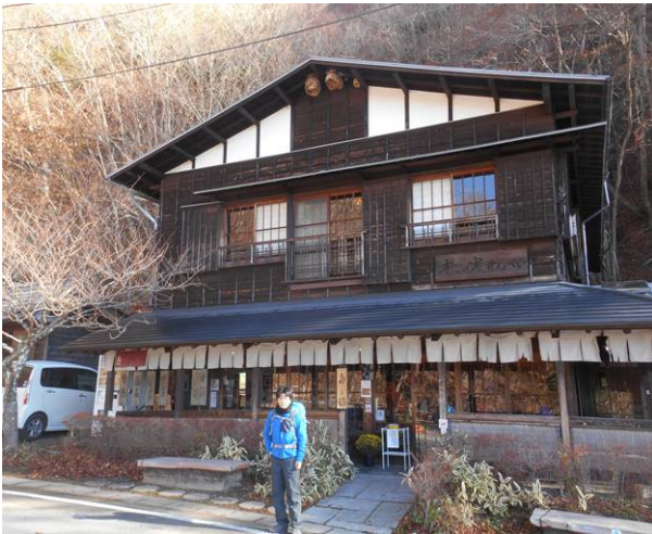
天下茶屋 営業中 ここからの展望は素晴らしい

昨年計画していて、雨の為中止したコースを、再度計画した、河口駅のバス停は1つのバス停が複数の行き先となっている為に慣れないと、バス停を探すのに苦労する、今回のバス停は5番の乗り場で行き先が、甲府、すずらんの里、天下茶屋が同じバス停です。バス乗り場には、コース事に並ばないので、長蛇の列が出来る、今日は人が多くいたので、臨時便が1台でて、私は臨時便に乗れた、バスは途中のバス停からの乗車を考えて、全席が埋まった状態での出発した、途中の三つ峠登山口で多数の人はおり、終点の天下茶屋までの人は、かなり少ない、その中には登山でなく、写真撮影の人も数人いた。