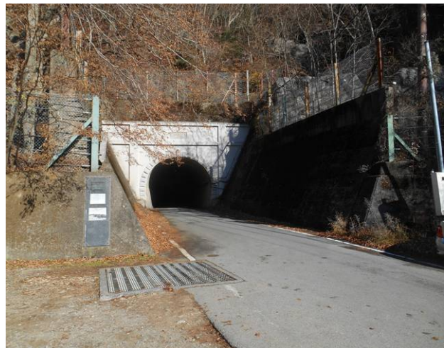
旧御坂トンネル トンネル内でのすれ違いはできない