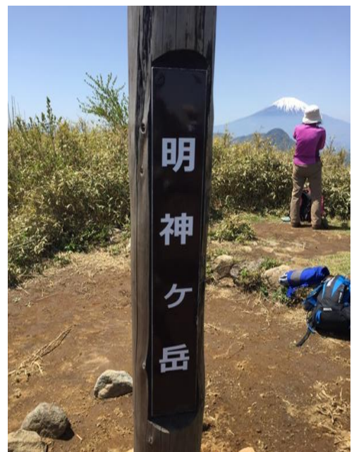
この背後には高校生 40 人の団体での登山グループがおり賑やかなこと