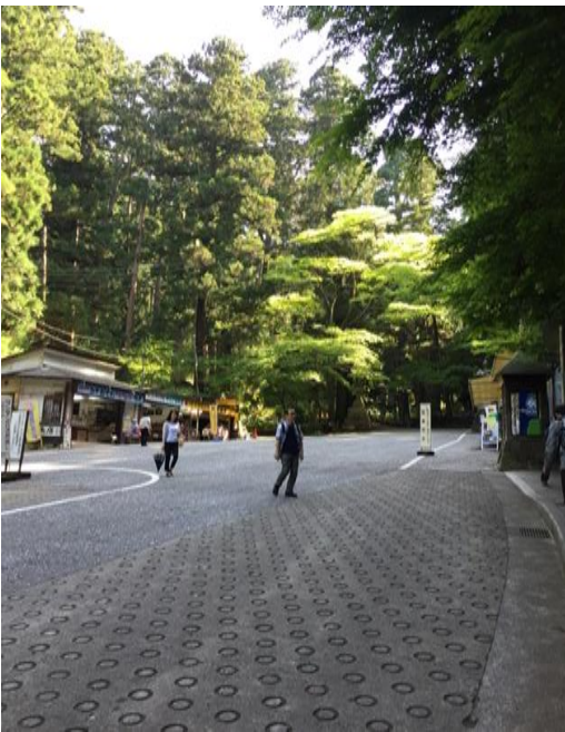
最乗寺のバス停（道了尊）から山門方面を見る お疲れ様でした。