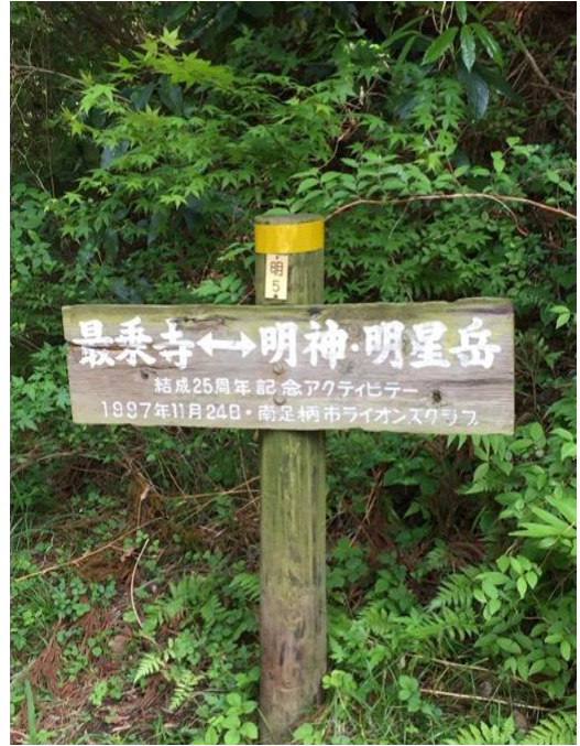
まもなく長丁場も終盤