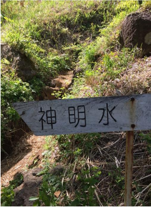
湧き水、それなりの透明度かな