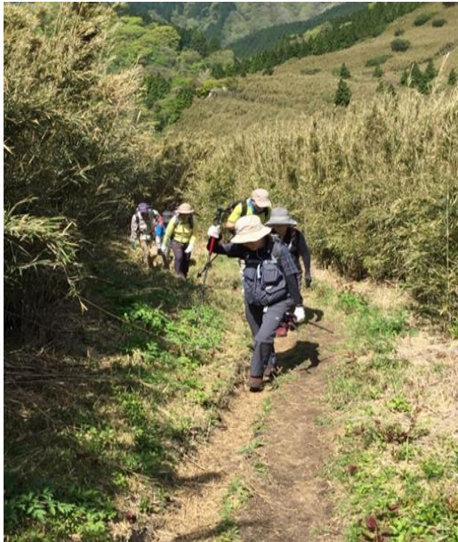
木陰もなく日焼け必定