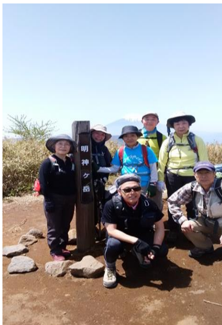
山頂にて記念写真を撮りました