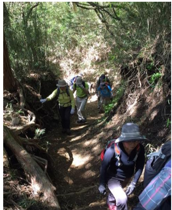
V字谷ぽいダラダラ坂の登り