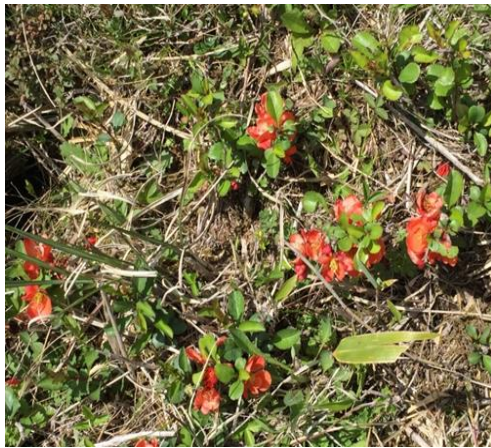
「ボケ」ではなく木瓜の花