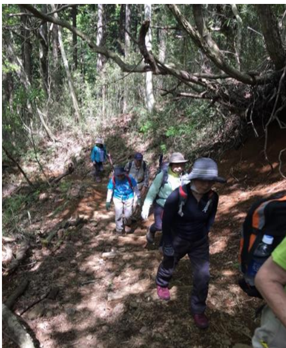
木漏れ日が差すなか登りで