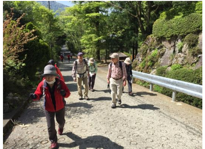
登り初めで体力・気力充分です