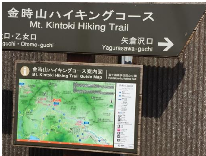
登山口に到着、何しろドピーカン

当日は、快晴でまさに盛夏を思わせる日和でした。帰路の渋滞を避けるため仙石原から登り大雄山へ降りるコースです。予想通り新緑かつ花々が咲き乱れ素晴らしい春というか初夏を思わす暑さのなかの山歩きでした。