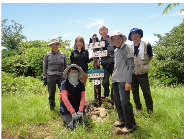
やっと着いた鷲頭山頂上で記念写真