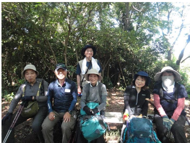
今日の最後のピーク大平山山頂