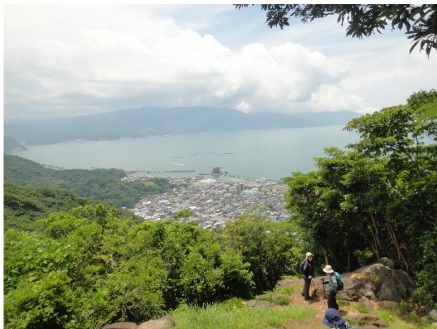
志下坂峠への途上、駿河湾を臨む