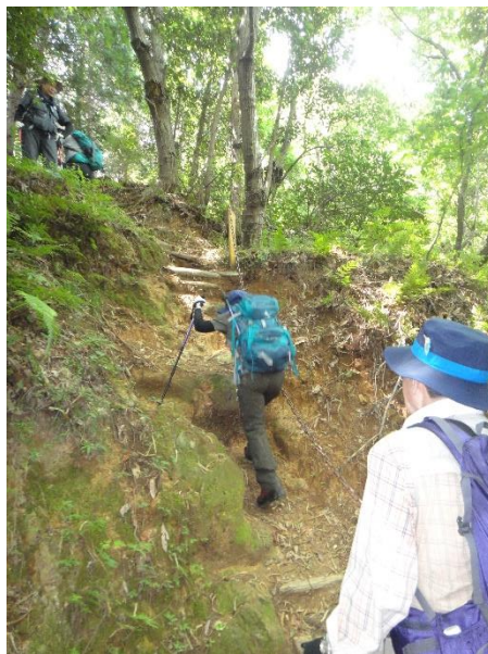
今日のコースは鎖場が多い