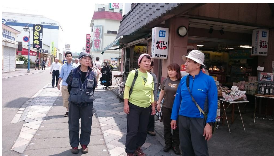
下山後は車で移動し、沼津魚市場で遅い昼食