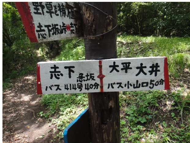
昨日登ってきた志下坂峠までの道を今日は下る