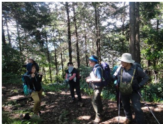
やっと多比口峠に着いて一息