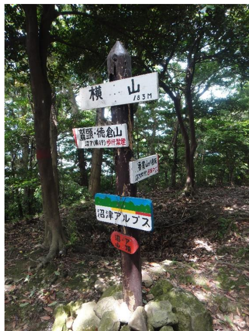
30分の急登後ようやく横山到着