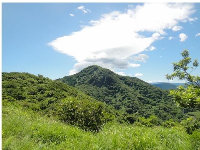
そこからは今から登る鷲頭山がくっきり そして面白い形の雲