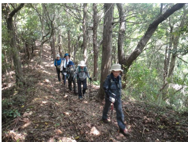
朝食のとりすぎ+急登の後の平らな尾根歩きでほっと一息