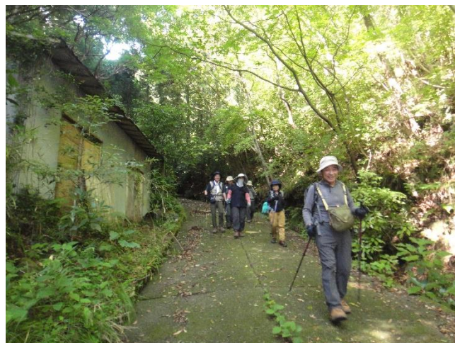
低山の割にきつかった行程を無事に終え 多比バス停へ