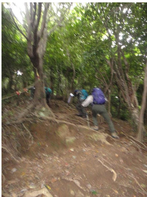
八重坂峠からの登りはいきなり急登