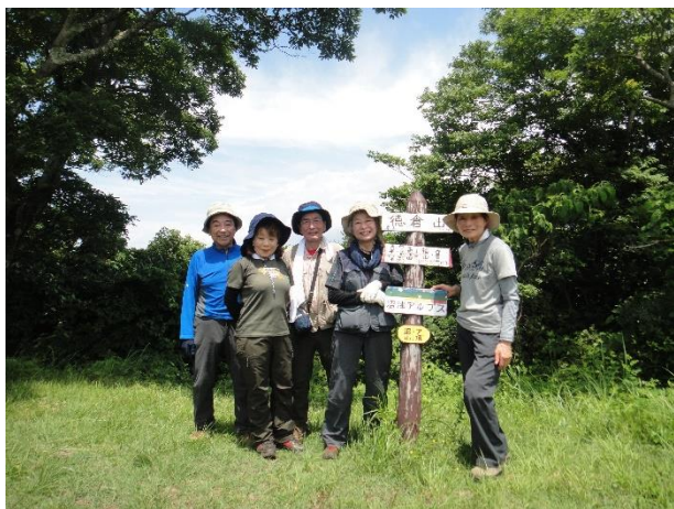
徳倉山頂 晴れていれば背景には富士山がばっちり見えているはず