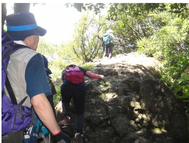
大平山への分岐点多比口峠までの道も 岩の多いスリリングなコース