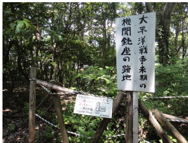
志下坂峠までの道にはこんなものも