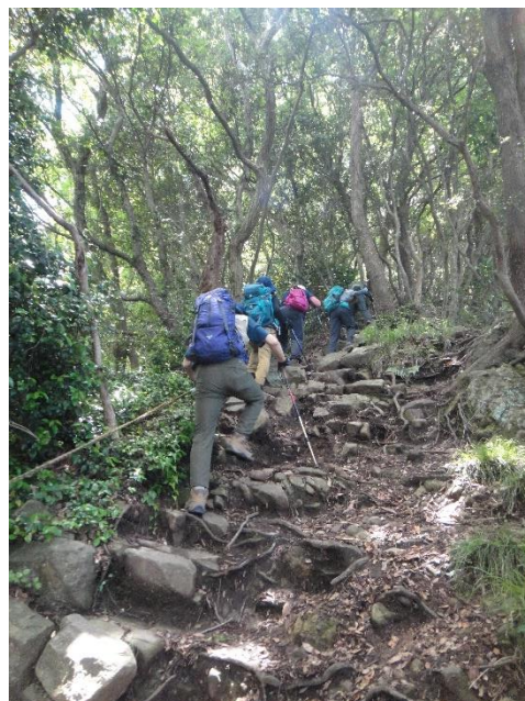
鷲頭山への登りはかなりきつい