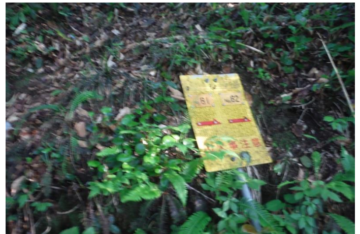
国道からも見えるマイクロ中継反射板