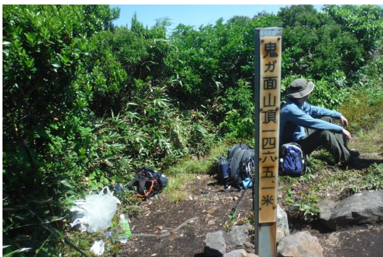
鬼ヶ面山山頂 今回はここまでの予定なので、山頂でゆっくり朝食を摂り同じルートで戻った。今回の山行で出会った花 サンカヨウ