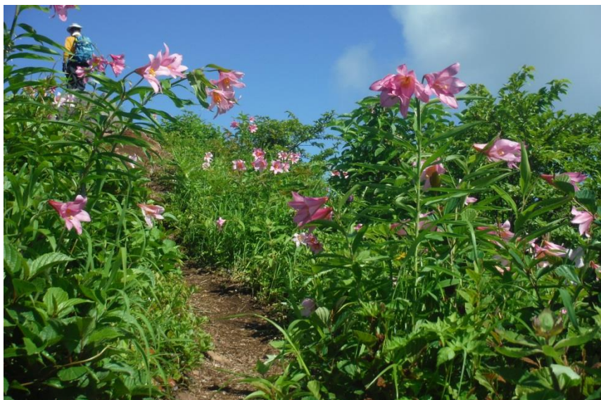
南岳と鬼ヶ面山間はヒメサユリの道