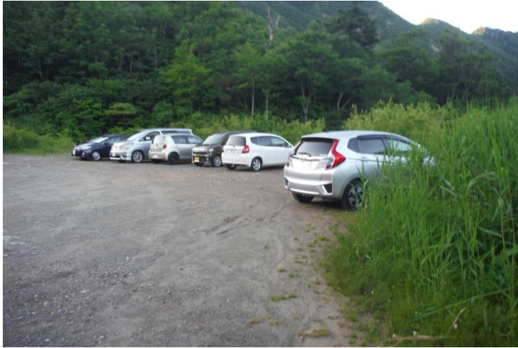
ポストから 15 分位で浅草岳登山口の標識有り

早朝にも拘わらず駐車場にはかなりの車が止まっていた。浅草岳往復の人だろう。福島県側から六十里トンネルを抜けてきたので、進行方向僅かで登山ポストがある。