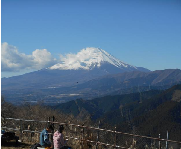
大野山山頂 富士山が綺麗にみえる