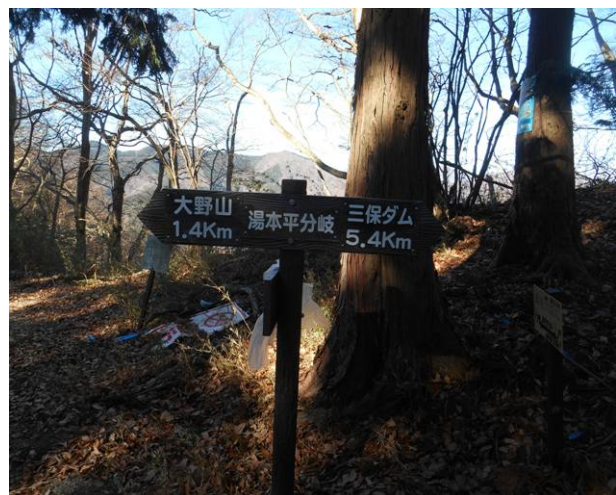
湯本平分岐到着ここから大野山までは 林道コースとなる