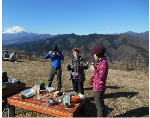
豚汁、ぜんざいを作り美味しくいただきました