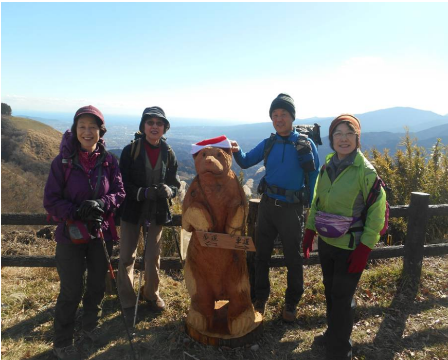
昼食後イヌクビリで 記念撮影ここからは 山北駅に向け下山開始