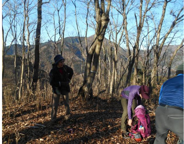
尾根まで約 30 分位で到着