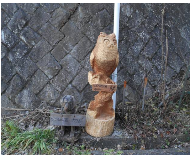
ここのは、フクロウと犬の彫刻が