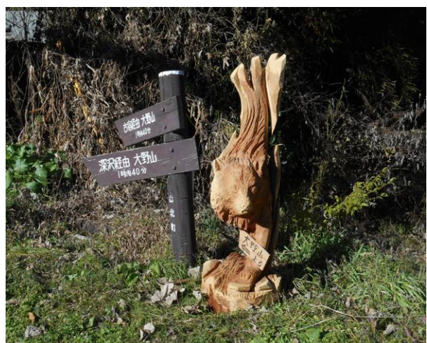
この登山道に木彫りの彫刻が数多くある これも、キツネに見えますが??です