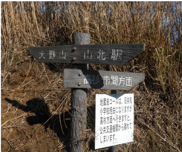
途中に高杉市間方面分岐ですがこの先のコースは背丈位のスキの生い茂る