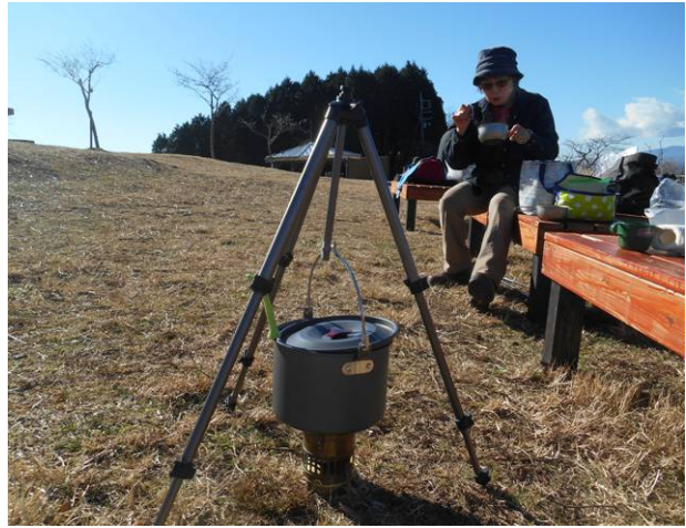
今回の為に鍋用三脚を持参した