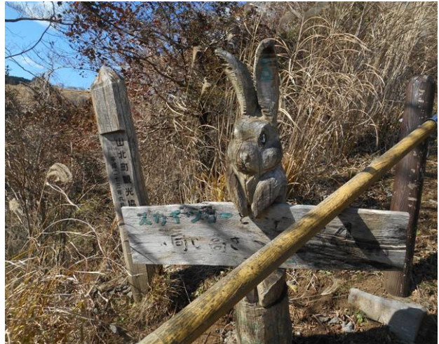
谷峨からの登山道にもあります 標高634m スカイツリーの高さの標識