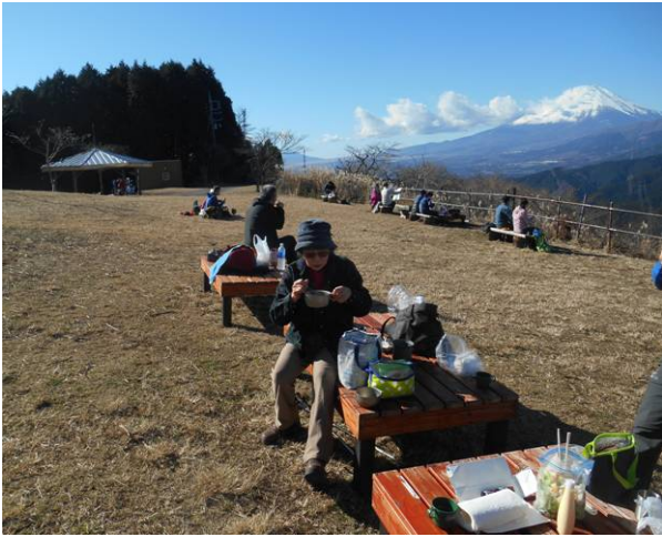
山頂には多数のベンチがありゆっくりと休憩を取ることができます