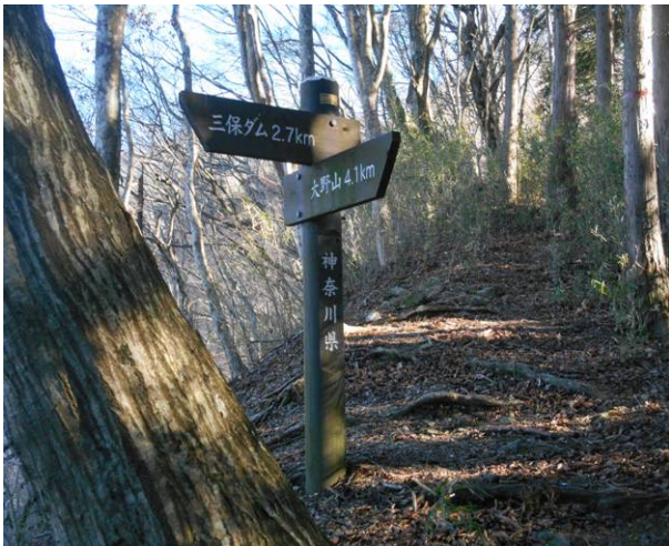
秦野峠分岐ですが、秦野峠への標識はありません 昭文社地図では点線のルートの為