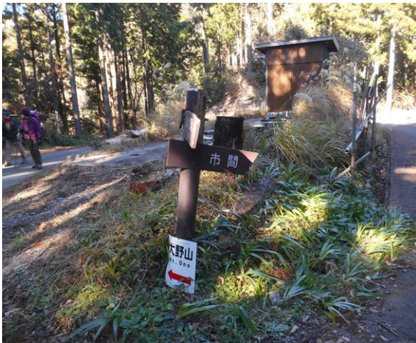
少し手前で林道となる ここからも市間方面に行ける