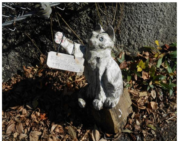
この彫刻の先が大野山登山口となり 山北駅には車道を約20分位で到着