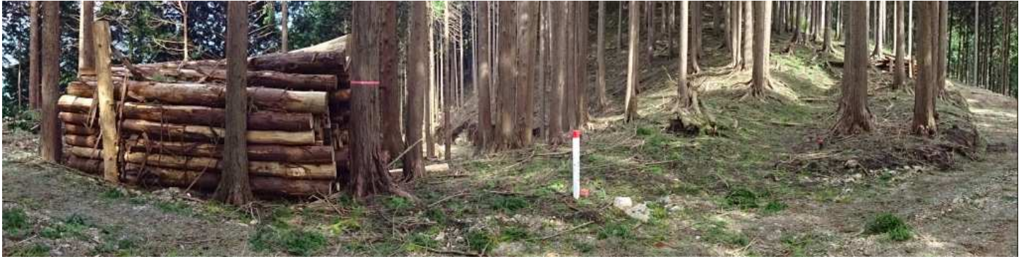
牛首を過ぎても相変わらず林道造成中である