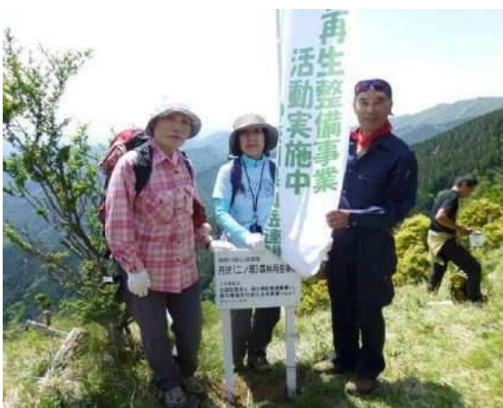
2015年5月に「わらび」でも3名が植樹に参加していたのだが、現在は大きな樹木に成長していました