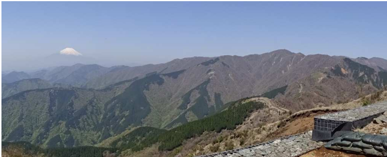
パノラマを堪能して菩提峠へ すでにザックのポケットはタラの芽で一杯 若い人たちが三ノ塔、塔ノ岳を目指して次々と登ってくる