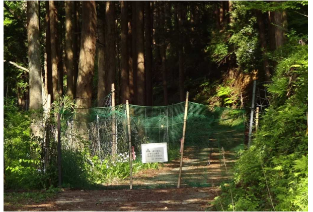
第二東名高速道路工事現場脇を通り向山橋へ