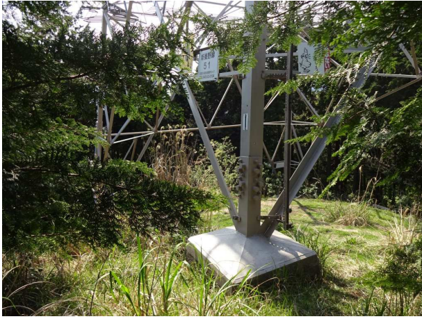
コンパスで方向を西に合わせ下る すぐに鉄塔へそしてジグザグに林道へ降り立つ