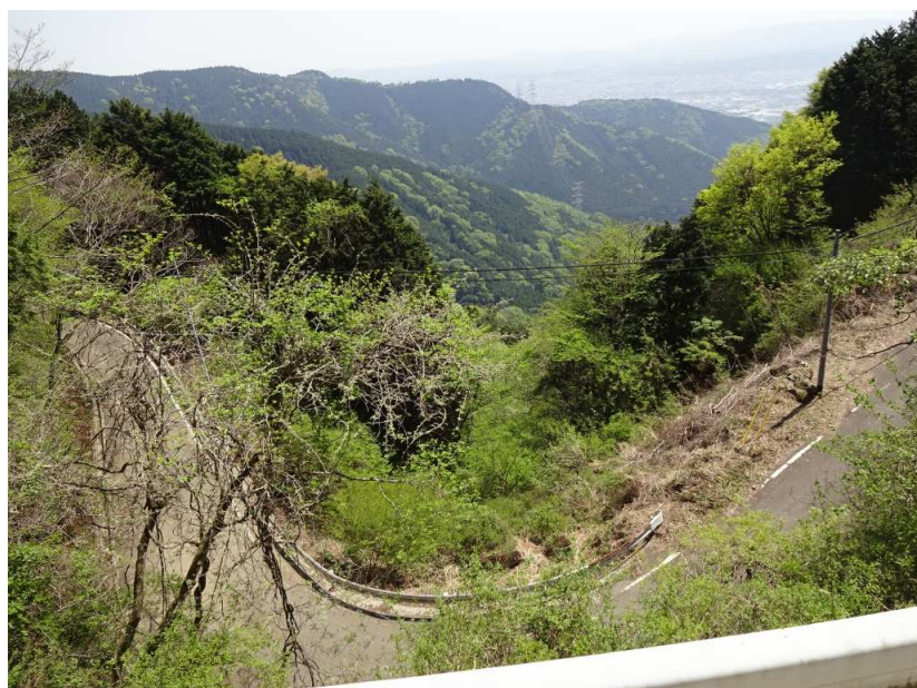
車の入れない静かな林道沿いには収穫物