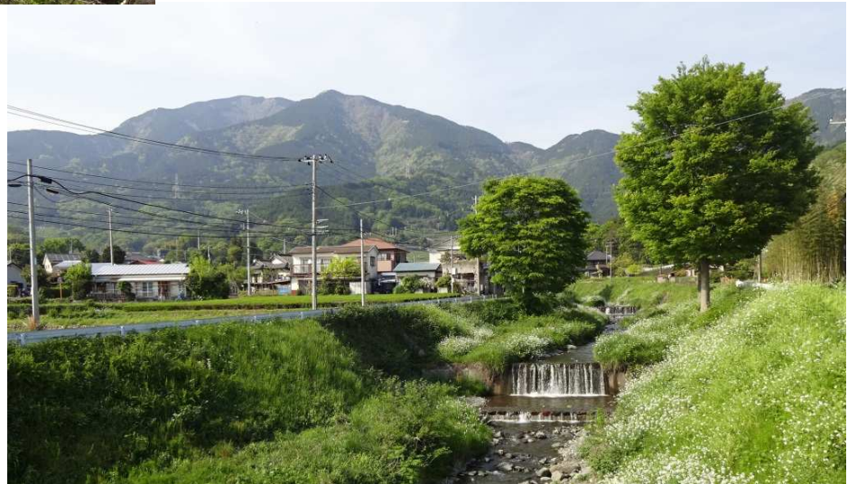
三角山の鉄塔から降り立った 向山集落を振り返り見る 結構な収穫量だった