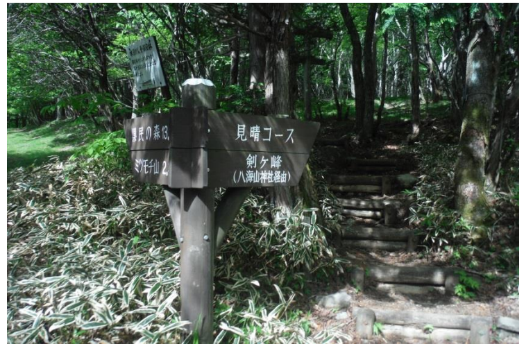
右の剣ヶ峰の道に入ると鳥居が目に入る。

駐車場に有る標識を確認。登りに見晴らしコース・下山は林間コースと決める。10分ほど広い道を行くと左ミツモチ山と右剣ヶ峰の分岐に着く