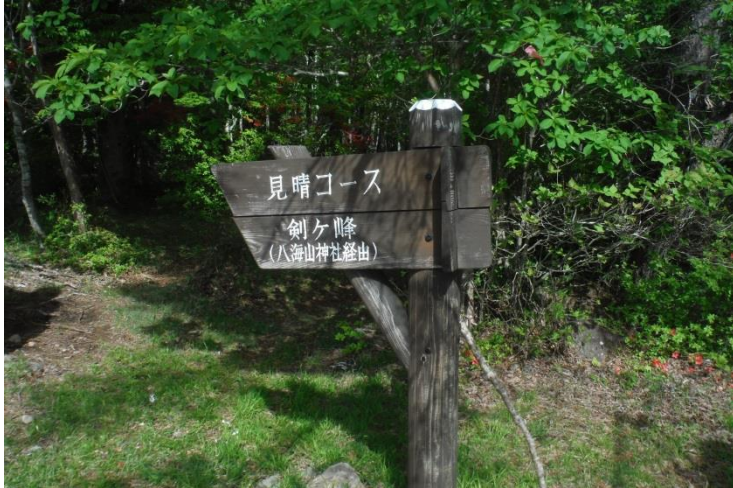
駐車場に有った歩道案内がここにも有り、登山届を出せるようになっていた。

駐車場に有る標識を確認。登りに見晴らしコース・下山は林間コースと決める。10分ほど広い道を行くと左ミツモチ山と右剣ヶ峰の分岐に着く