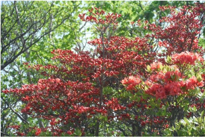
八海山神社から先の登山道はシロヤシオがもう、十分ですと言いたい程咲いていた。