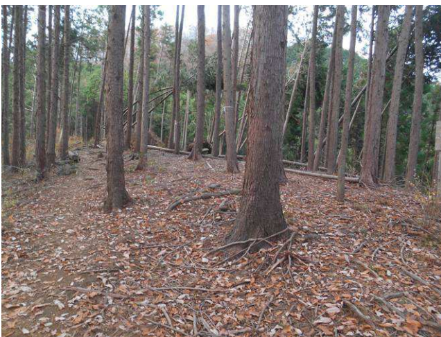
446m地点 標識などは無い