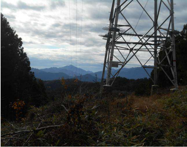
送電線八王子大月線高尾分岐の鉄塔 この先が日影乗鞍