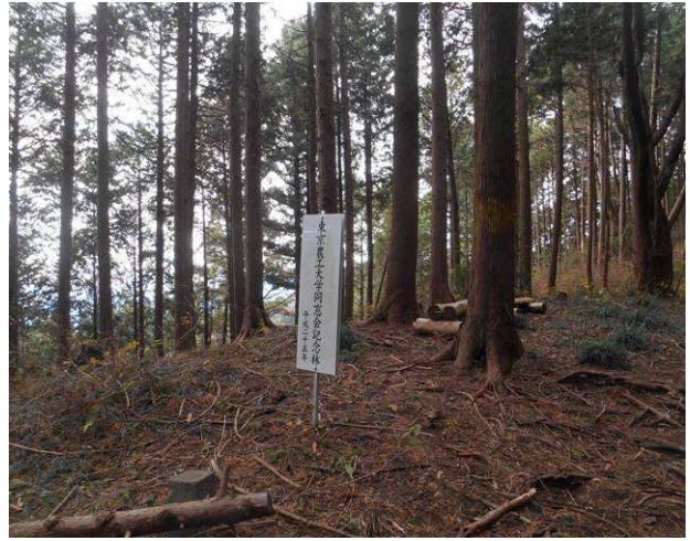
東京農工大同窓会記念林の立札