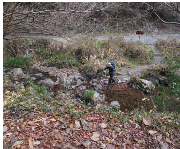
小仏城山北東尾根ルート入り口川の渡渉あり