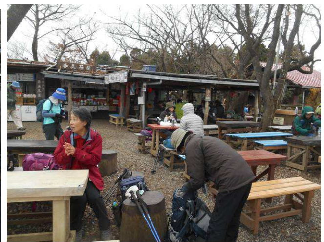
30分位居ましたが 風が冷たくかなり寒い