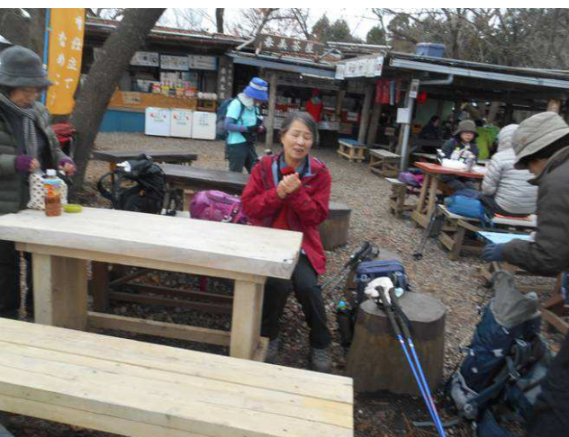
新しいベンチでの昼食及びコーヒータイム