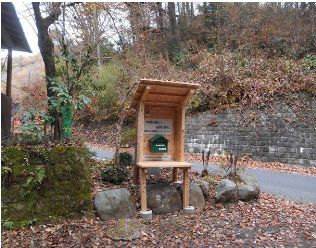
日影林道の入り口 登山届用ポストがあった

日影沢より小仏城山への晶文社地図破線のルー小仏城山北東尾根ルート(高尾詳細地図の表記)へ出かけて、日影バス停より数分歩いた場所より日影林道コースへそこから5分位の場所が小仏城山北東尾根ルートの分岐点で川の敗退側がルートとなっている、踏み跡もしっかりあり、道迷いの心配は無い、最初446m地点までは、少し急な登りですが、その後は緩やかなコースになる、そこから日影乗鞍までの間は人口林のコースで、この先に東京農工大同窓会記念林がある、そこを過ぎると日影林道にぶつかり、小仏城山は目の前に現れる、城山には、多数のベンチがあり、忘年山行らしいグループが数組いて、鍋や焼き肉等で、ビールで乾杯をしていた、薄曇りで風もあり、体感的にはかなり寒い私たちがバーナーでお湯を沸かし、コーヒータイムを含め昼食をとった、約30分位居たが寒いので早々に下山を始めた、帰りは日影林道を日影バス停に、途中にキャンプ場があり、数組のテントが張ってあった、このキャンプ場を利用したの登山も面白いかも、日影バス停に到着したが、バスの時間が、まだあったので、次のバス停まで歩く事にした、結局バス停3個分歩いて 蛇滝口バス停でバスを待ち、高尾駅に向かった、北口にはお店が少ないので、南口に回り居酒屋での反省会(来年の山行計画の話あい)を行った。