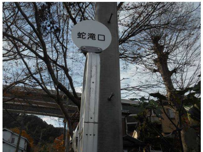
このバス停より高尾駅行きのバスに乗った