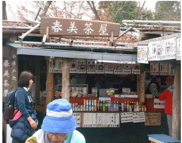
今日は休日なので 山頂の店が開いている、この寒さでも冷たいビールを売っていた