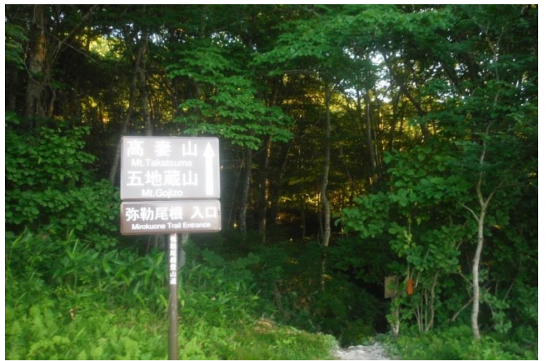
標高1190メートルの牧場からとりあえず1998mの五地藏山を目指す