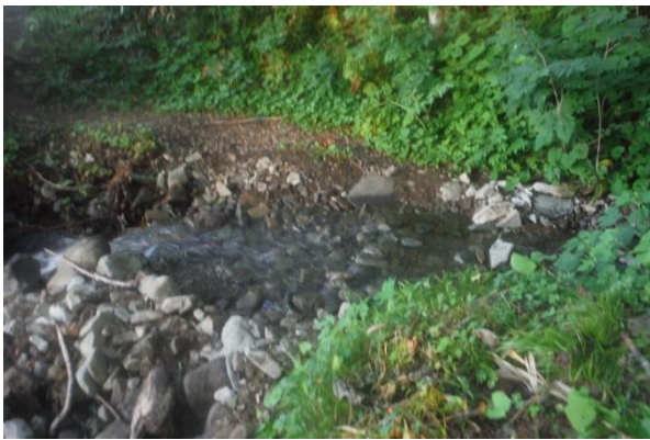
直ぐに支沢を渡る