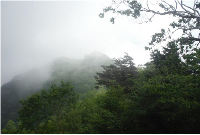
八観音と七薬師のピーク