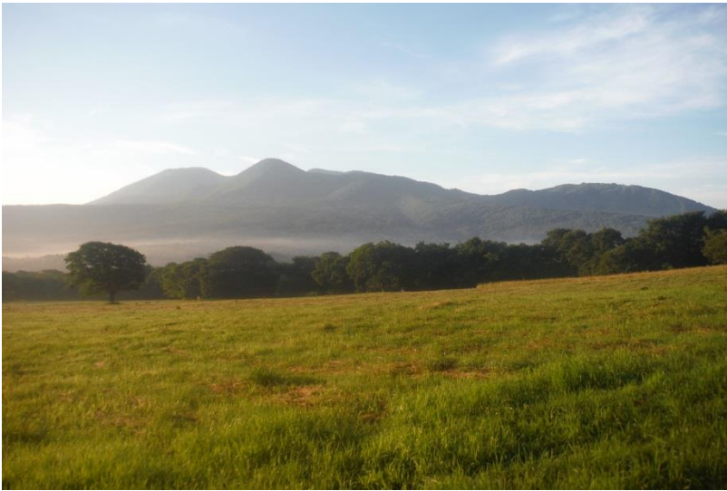
登山口までの戸隠牧場から見える 妙高・火打