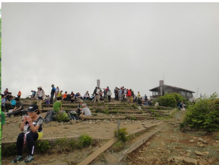
塔ノ岳山頂は百人を超す登山者で賑わっていました。