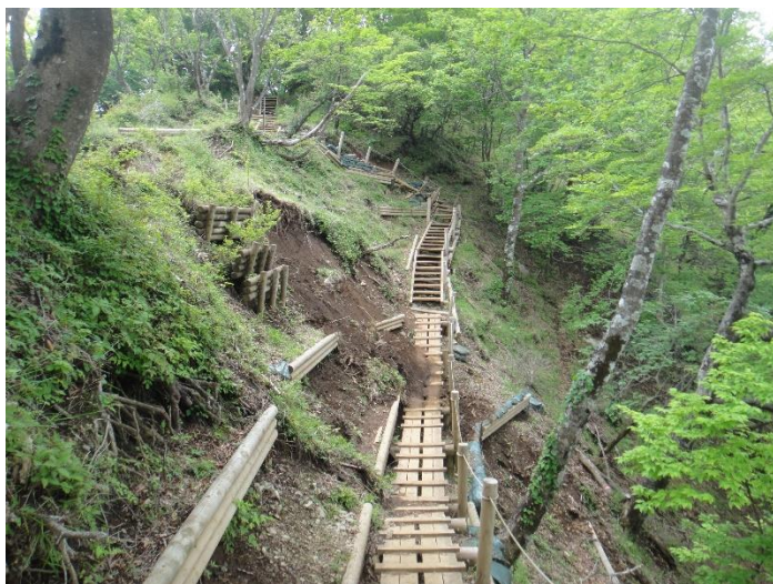
崩落で新たに付けられた歩道にもまた土砂崩れがありました。 整備してくださる方々に感謝。