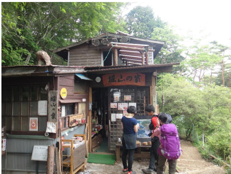
堀山の家ではご主人が屋根の補修中でした