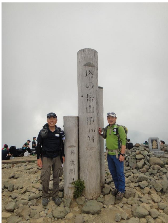
念願の塔ノ岳登頂！記念写真