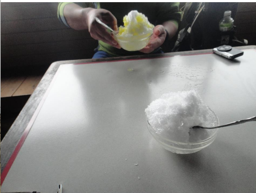
花立山荘で TA さんお勧めのかき氷。美味しかった～！