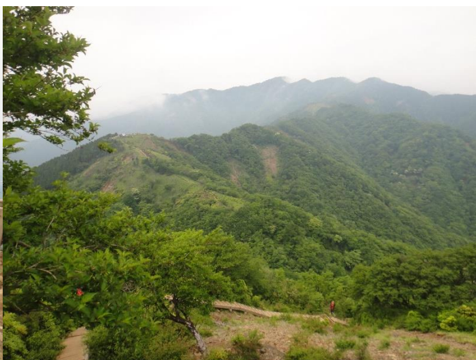
三ノ塔からこれからのコースを一望。 ちょっともやっていますが、ガイドブック通り。