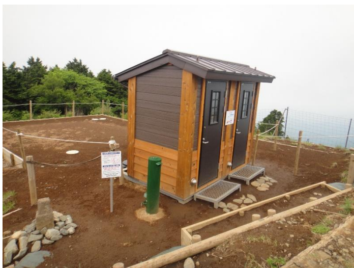
三ノ塔ではトイレが設置されていました。 この後にも同じ仕様のトイレが数か所整備。