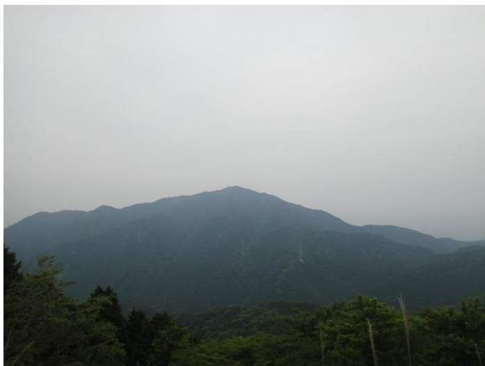
大山はいつ見ても美しい！