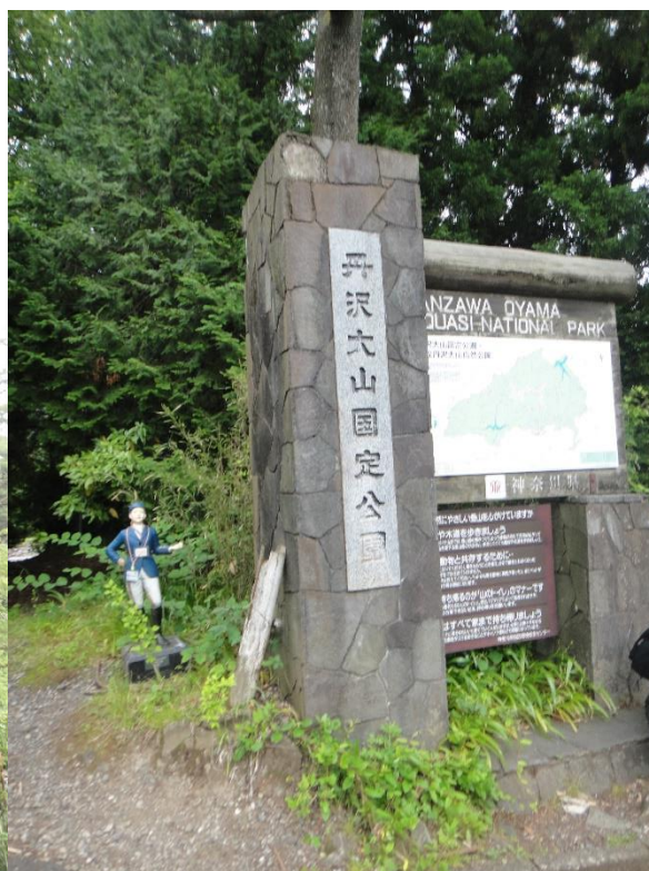
本日も無事に下山。 楽しい山行でした。