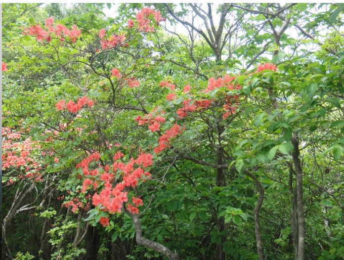
山つつじがところどころで見られました