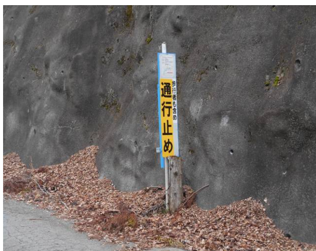
小川谷出合への分岐 ユースンロッジへの通行は、歩行者も含め通行止めです