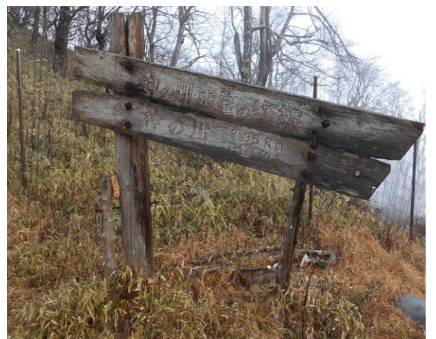
ヤタ尾根別名 (神の川熊笹の峰線) 神の川 2.95km 1時間 30分