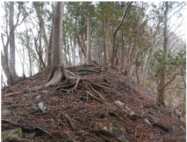
コースはほぼ直登に近い