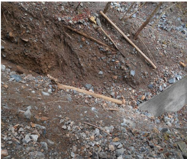
(手前より見ている)