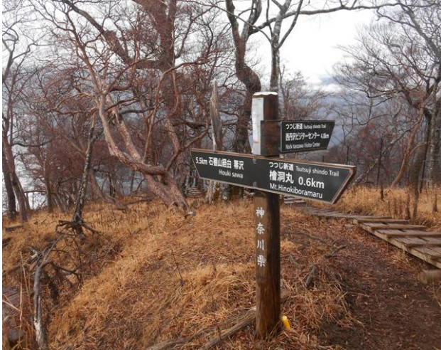
つつじ新道コースに合流 檜洞丸へはもう少し