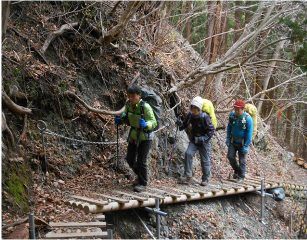
途中コースが崩落で 橋を設置