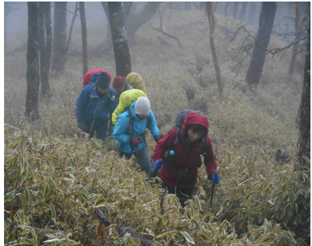
ヤタ尾根分岐まで 笹原が続く