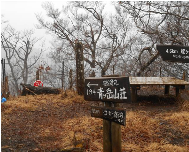
急いで今夜の宿泊場所へ急いだ