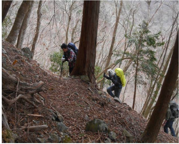
昭文社地図点線のルート 急登