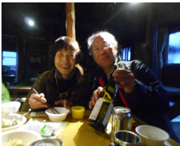
高級ワインで ご機嫌です