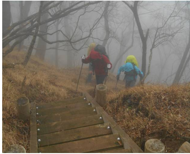
合流前の最後の階段