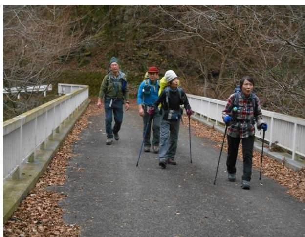
仲ノ沢林道を西丹沢県民の森まで行きます