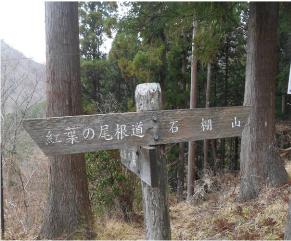
県民の森 紅葉の尾根道と石棚山への分岐