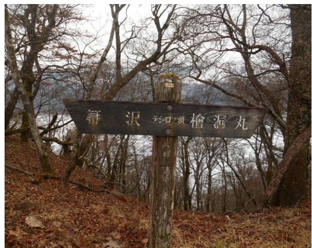
テシロノ頭に到着 少し手前で小雨が 降りだした