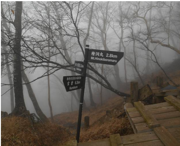
石棚山西尾根コースに合流