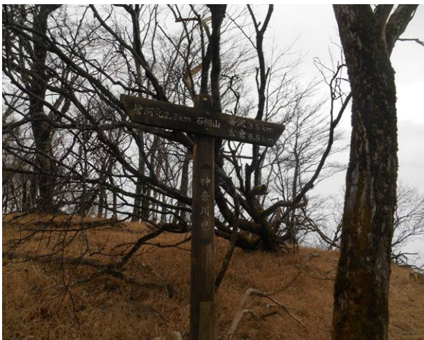
石棚山の標識 古い物 (檜洞丸へ 2.6Km 表示) 同じ場所の標識ですが、行く先の距離が異なる