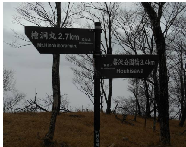
石棚山の標識 新しい物 (檜洞丸へ 2,7Km 表示)