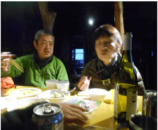
小屋での夕食 各自持参したアルコールで 宴会です