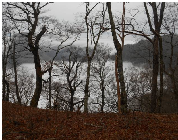
テシロノ頭の手前 きりが正面のやまより 流れ込んでいる 幻想的で綺麗