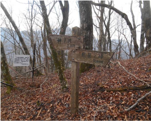
熊笹ノ峰を通り過ぎる 約 0.6Km 手前 標識には気が付かなかた