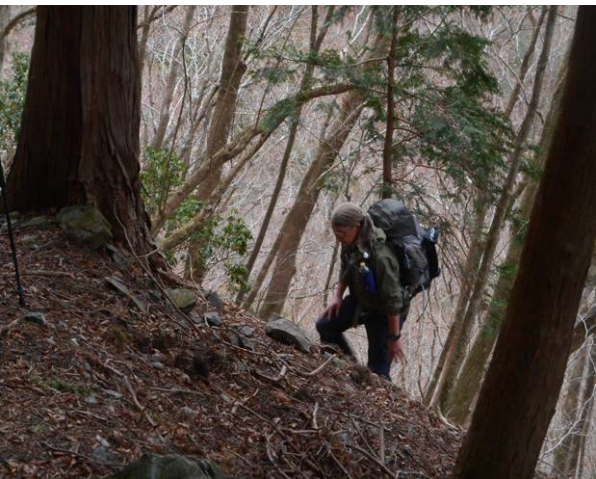
昭文社地図点線のルート 急登