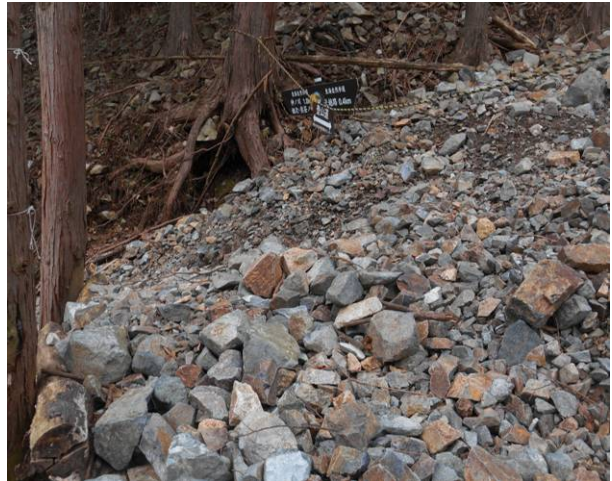
以前は直進がコースでしたが崩落の為 通行止めとなっている