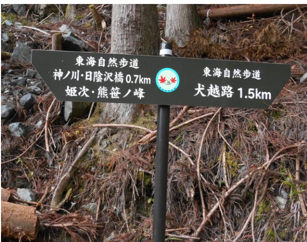
神ノ川ヒュッテから 犬越路へ 東海自然歩道の一部 手前の表示先が多数