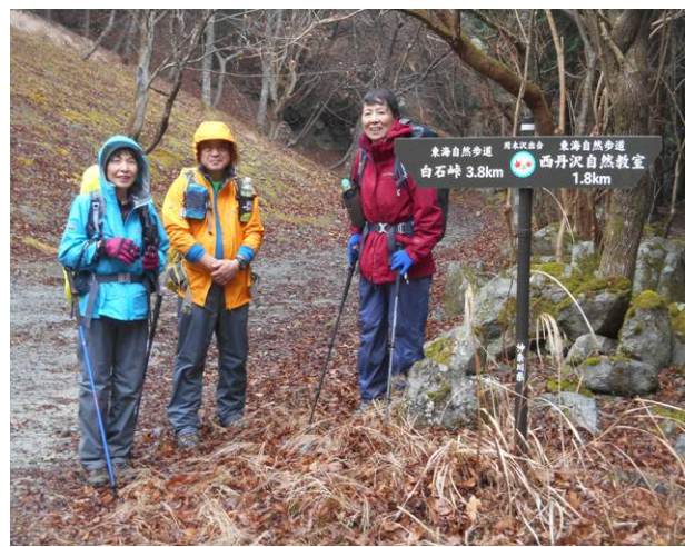
用木沢出合に到着 無事に今回の山行も終わりました