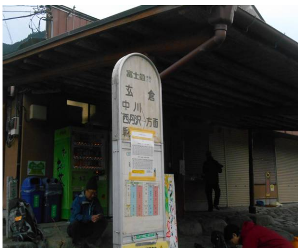
玄倉バス停 今日天気予報が良くないので新松田よりここまでの間 私たち5名のみ乗車でした

丹沢の山小屋でまだ泊まっていない、青ヶ岳山荘に泊まる計画を立てた、コースは、玄倉から仲ノ沢林道経由檜洞丸、途中県民の森から石棚山の間は、昭文社地図では、破線となっている。