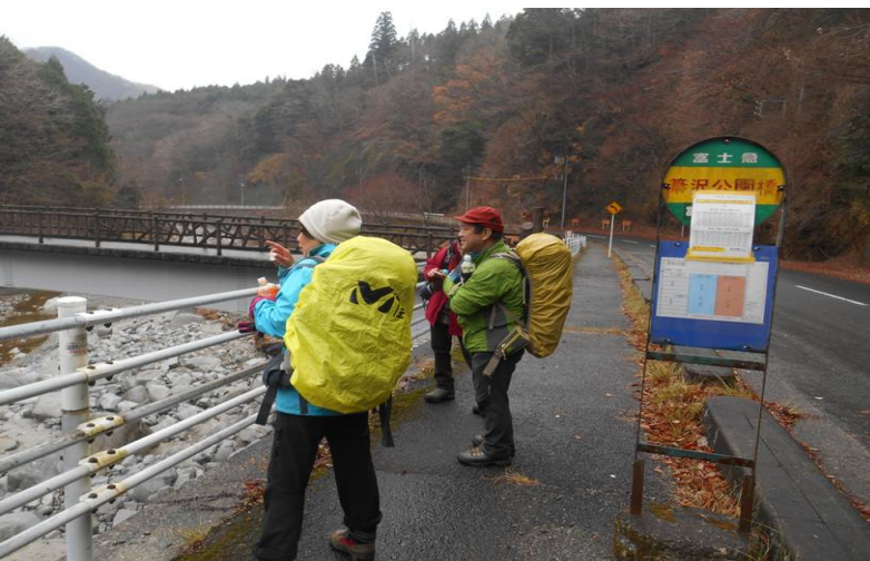
用木沢出合からビールの購入先を探しながら 簗沢公園橋まで歩きましたが、残念ながら、ありませんでした バスの時間もあるので、ここから新松田駅行きバスにのり新松田到着後、居酒屋で、反省会を行った