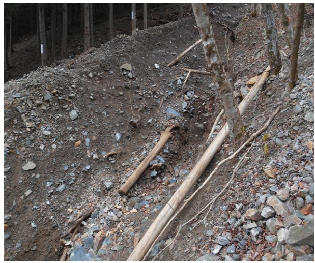
(渡ったあとより見ている)