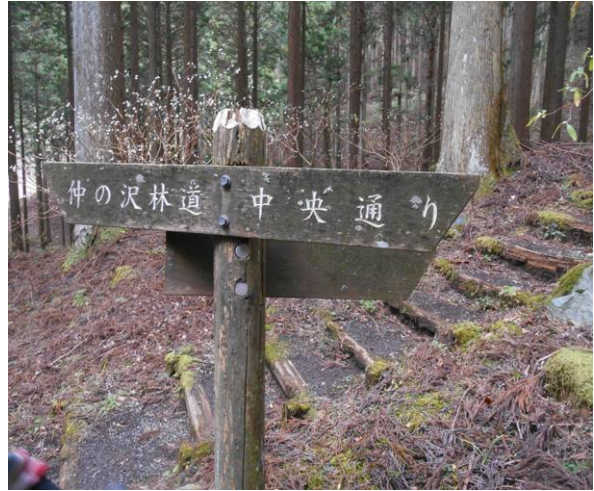
県民の森の中 中央通りを進む