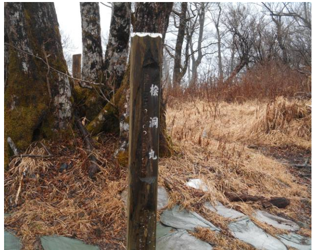
檜洞丸へ到着 こんな天候なので 誰もいません