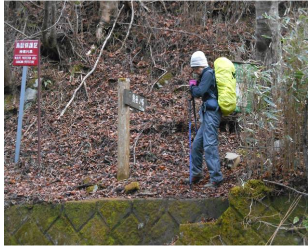
神之川林道コース 上側に合流