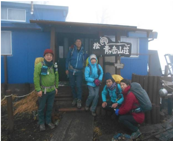
山荘前で 出発前の記念写真 12月にしては暖かい