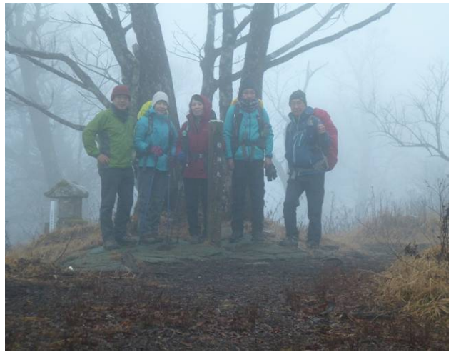
檜洞丸で記念写真 霧で顔が良く見えない