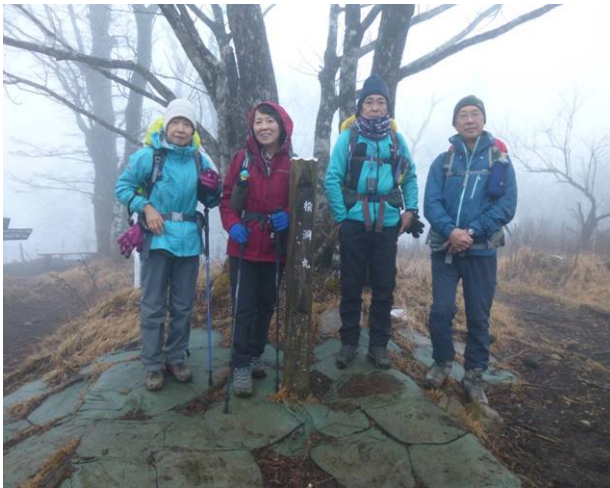
もう少し近くでの写真撮影