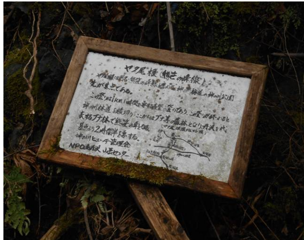
ヤタ尾根の説明書き