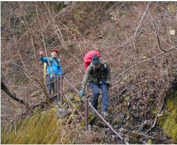
神之川林道コース 下側に合流 神ノ川ヒュッテはもう少し