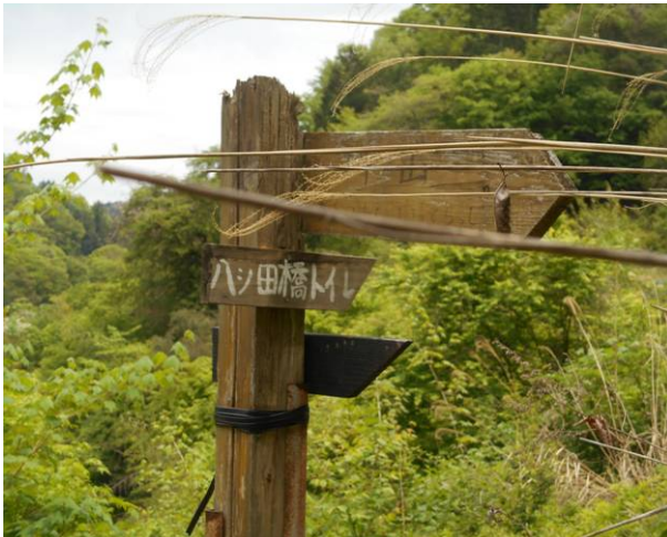
道標にトイレの標識が