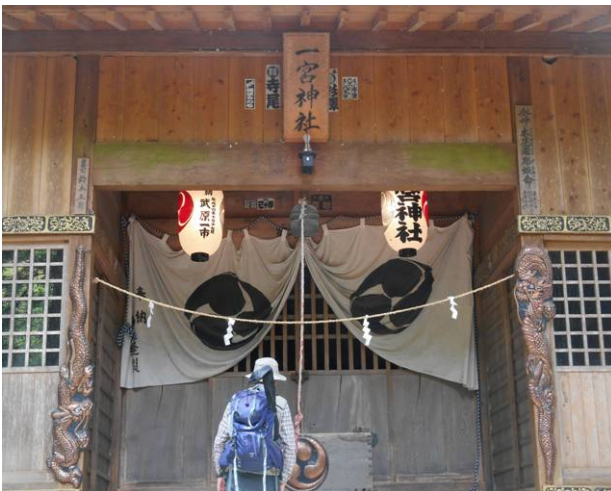
ハツ田バス停より学校前バス停の間に立派な神社があり、立ち寄ってみました