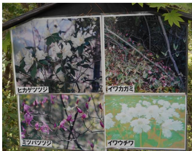
坪山は花で有名です看板に4種類の花の写真が