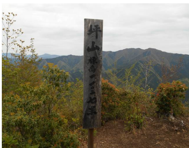
坪山 山頂 そんなに狭くはない