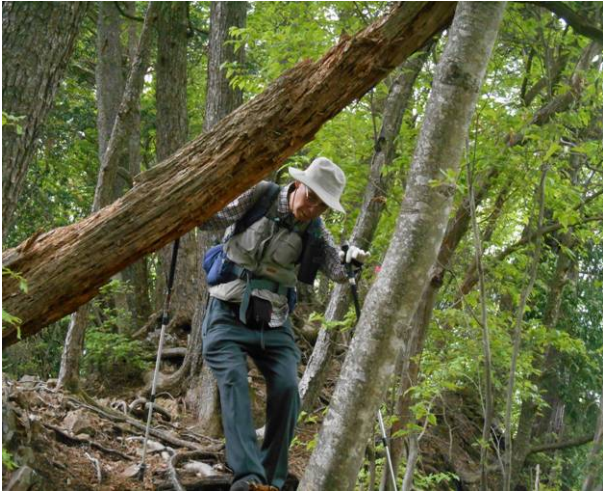
途中倒木がコースを塞いでいた