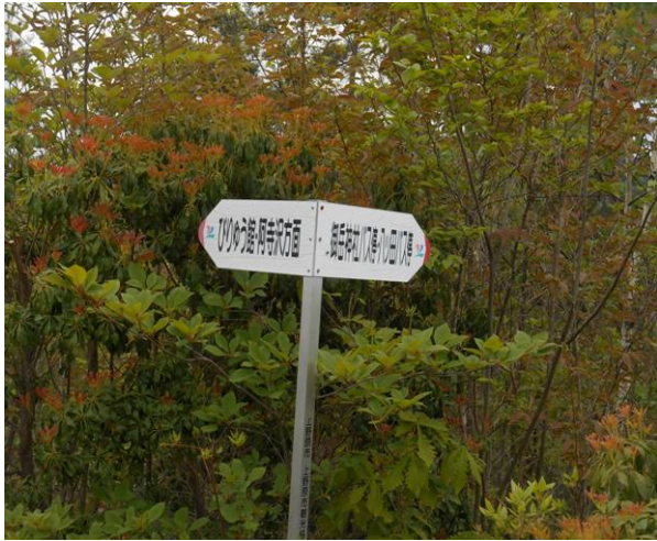
びりゅう館方面の標識 今回はこちらのルートは使用しません