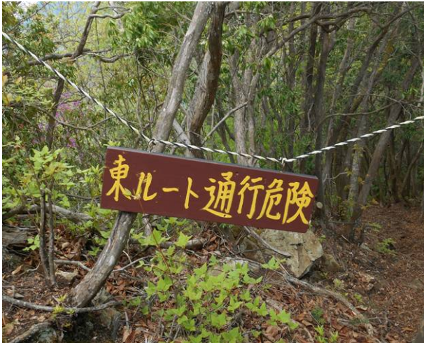
東ルートの入り口の看板