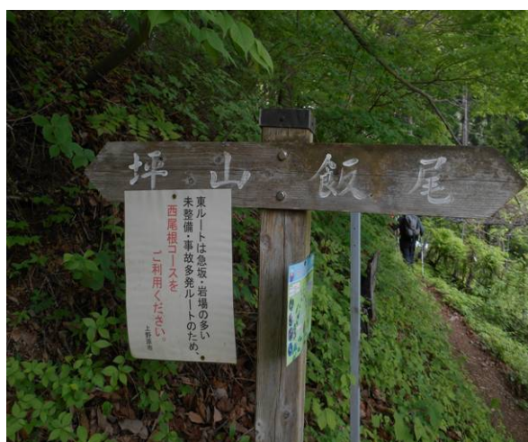
東尾根、西尾根分岐 ここにも東ルートは事故多発ルートの為西尾根コースを利用