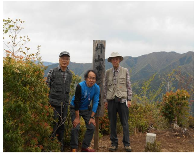
数組の登山者がいたので記念写真を撮ってもらった