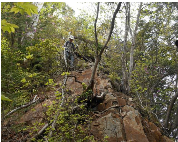
昨年の暮れの遭難もこの場所かも