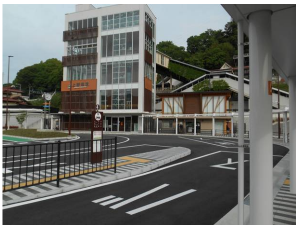
上野原駅のバス停が4月2日より南口になり立派なバスターミナルになっていた

昨年暮れに3名の方が遭難し亡くなった坪山に行く事にした、特に東尾根が情報によると急な岩場の為下りは危険との事なので、今回は東尾根を下るコースとした。