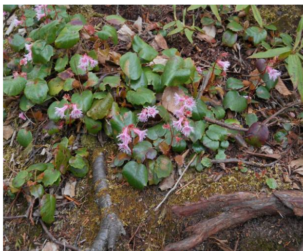
登山道のすぐ脇にイワカガミの群生地