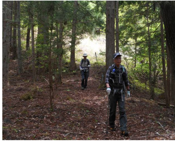
下まで降りてくるとコースは広くなだらかになる。ここまで来ると危険は無い