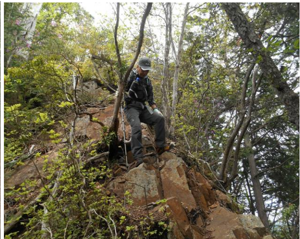
入ってすぐに岩の急な下り整備されている場合はロープ又は鎖が設置されている場所です