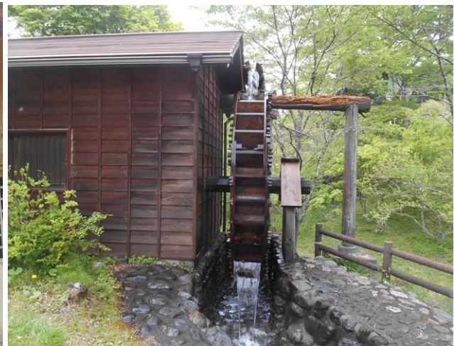
びりゅう館の近くの水車小屋 ここでそば粉を挽いている 今回は、そばはたべないが美味しいそばだと思えます。