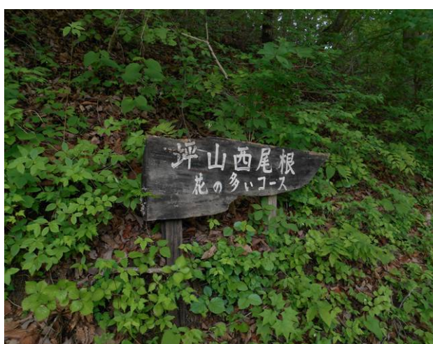
西尾根コースの入り口