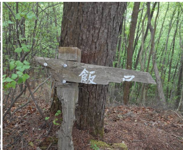
未整備のルートなので道標も古いまま