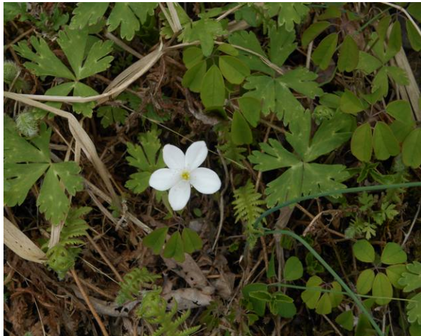
花の名前は不明ですが、