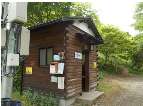
八ツ田バス停より数分の場所のトイレがある警察官が立っていて登山届の提出をもとめられた私たち以外2グループはその場所作成私たちは会の登山届を提出した正面が登山道です。