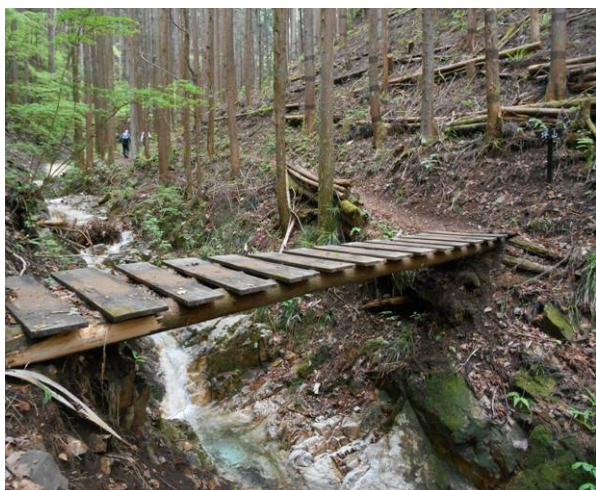
最初は木橋を渡り人口林の中を尾根まで