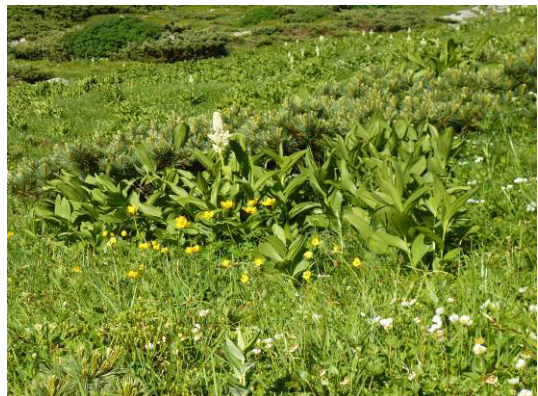
シナノキンバイ、コバイケイソウ