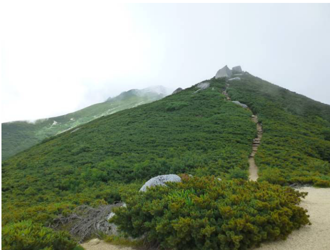
さあ、最後の登りで駒峰ヒュッテへ