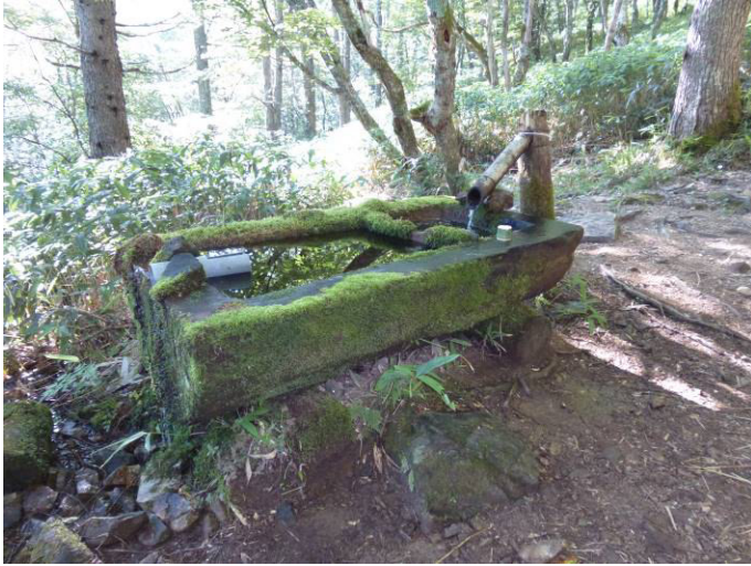
池山小屋分岐の水場