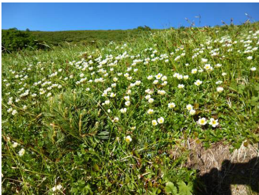
ハクサンイチゲのお花畑