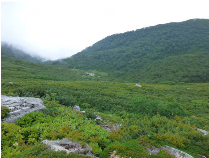
空木平カール方面を見る