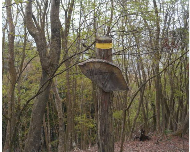
下山コースで林道の合流地点 登山道の標識