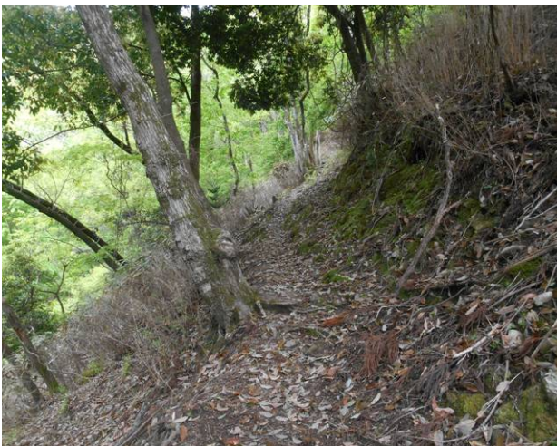
コースはかなりの急な登りで道幅が狭い片側は崖の道になります