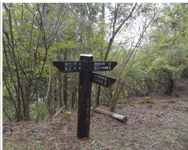
生土分岐 右側は神縄断層 生土不老山林道 次回は右側のコースを降りて見たい