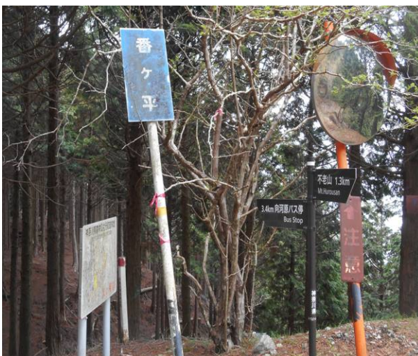
番ヶ平 林道との合流地点 ベンチもあり 休憩に都合がよい