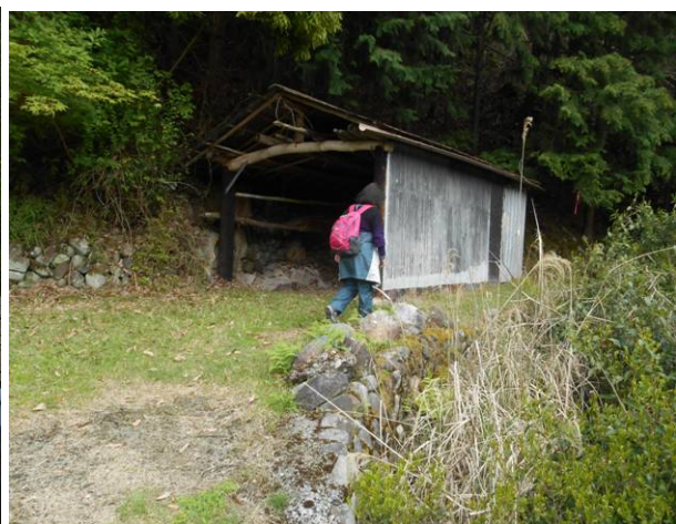
この小屋の横を通過すると 登山口