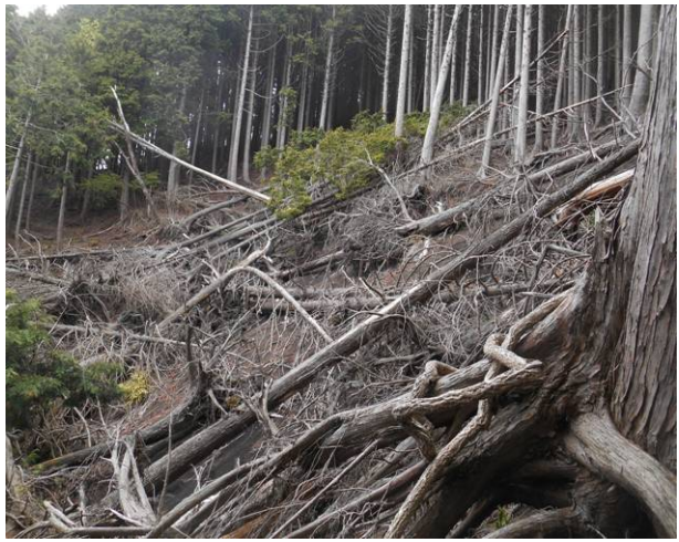
H22年の台風による崩落箇所 登山道は右側を迂回するルートが出来ています