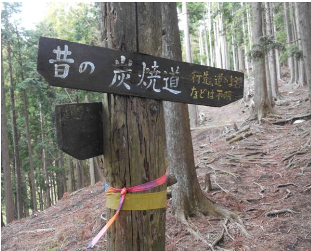
途中の標識 行き先は不明となっている こんな標識があると、コースが気になります