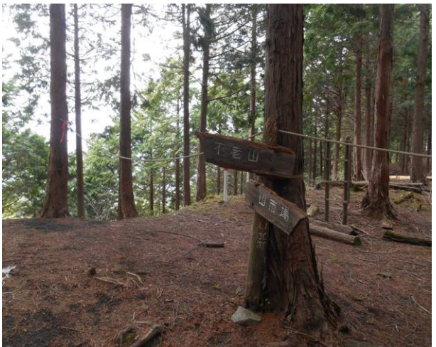
右側のロープからは世族からのバリエーションルートです 以前に上って来ました