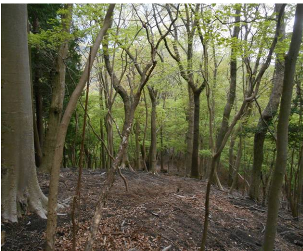
途中新緑が綺麗な場所