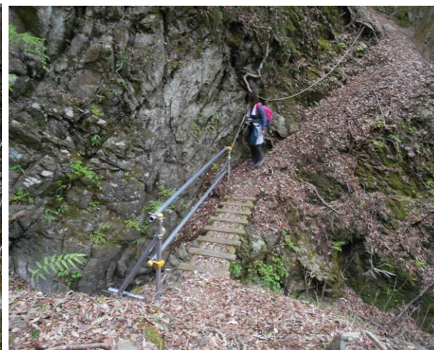
途中に小さな沢があり橋が架かっていた