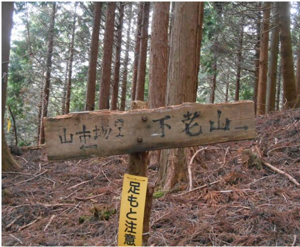
標識はあるがかなり古い