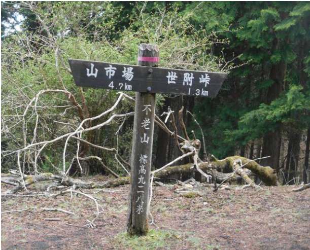
不老山 山頂に到着 今日誰もいません