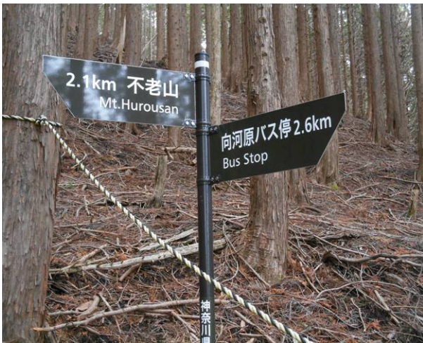
迂回路の途中の標識これは 新しい