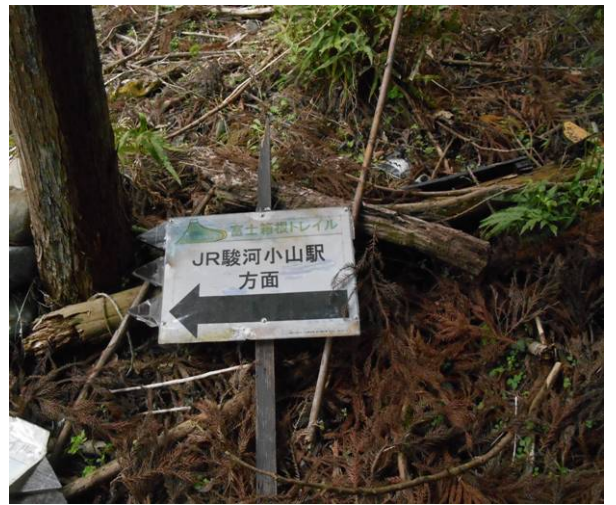
登山口まで降りてきました後は生土部落經由 駿河小山駅に向かいます。