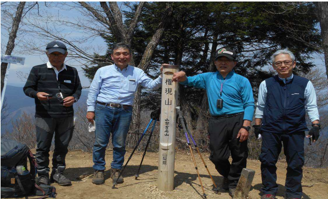
権現山での記念写真 3名の登山者は昼食中 百蔵山よりの人たちでした