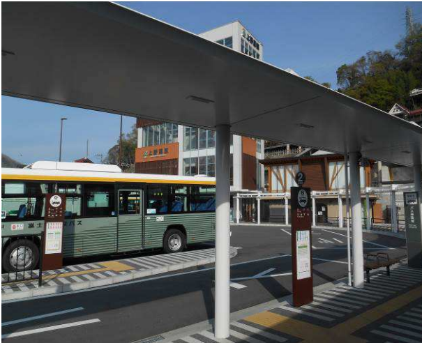
上野原駅バス停約1年前に新しくなり バス待ちも楽になった

今回の山行は、以前権現北尾根を雪の時に登ったが、雪の無い時期に登ろうと思いましたが、この時期は坪山のイワカガミ等花の季節の為 上野原バス停1番乗り場は長蛇の列となります、8時6分のバスは臨時便を出しましたが、満員で乗れない人もでました、私たちは次のバスでの移動の為、うまく先頭に並ぶことが出来、座っていけました、次の便も満員で数名の方が乗れません、この時期の集合時間の設定に注意が必要?? バスは途中要害山へのバス停で数名下車し、初戸では私たち以外に2名の方が下車その他の人はおそらく、坪山への登山者と思われます。