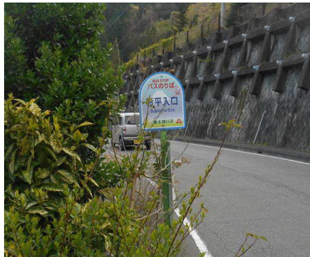
バス時間の数分前にバス停に到着