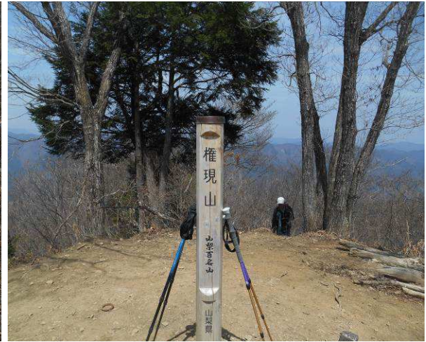
権現山山頂 正面が北尾根のルート