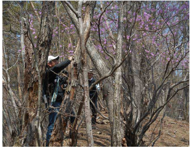
途中ツツジの花が咲いていた