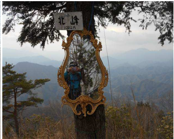
三ツ森北峰自撮り用に鏡が取り付けある