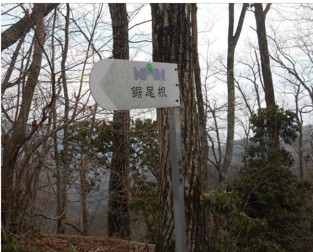
鋸尾根分岐 名前の通りのアップダウンの ルートを実感しましたが、意外に巻道と なっていた