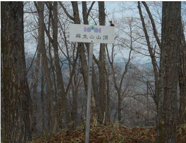
麻生山 山頂 標識があるのみ