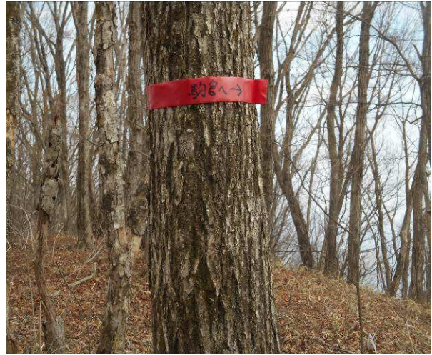
駒宮への分岐 地図で確認すると 浅川峠經由駒宮と思われる