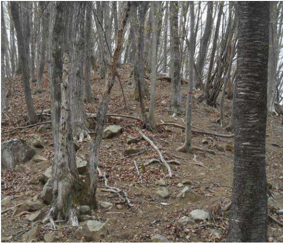
尾根ルートに戻り尾根を登って行く