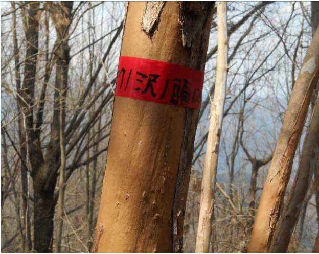
地図には無いですが オクノ沢ノ頭