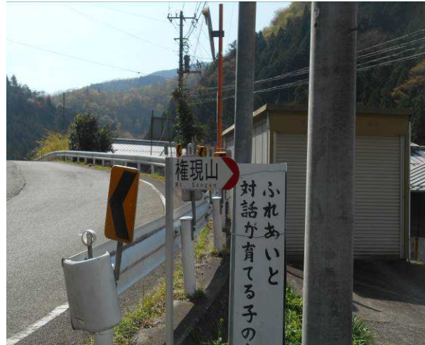
初戸バス停 権現山への標識はありま 玄房尾根のルートは左側に行きます 今回1名の方が誤って北尾根ルートに 来てしまい、道迷を起こしていた