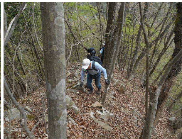
途中作業道がありそちらへ進んだ所 コースを外れている為 崖を直登した かなりの急な登りです