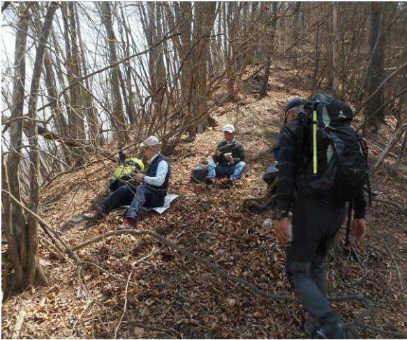
時間が来たので、尾根の途中で昼食タイム