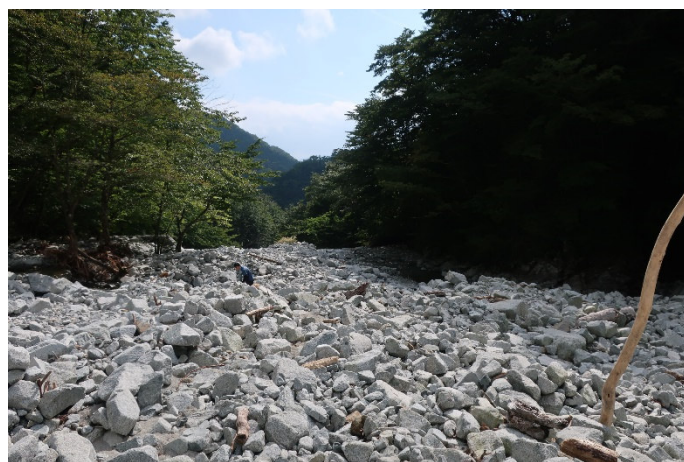
ゴーラ沢出合はいつ見ても美しい