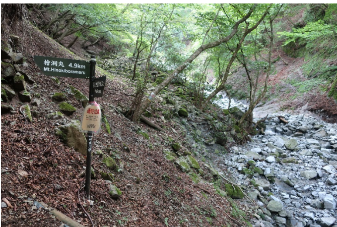
沢とお別れ、左に曲がって急登開始