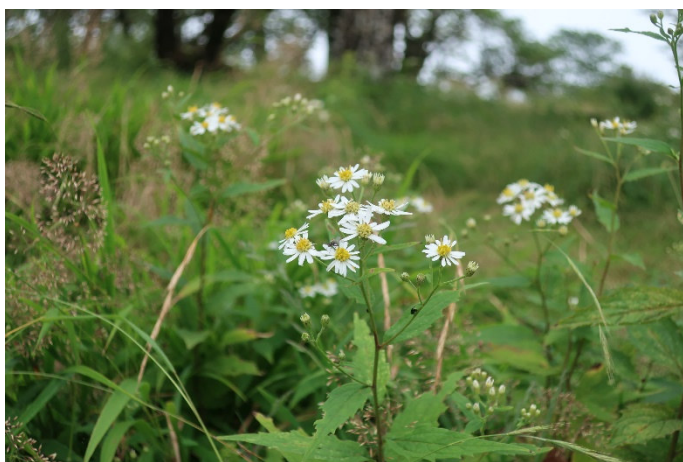
シロヨメナが山頂付近で満開