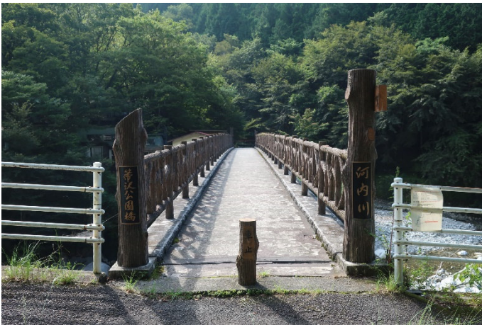
箒沢公園橋から出発！

この日はかなり気温と湿度が高く、石棚山への急登部では風が無いと汗だくになった。石棚山から尾根部に出ると、傾斜の緩い穏やかな尾根道になった。ただし、曇って来て、山頂まで展望は全く無くなってしまった。下山すると、また、快晴の夏が待っていた。