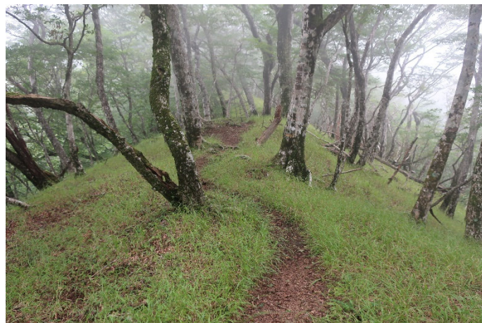
石棚山稜は穏やかな尾根道