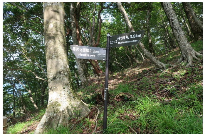
板小屋沢の頭 急登が続く