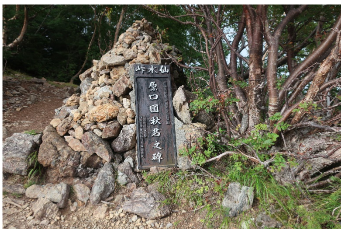
駒津峰から仙水峠に下る かって遭難した九大学生の碑