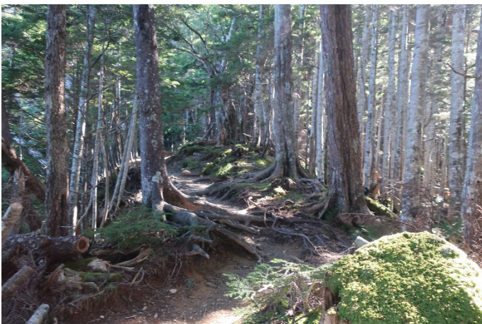
始めは樹林帯の中で涼しい 結構な急登