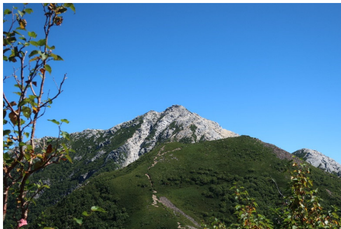
これから登る甲斐駒ヶ岳（中央奥） 手前は駒津峰、右奥は摩利支天