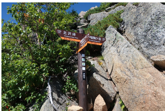
直登コース分岐 直登コースは急すぎて、また、長くて 登る気がしない