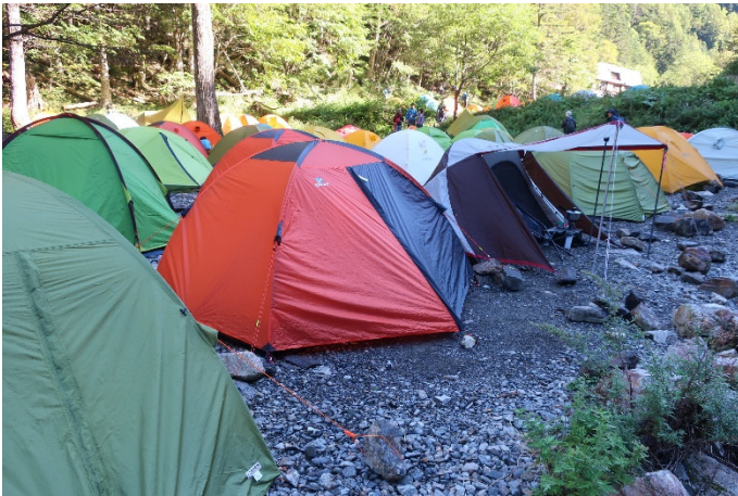
我が家 (テント場はびっしり)

夜行バスで仙流荘に入り、南アルプス林道バスで北沢峠に入る。まず、10分ほどで着く長衛小屋に行き、テントを設営する。軽装備に整えて、甲斐駒ヶ岳へ向けて出発した。