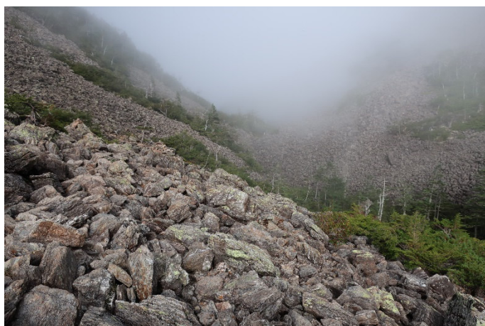
仙水峠からは、こんな道なき道に行く 大石がゴロゴロ