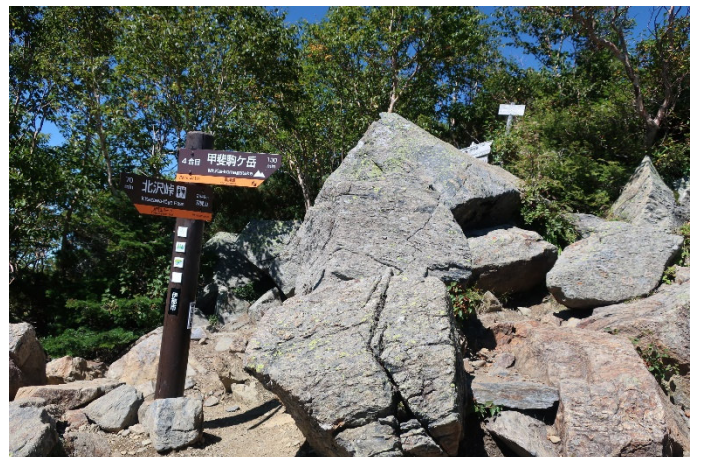
双子山 (四合目) に到着