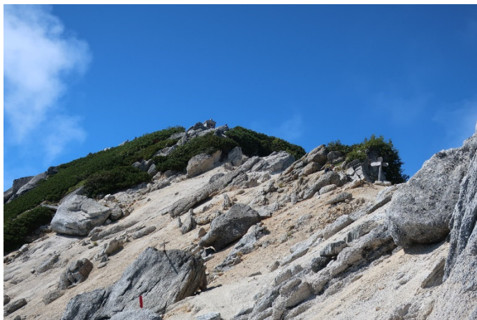
いよいよ、山頂が見えた