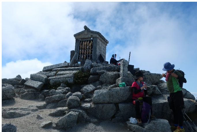
山頂到着 駒ヶ岳神社の祠