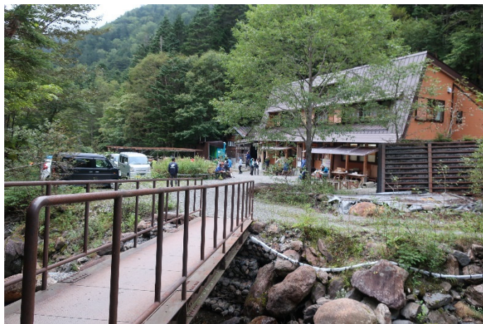
長衛小屋に到着！ 本日はここにテント泊