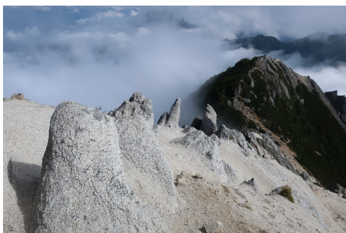
下りに入り、摩利支天を見る 10分ほどで着くらしいが、結構な岩登りである 今日は、疲れたのでパス