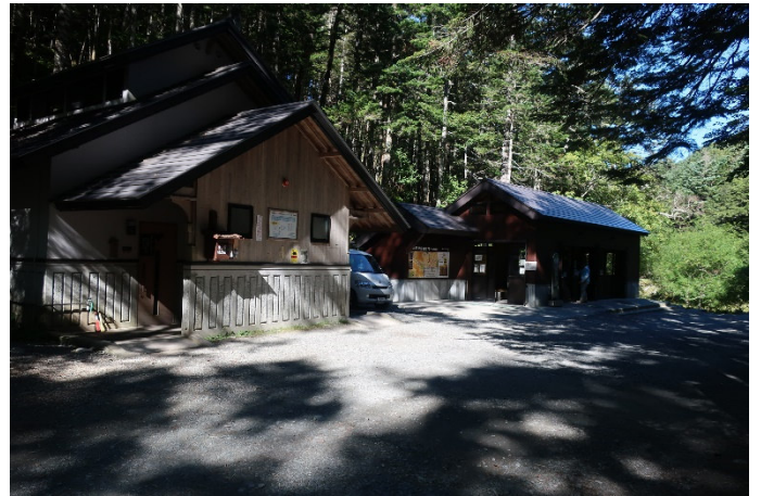
北沢峠に戻って、二子山コースから登る