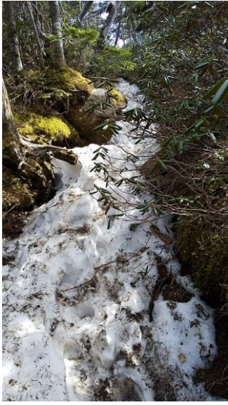
北奥千丈岳への登山道