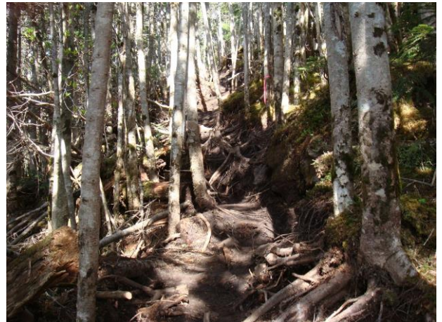
針葉樹林帯の中を登る