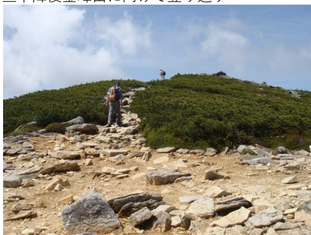
森林限界を超えると、ハイマツ帯になり急に開けて見晴らしが良くなり稜線からの眺望は素晴らしく遠くに五丈岩も見えてきた。