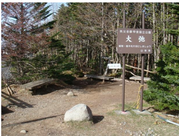
準備運動を済ませ大弛登山口を出発