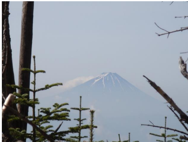
ガレ場を登ると遠くに富士山が見える（ズームUP）