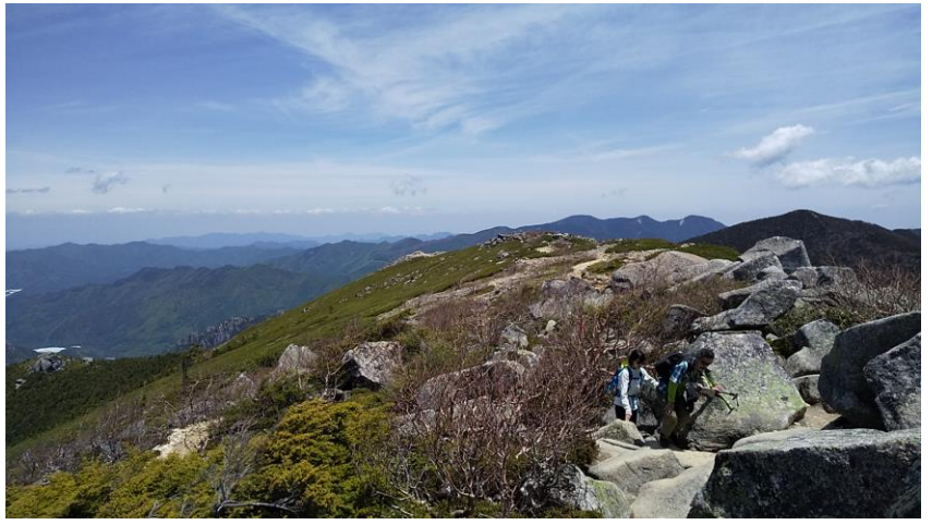
来た道を大弛峠に向けて下山開始