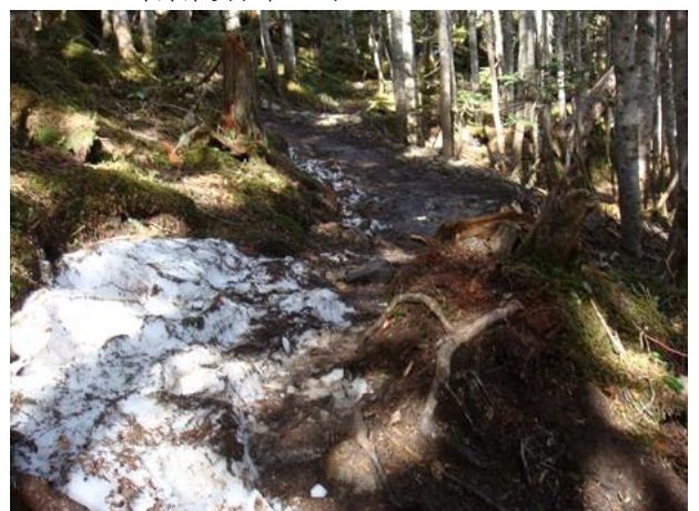
所々雪が残ってぬかるんでいた