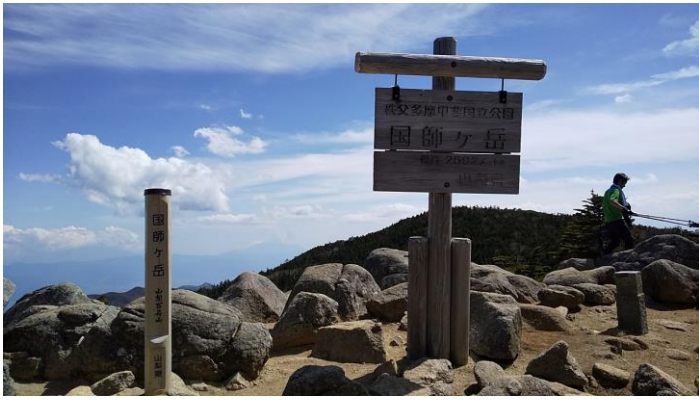
国師ヶ岳山頂と眺望