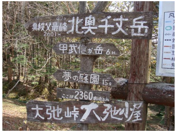
大弛峠に一旦下山後、国師ヶ岳・北奥千丈岳に向けて登る