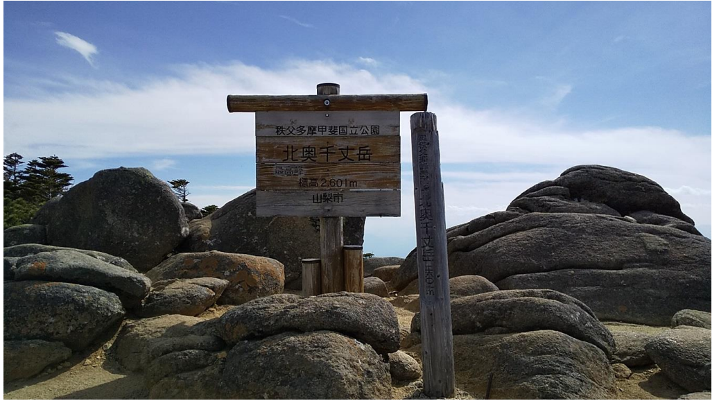
北奥千丈岳山頂（金峰山より標高2m高い2601m奥秩父第2位の高峰）