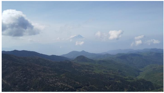
遠くに富士山が見える