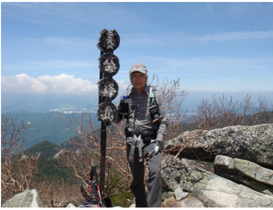
金峰山 山頂にて（標高2599m）