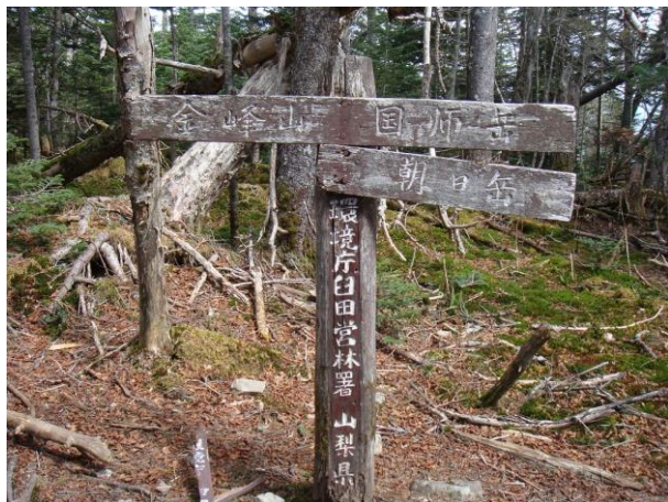
朝日峠から朝日岳に登り、一旦下降後金峰山に向けて登り返す