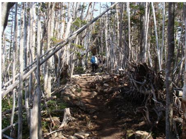
今日の気温19℃ 空気が冷たくて気持ちがいい