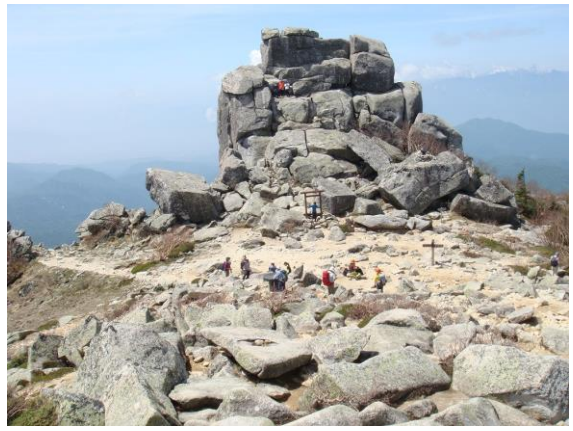
巨大な岩が綺麗に積み重なった五丈岩