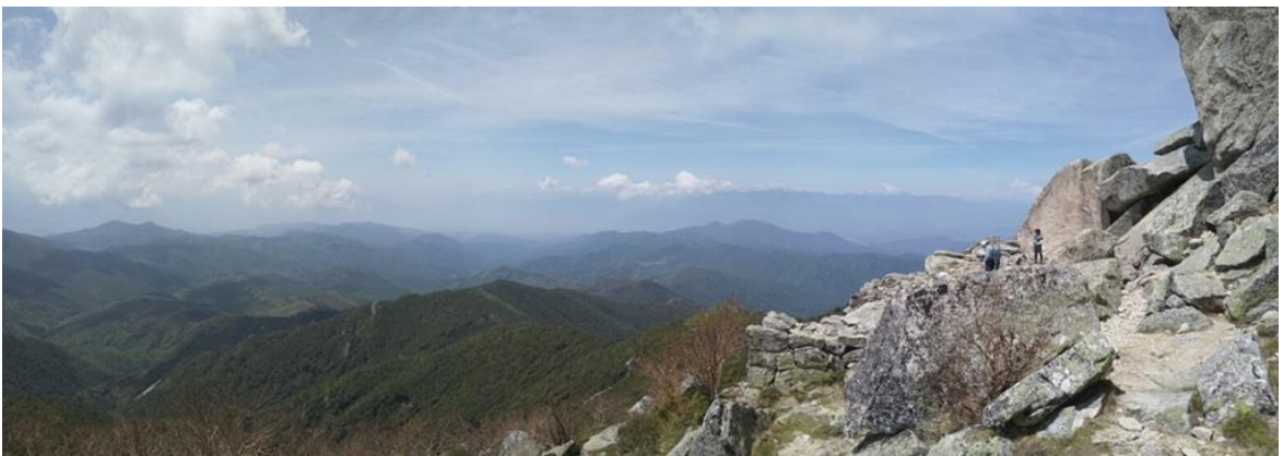
山頂からは大パノラマが見れて「富士山」「南アルプス」「中央アルプス」「八ヶ岳連峰」などグルっと見渡せました