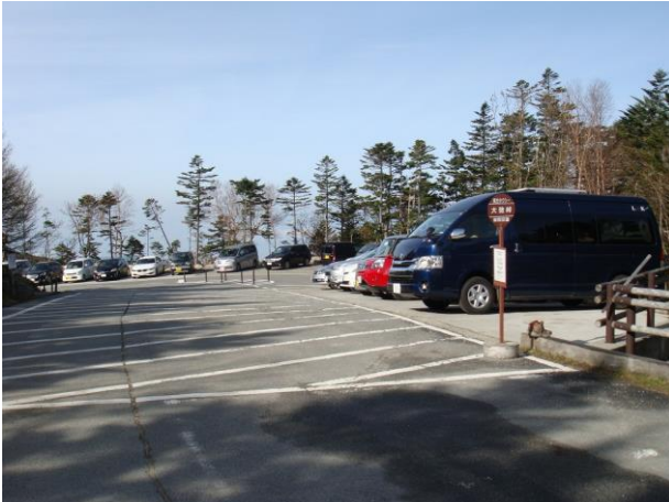
平日朝早いにもかかわらず駐車場はいっぱい

以前から気になっていた山梨県と長野県の県境にある百名山の金峰山。塩山の親戚に行った帰りにでも行こうといつも思っていたが中々行く機会がなかったので、梅雨入り前に思い切って登りに行ってきました。