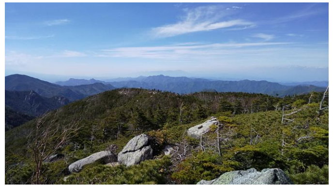
北奥千丈岳山頂からの眺望を楽しんだ