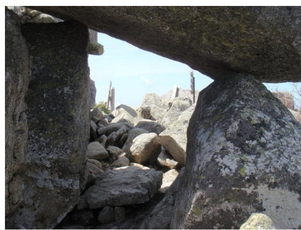
ガレ場を登り、岩のトンネルを潜れば金峰山の山頂