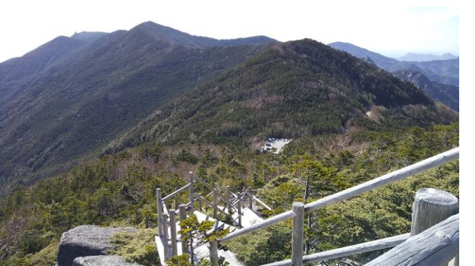
下山ルートは「夢の庭園」コースで大池駐車場に予定より早く下山した