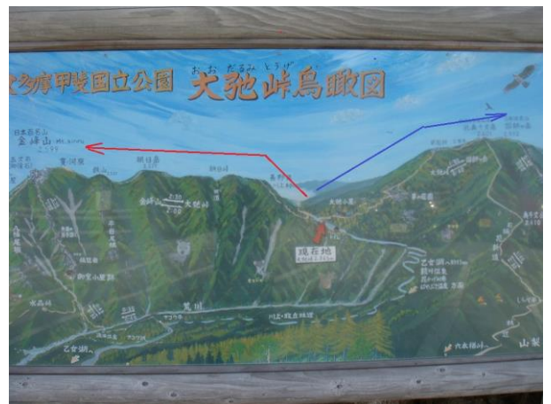
今日の登山ルート