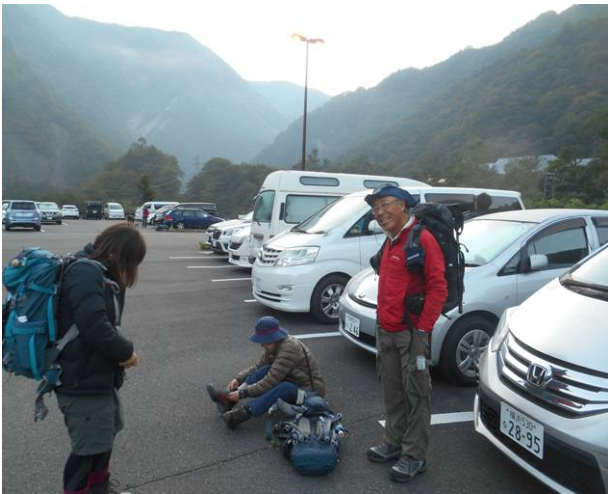
夜が明けたので駐車場で出発準備

昨年台風で中止した山行のリベンジで、自家用車での移動に変更し、朝4時位に沢度駐車場に到着し、夜が明けるのを待って出発した、沢度駐車場ー上高地間のバス代は1名¥1250です、タクシーは¥4200なので、タクシーでの移動、上高地には6時30分に到着し、準備を行い出発。