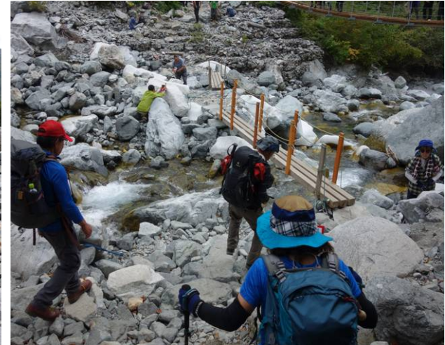
帰りは本谷橋の下側を通過