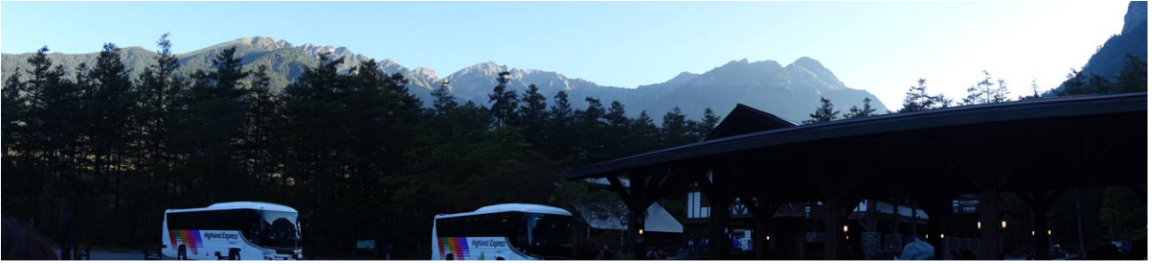
上高地バス停のパノラマ