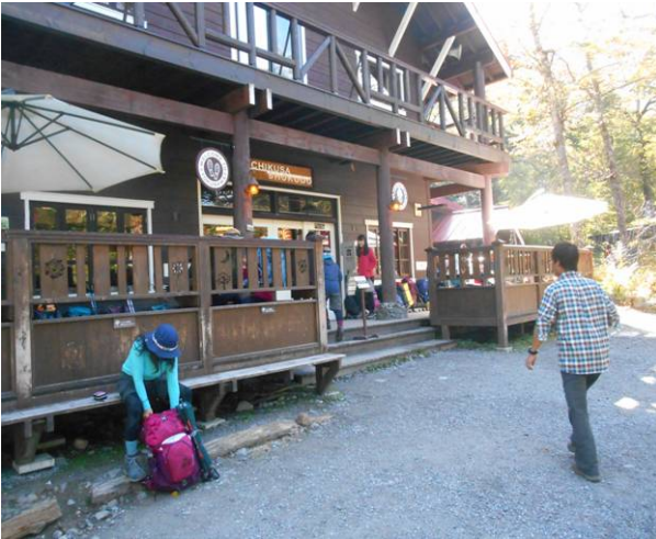
徳沢園に普段よりも人は少ない