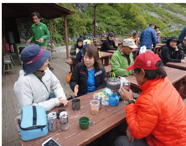
小屋前のテラスで祝盃