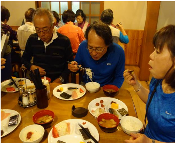
今回小屋はかなり混雑していたので 3回目で 朝食になった