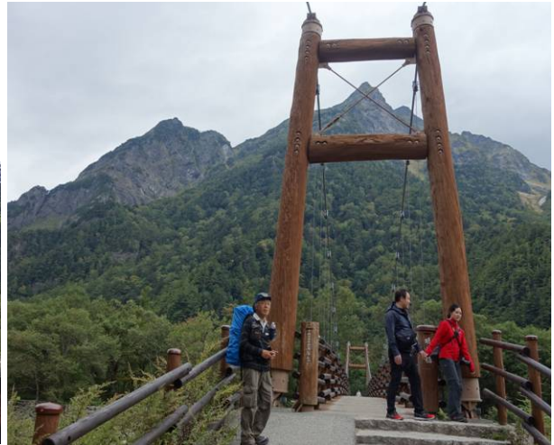
帰りは明神橋を通過