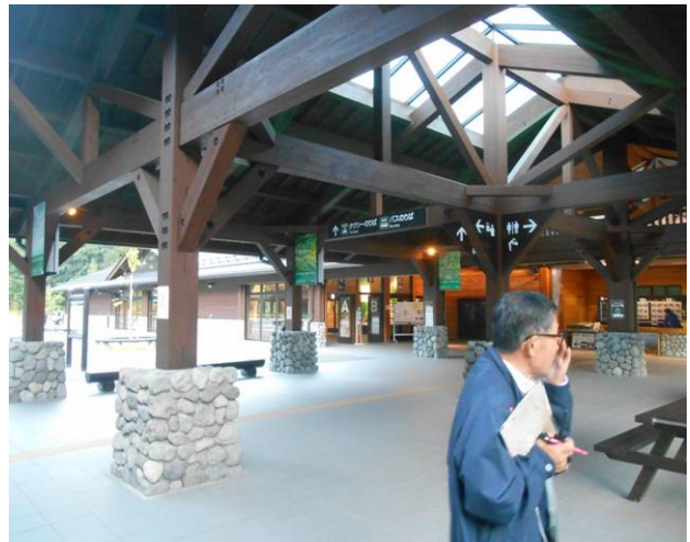
沢度駐バスターミナル平日なので人は少ない