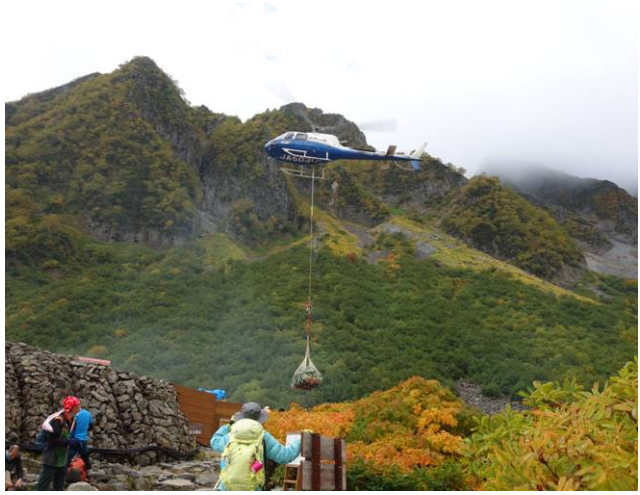
シーズンなので荷揚げのヘリが頻繁に来る