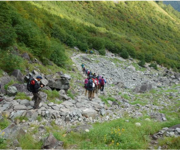
ヒュッテより涸沢小屋分岐へ