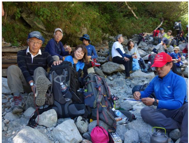
本谷橋でコーヒータイム ここからが本格的な登山道になる