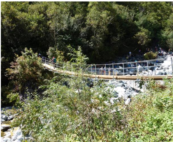
本谷橋 上の吊り橋