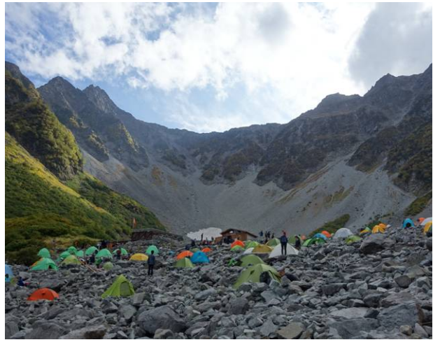
涸沢テントサイト