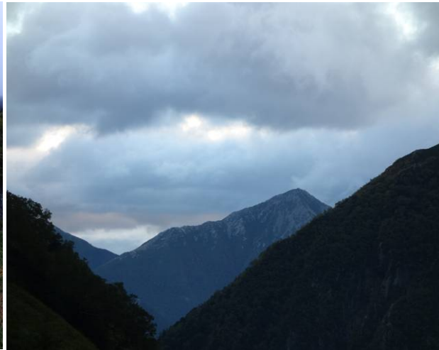
常念岳方面は晴れていそう