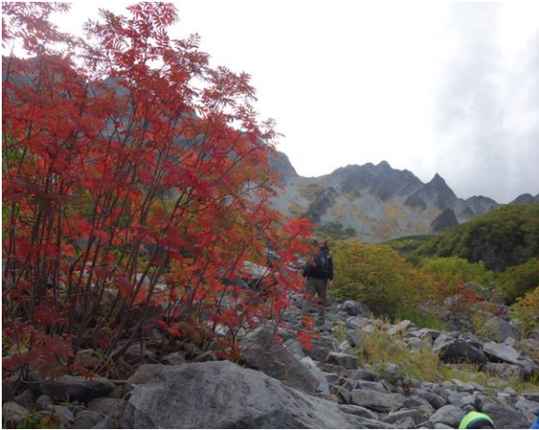
今年の紅葉は遅がここのナナカマドは紅葉していた