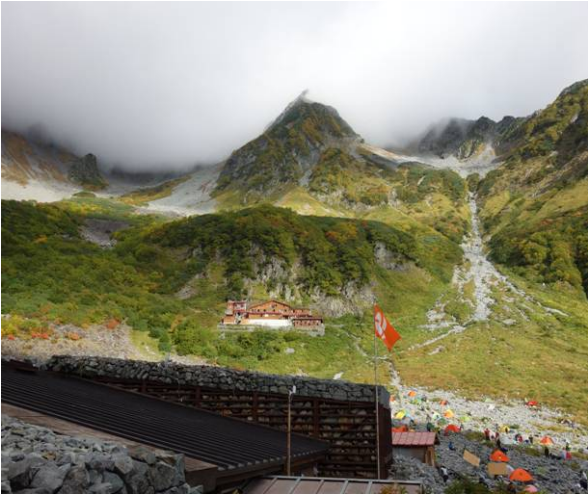
ヒュッテより見た