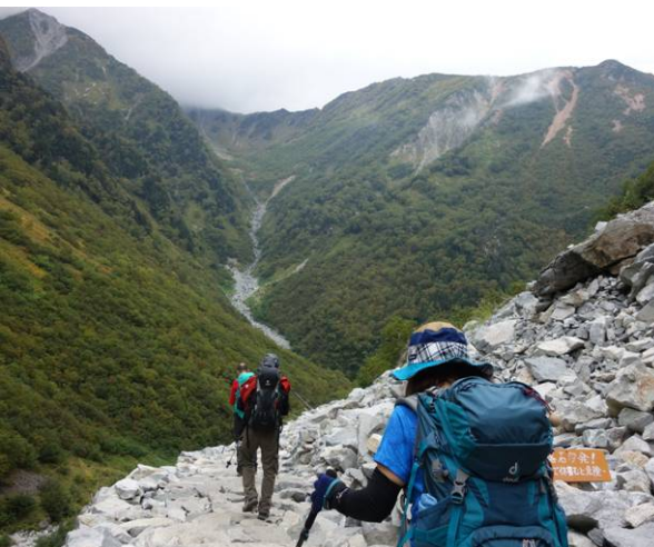
ガレ場を危険なので早く通過