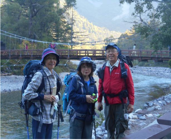
河童橋をバックに写真撮影