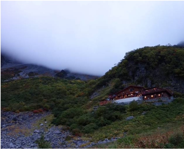
翌朝モルゲンロートを見に出かけたがあいにくの天気で見られません