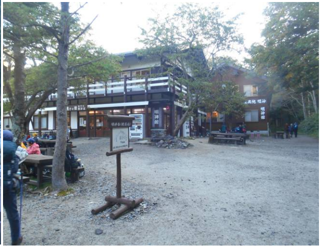
明神館に平日なので人が少ない