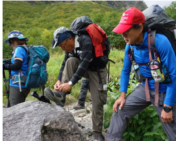
下りなので靴ひもの再調整