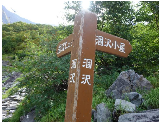
涸沢小屋分岐 地図では小屋まで5分 となっているが、実際は15-20分