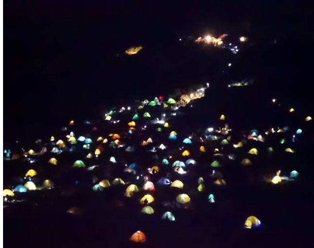
夜のキャンプサイト テントの灯りが綺麗