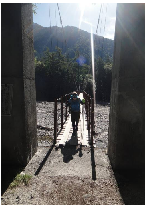
新村橋を渡り対岸に