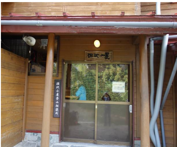
涸沢小屋 建物は立派