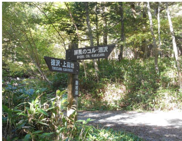
対岸にはパノラマコースの入り口