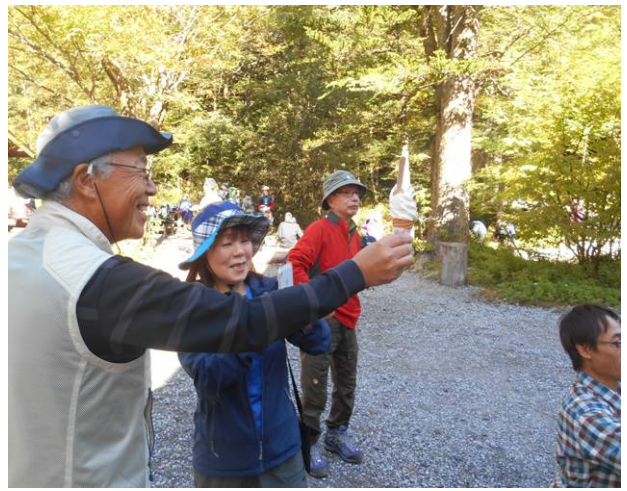
徳沢園で有名なアイスクリームを注文