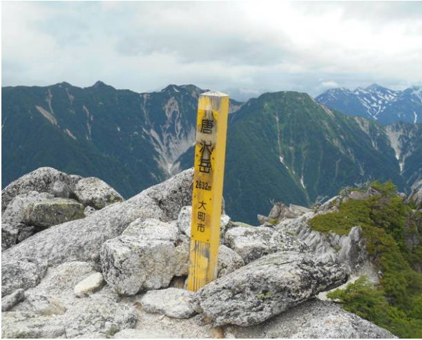
唐沢岳山頂 場所が一番奥