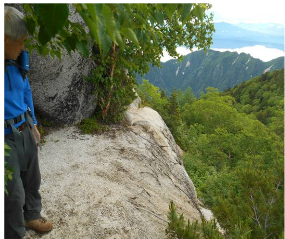
岩の淵を通過した所帰りが心配