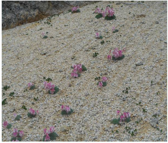
山頂付近にコマクサが数多く咲いていた