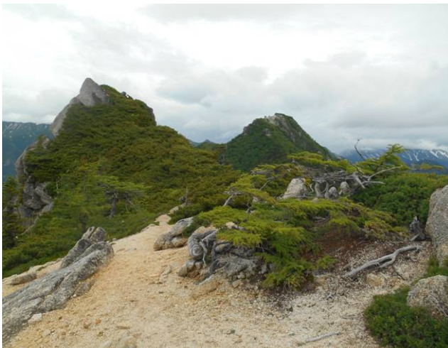
手前の山の左側を巻いて通過