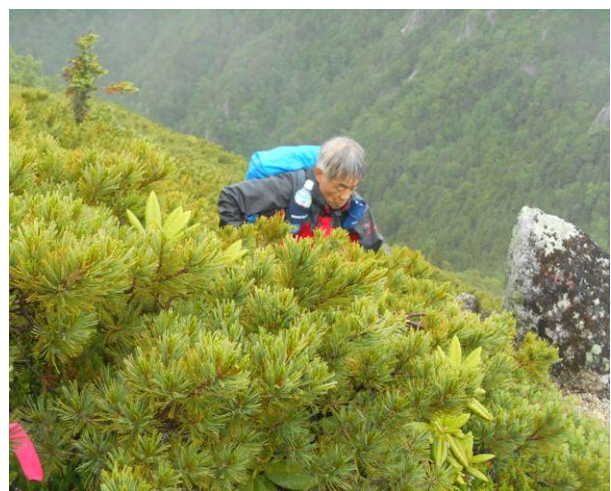
帰り西餓鬼岳分岐前 道は狭く 雨でハイマツに着いた露でズボンがずぶ濡れ