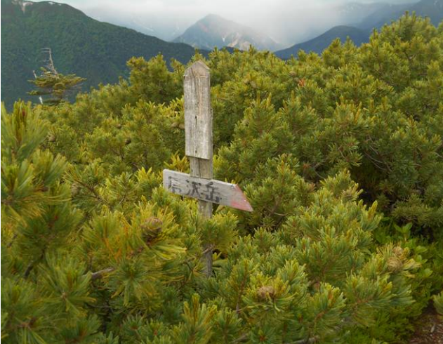
西餓鬼岳への分岐点 これから餓鬼のコブまで急な斜面を下り 登り返します