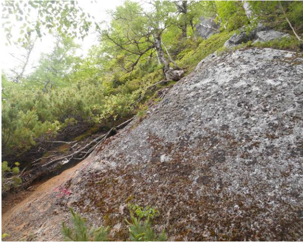
ここが唐沢岳への登山道かなりの急な登りです