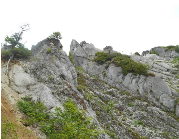
唐沢岳への登山道はこの岩山を越え 裏側を下ります