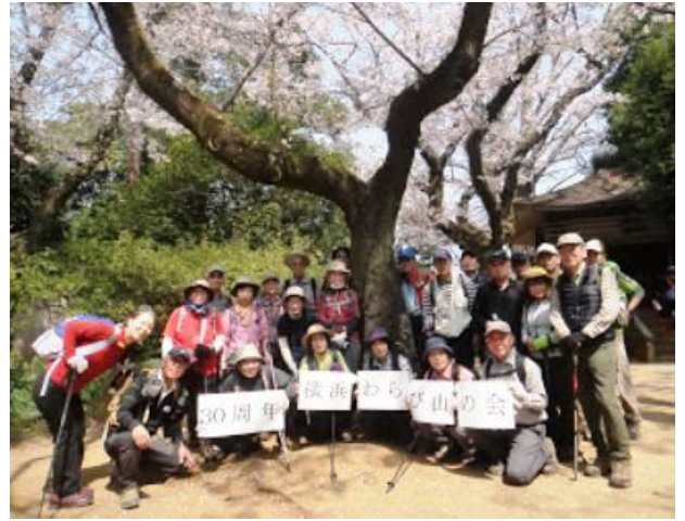
弘法山でも記念撮影