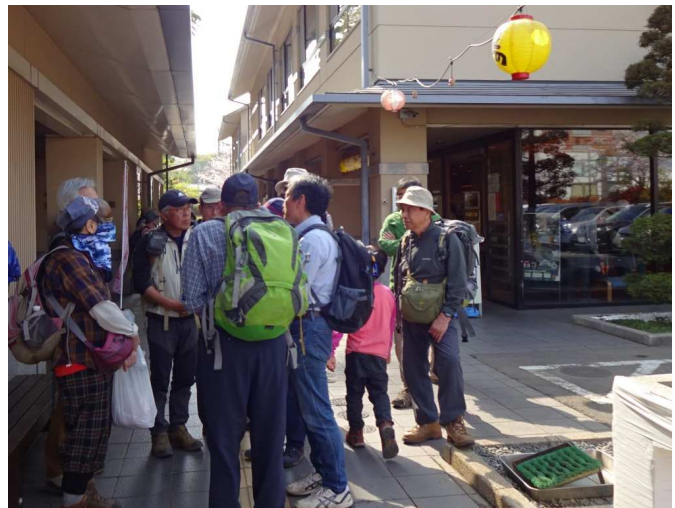
お風呂に入りほろ酔い気分で帰路につく