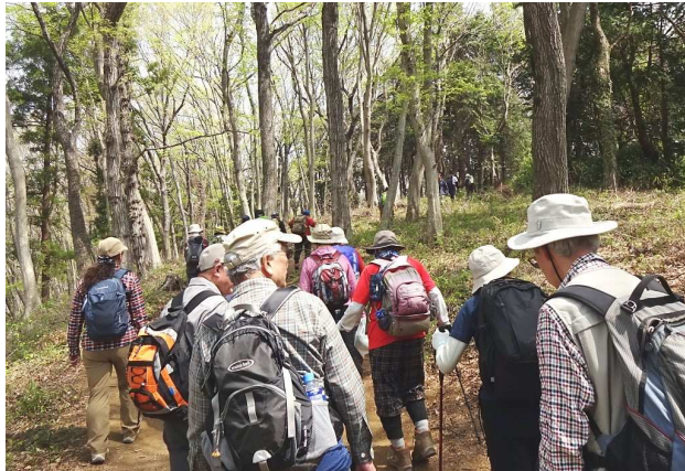
最後のピーク吾妻山、弘法の湯に入る男性陣のみ先行して 先へ