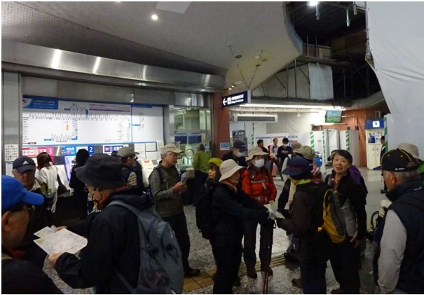
2 グループに分けて歩いてゆく

秦野駅改札前では奇遇にも“横浜山の会、”と“横浜わらび山の会が、待ち合わせしていたのだった