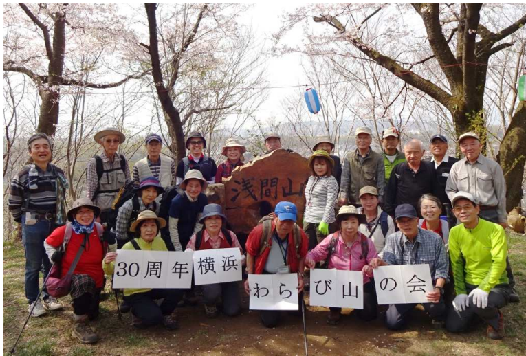
ワインで30周年記念の乾杯セレモニー