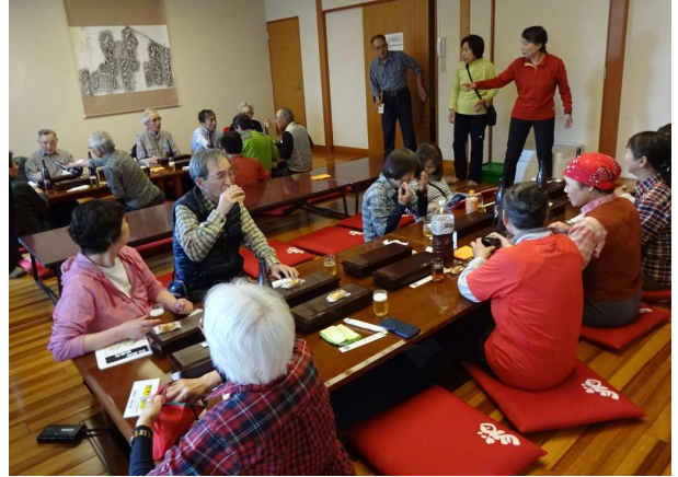
ワイン、ビール、差し入れの濁り酒(どぶろく)と盛り沢山のお酒で皆さん大満足でした