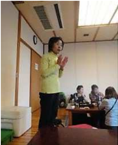
今回の山行リーダーから一言