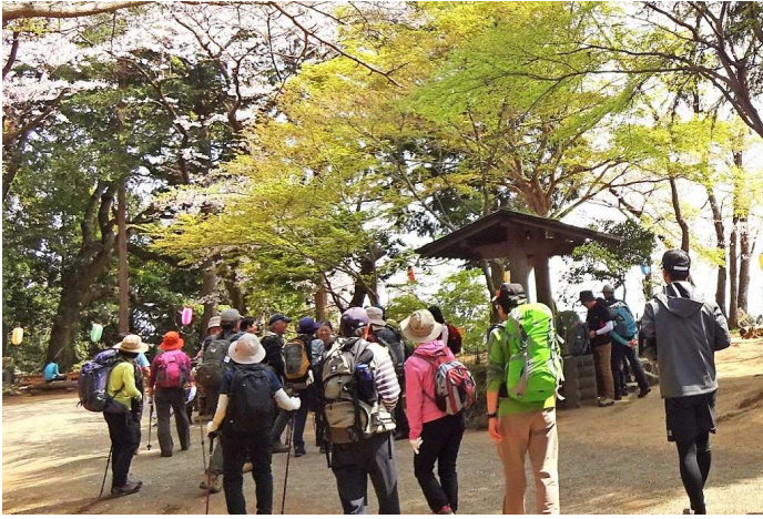
丹沢表尾根、三ノ塔、二ノ塔、岳ノ台、大山の稜線