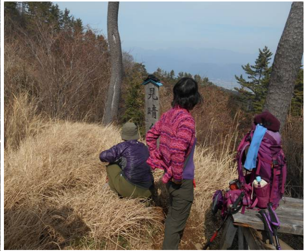
見晴らし台 本来は相模湾が良く見えるが 今日は霞んでいて、見えない