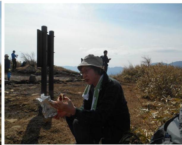
又即席のお汁粉を作った