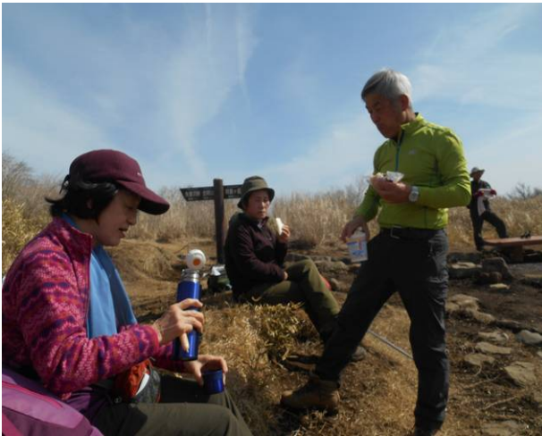
明神ヶ岳での昼食タイム 風もなく陽ざしがあり