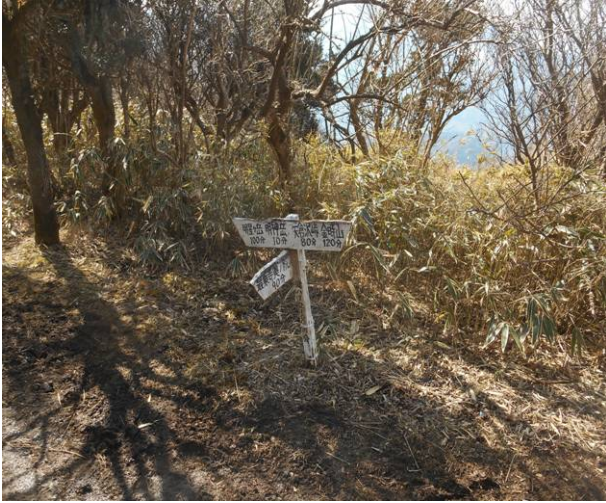
尾根分岐 バリルートですが 標識はあります