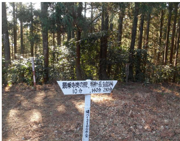
奥の院裏の登山口