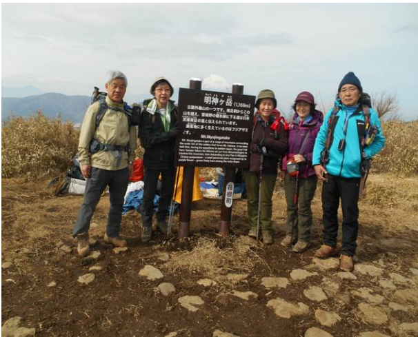
出発前に皆で記念撮影 後ろに富士山が少し見える