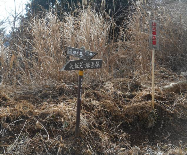
途中林道にぶつかり約数百メートル 林道を歩く