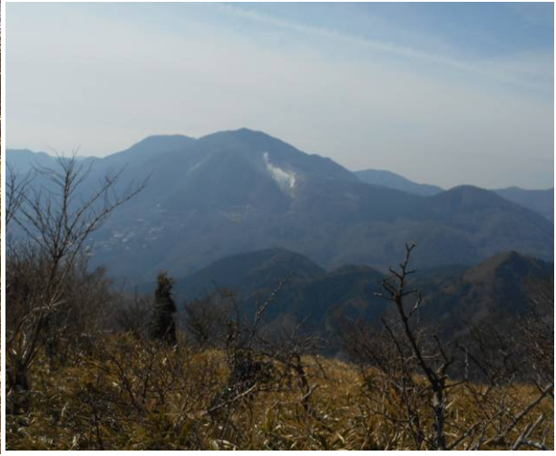
尾根より見た箱根山 真ん中の蒸気は大涌谷