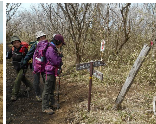
今回の下山ルート二宮金次郎草刈り路の分岐 このルートはあまり利用されてはいないが 登山道は良く整備されている