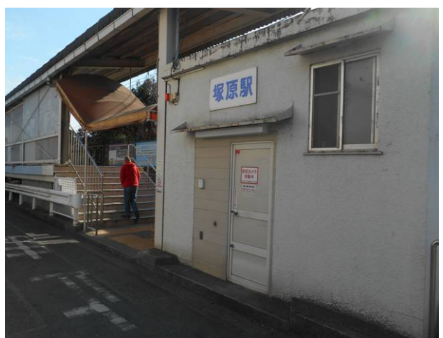
塚原駅に到着 無人駅ですがスイカは利用できます