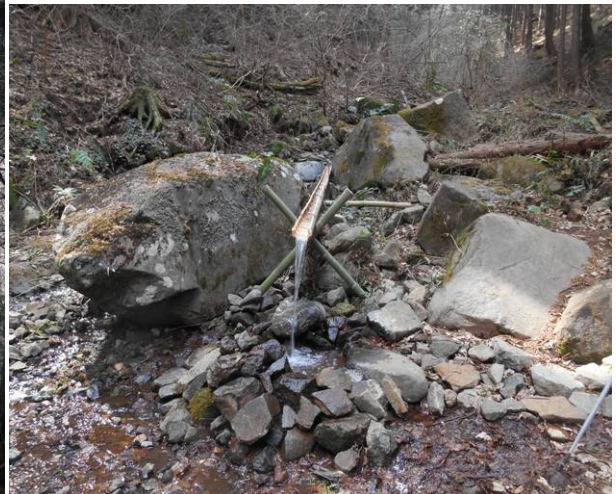
登山口に川の水で手洗いが出来る様に 竹の樋が設置されていた