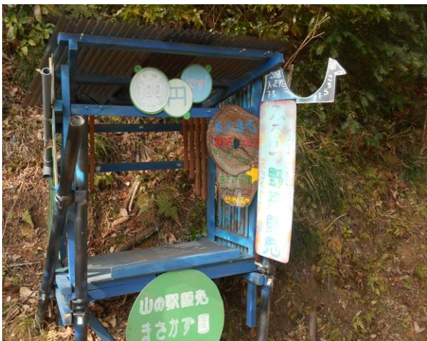
塚原集落での無人販売ですが 売っている物が、まきでした