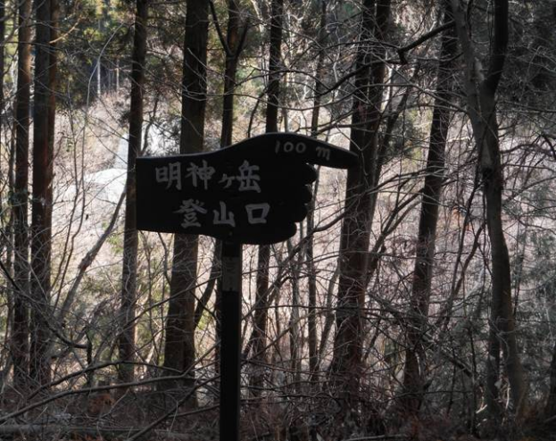
明神ヶ岳登山口起点