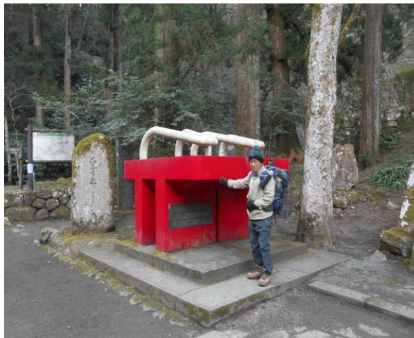
最乗寺で出発準備 杉林の為日影ですこし寒い 最乗寺の下駄この左側が通常明神ヶ岳登山口