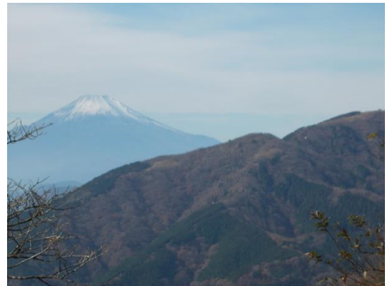
富士見台から富士の眺望