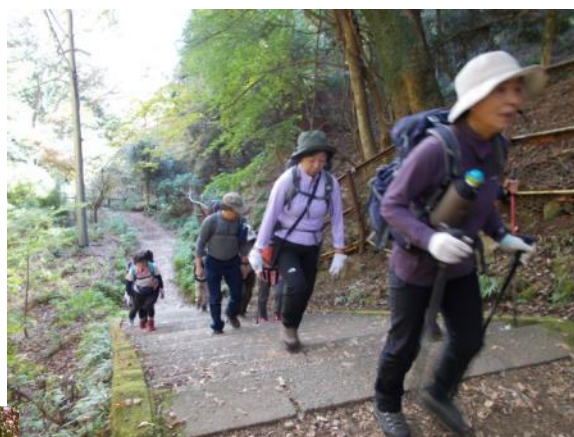
女坂に行くも楽ではない