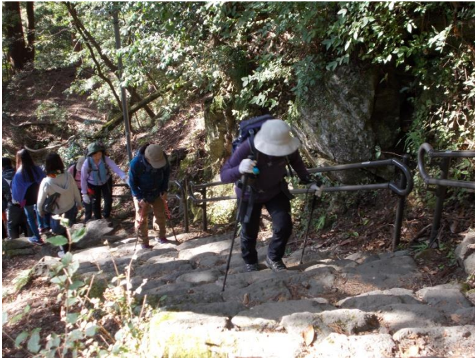
六根清浄大山は晴天