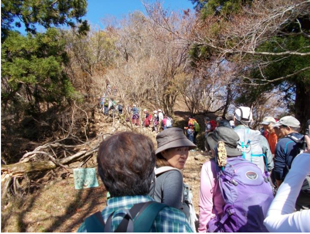
もうすぐ頂上ですがこの行列