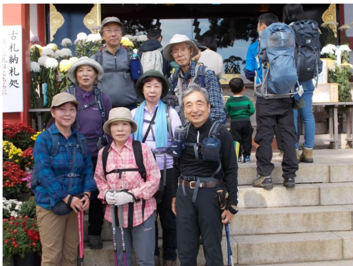
阿夫利神社下社にて