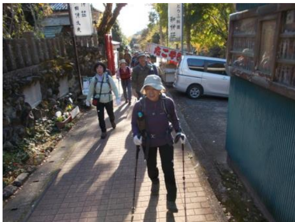
ケーブル口バス停からこま参道へ

大山は暫く登っていないとの思いと、それなら秋の紅葉時に登ろうと今回の実施に至りました。伊勢原駅を降りると大山登山の方々でバスは行列でした。紅葉は期待したほどではありませんでしたが、登山道も頂上も黒山の人でビックリでした。でも秋も深まる11月中旬ですが1か月くらい前の陽気で爽やかな1日を満喫しました。