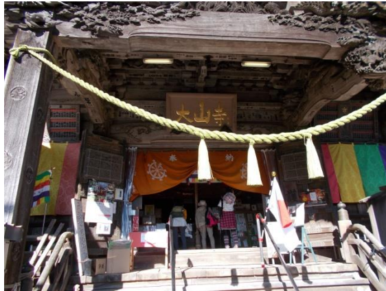
ここは神社でなく大山寺