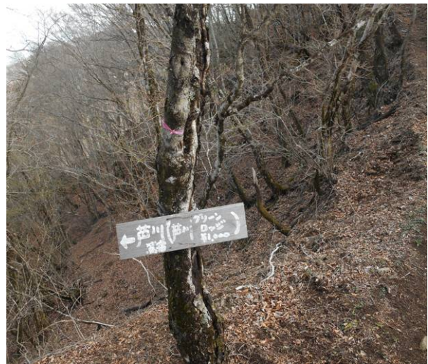
地図に出ていないルート表示