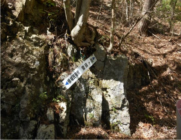
東入川砂防堤公園 広場があるのみ