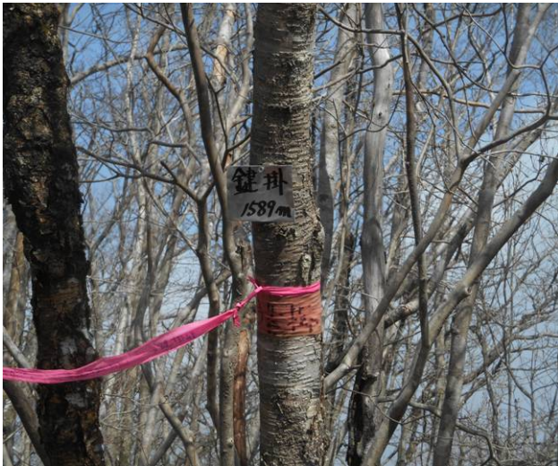
鍵掛に到着 標識は木に