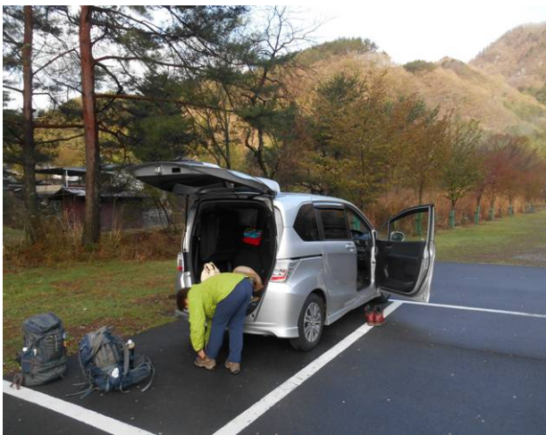
朝食後 出発準備 駐車場所は手前奥の芝生

王岳へのアクセスが悪い為、行きにくい山の為 車中泊で行く計画を立てた、前日は道の駅なるさわに深夜2時に到着、駐車場は満杯の状態でした、隅に空きスペースがあり停車、ここは24時間トイレの使用が出来、綺麗です、売店はありますが、営業時間が 朝9:00から午後5:00までです、近くに24時間のコンビニがあり、必要な物の調達はできます、朝5:00に駐車場を出発し、コンビニで朝食、および昼食を購入し、根場駐車場に向かう、駐車場には6時前に到着、駐車場には一台も車はいなかった、このトイレはシャッターがあり、時間が来ないと使用できない、駐車場で朝食および登山準備を行い、出発した、駐車場は登山者用の隅の芝生の場所が指定されていた。