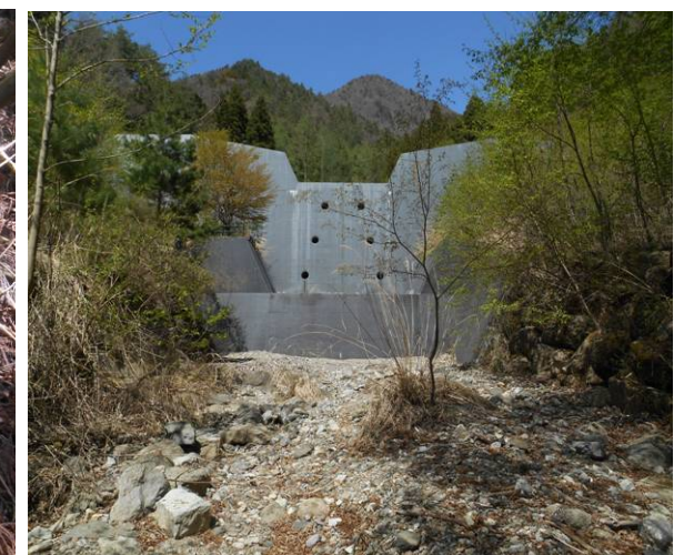
東入川砂防堤 かなり大きい