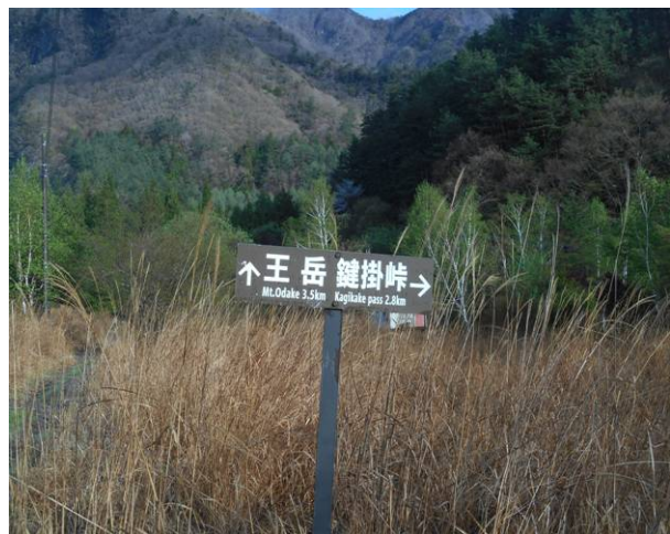
ここから鍵掛峠と王岳の分岐駐車場出口