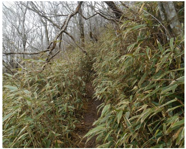
途中から笹が多く昨日の雨の影響でズボンがずぶ濡れ状態