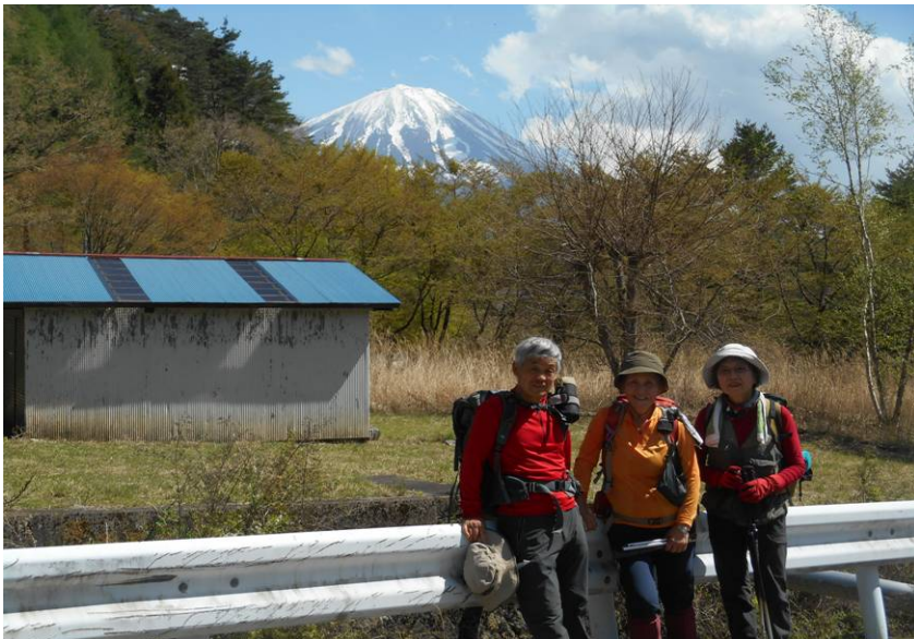
富士山山頂が見えた 最後に見ることができた