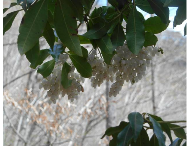
馬酔木の花が満開