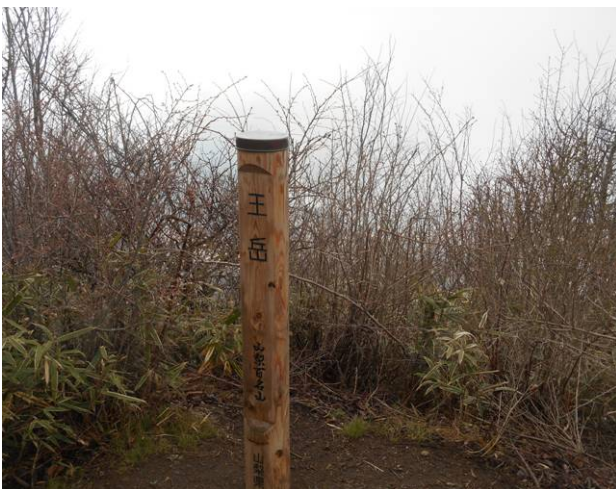
王岳山頂 霧が出て展望はない