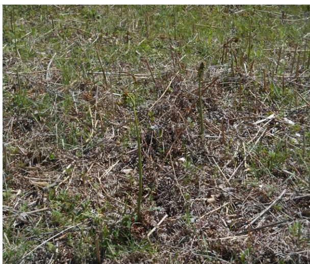
わらびの群生地 綱が張ってあり 取る事は出来なかった (良いわらびです)