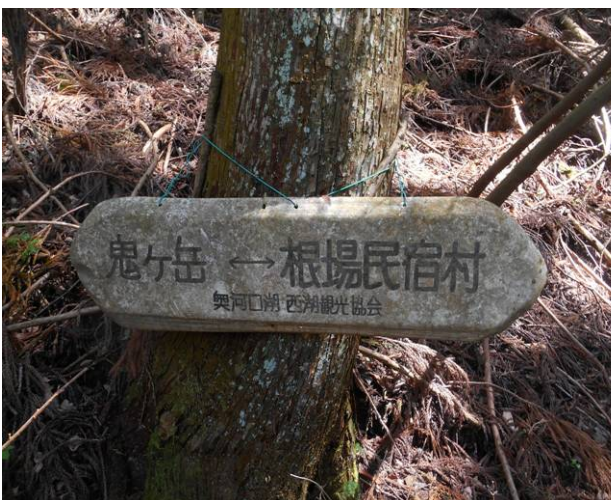
古い標識 手前の標識では雪頭岳の表示