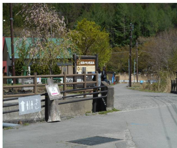
根場駐車場に到着 観光客がいたが 思っていたよりは、空いている