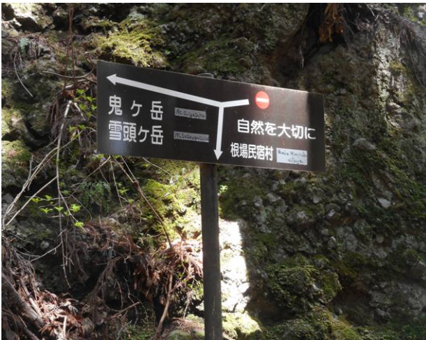
途中の標識 行き止まりの表記があるが登山道は確認できなかった