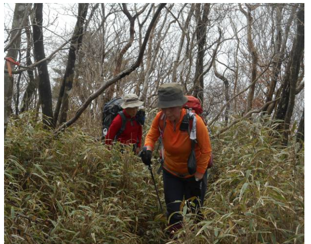
最後の笹藪もう少しで王岳