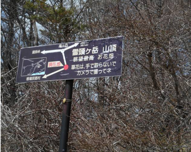
雪頭岳 広い場所があり昼食場所に最適な場所です