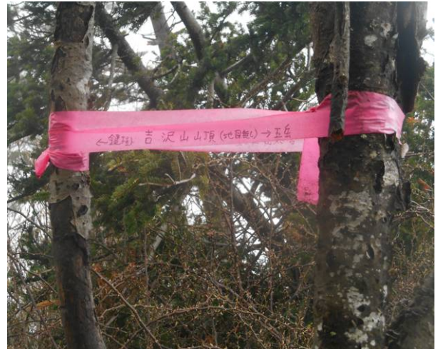
地図には無いが吉沢山 表記