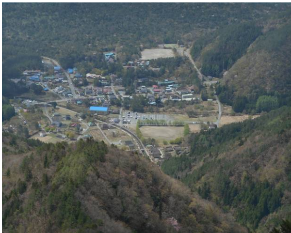
天候が回復し 朝出発した根場駐車場が見てた