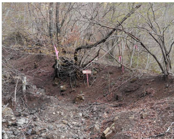
登山道が一部崩落上の尾根が登山道