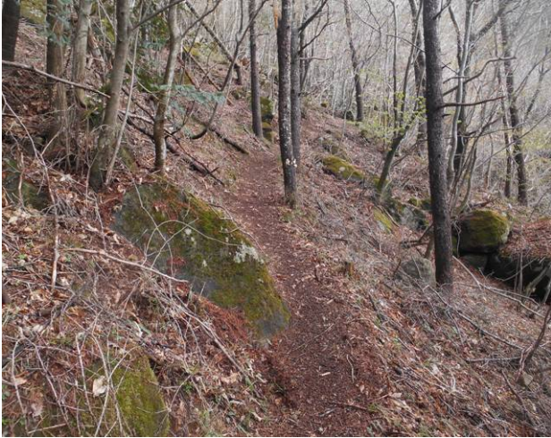
細い登山道でかなりの急な登り