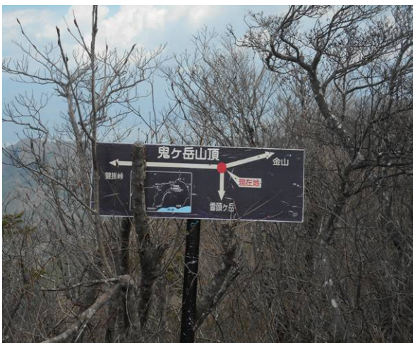
鬼ヶ岳山頂 3名の登山者がいた 場所が狭いので昼食は雪頭ヶ岳にした