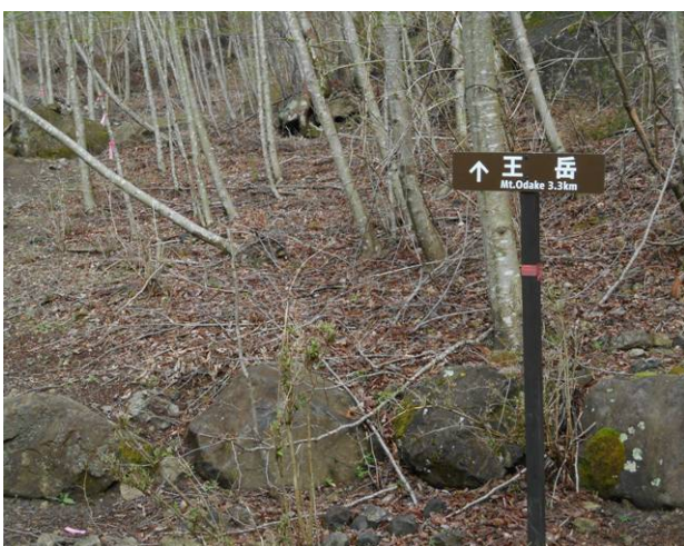
林道を約50分歩くと登山口に到着